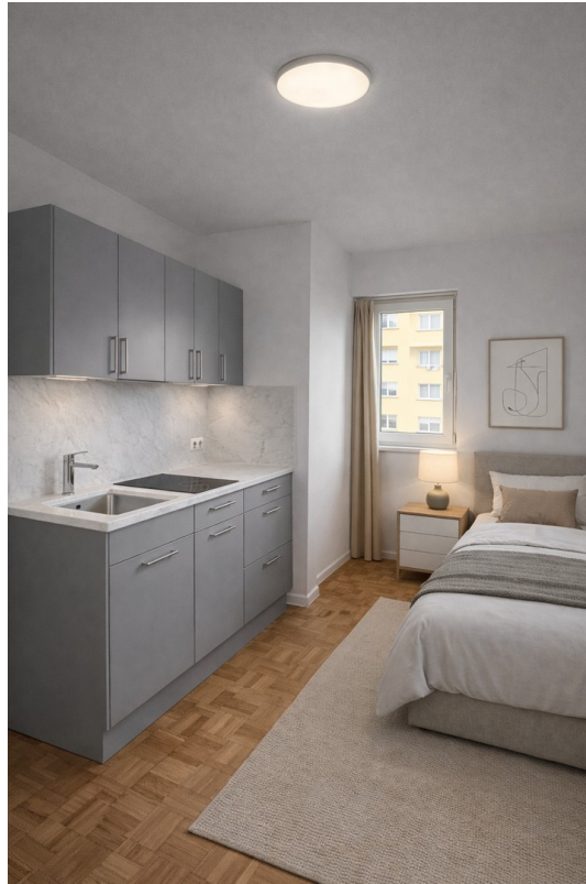
Wohn / Schlafzimmer