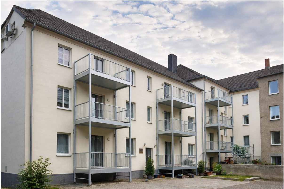
Balkone und Fassade