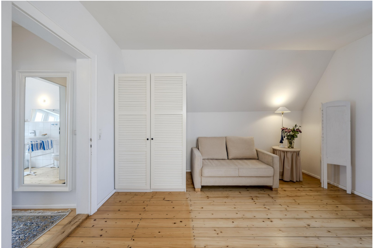
OG Schlafzimmer 1