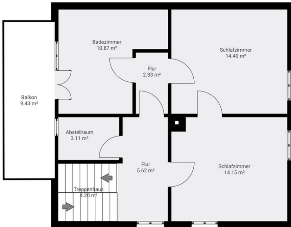
Grundriss EG und OG