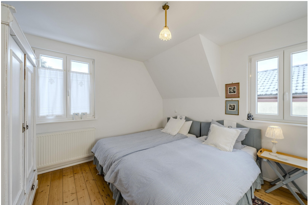
OG Schlafzimmer 2