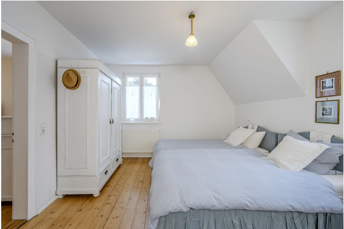
OG Schlafzimmer 2