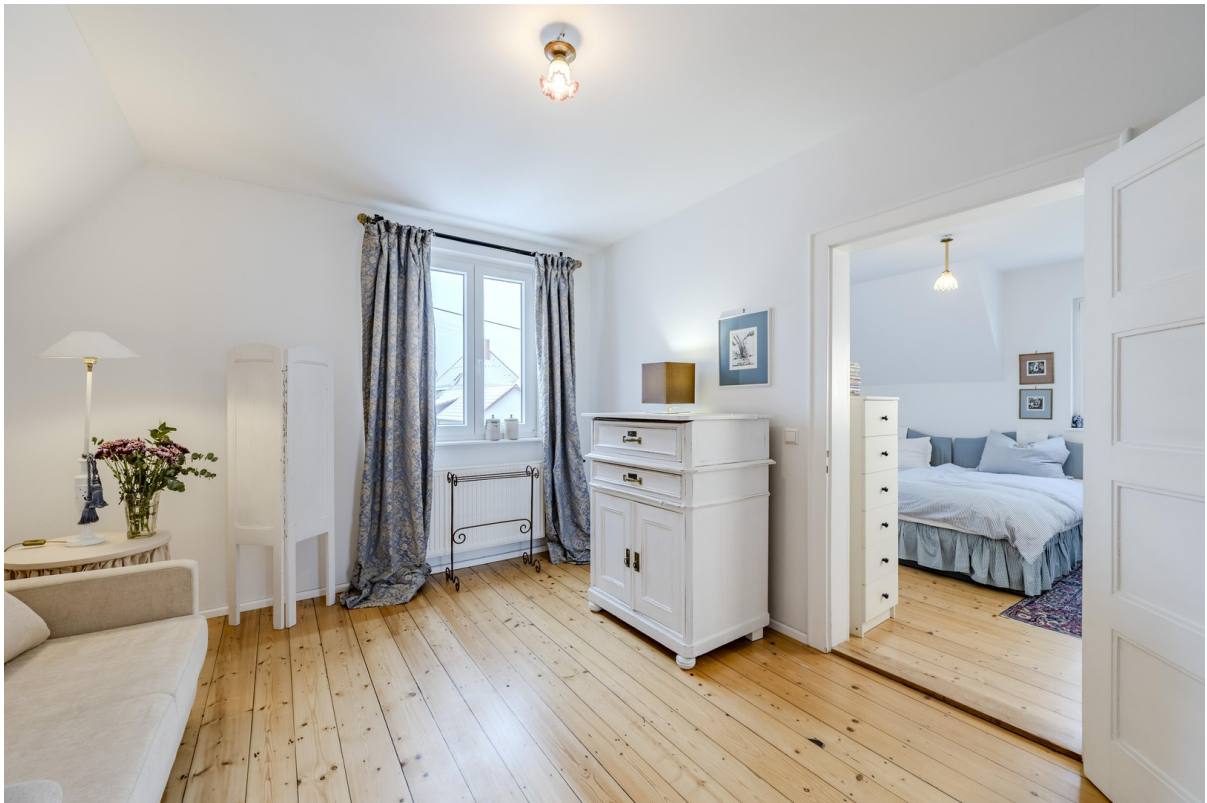
OG Schlafzimmer 1