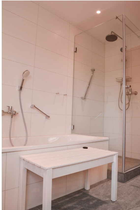
Bad im OG