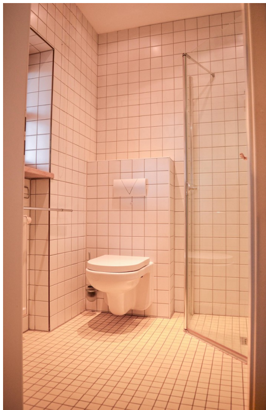
Gästebad mit Dusche