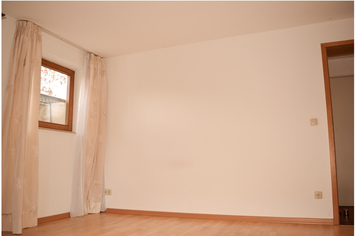
Zimmer 1 im Souterrain