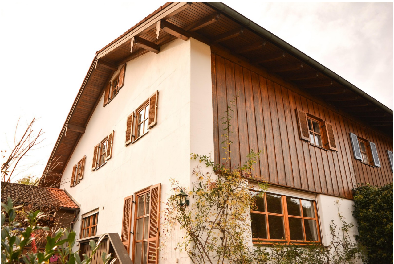
Haus Ansicht Ost und Nordseite