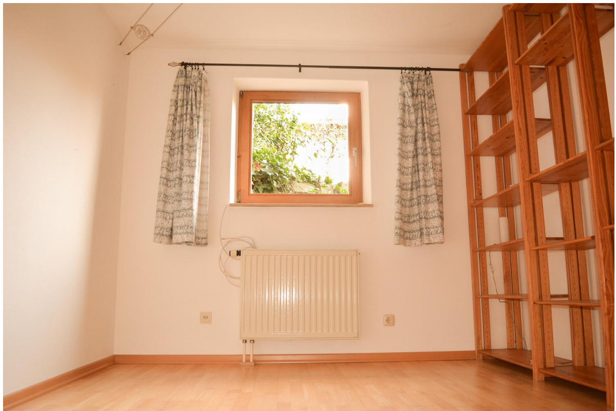
Zimmer 2 im Souterrain