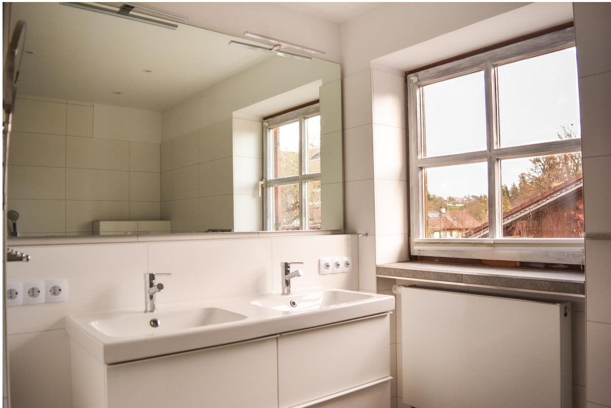
Bad im OG