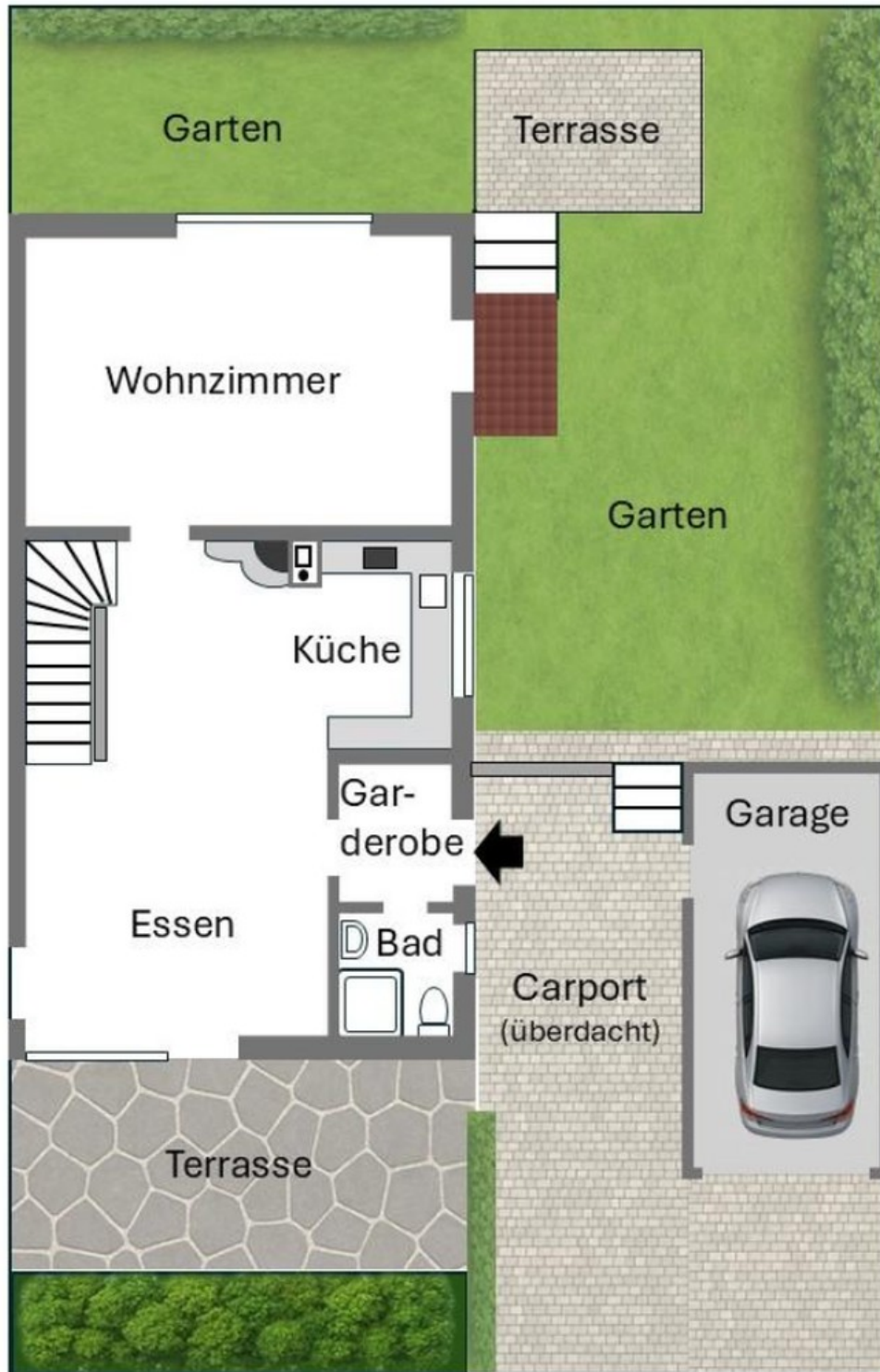
Erdgeschoss und Aussenanlage