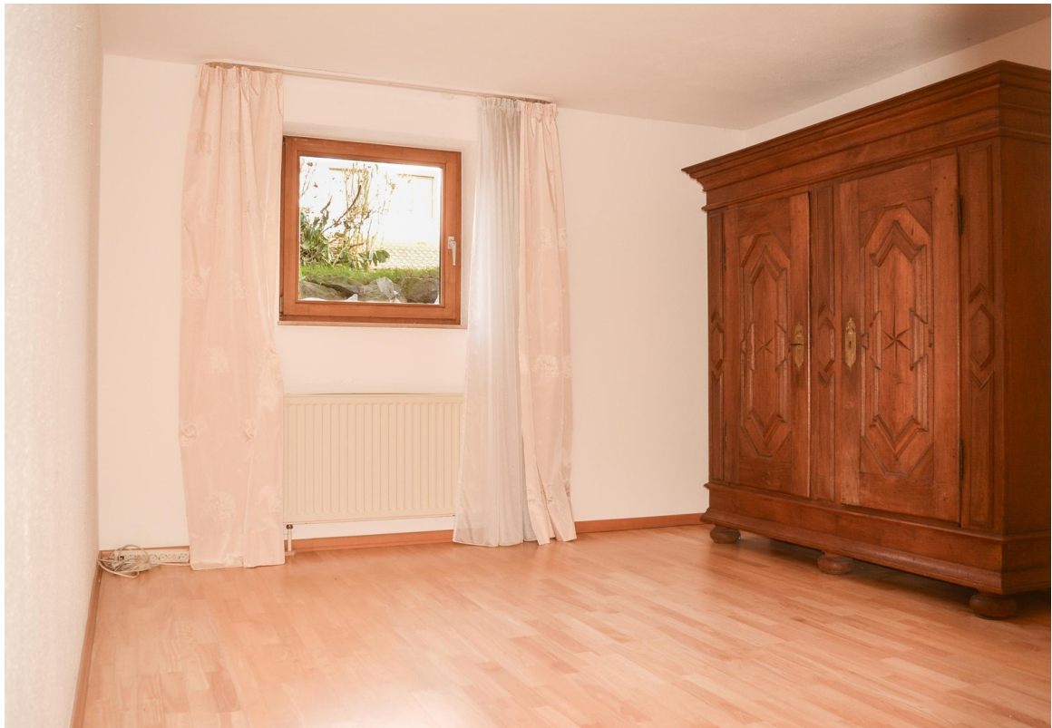
Zimmer 1 im Souterrain