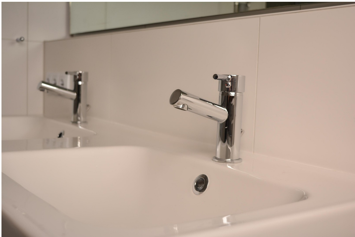
Bad im OG