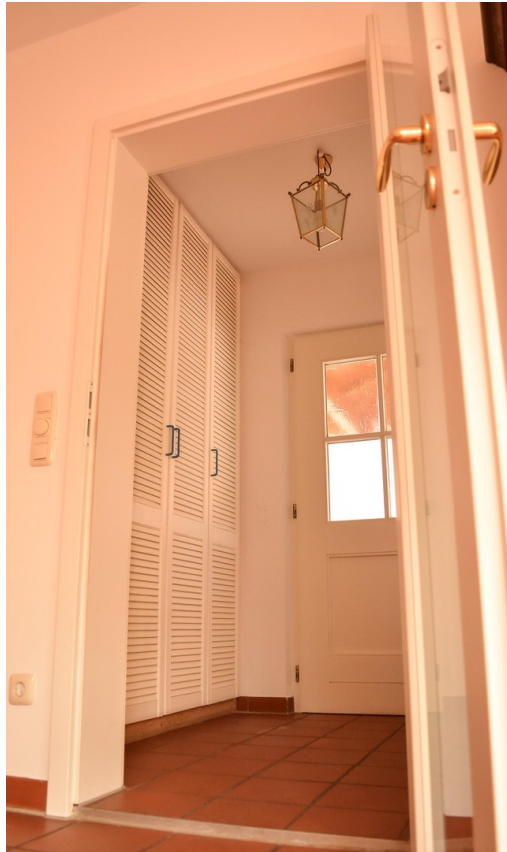
Eingang und Garderobe