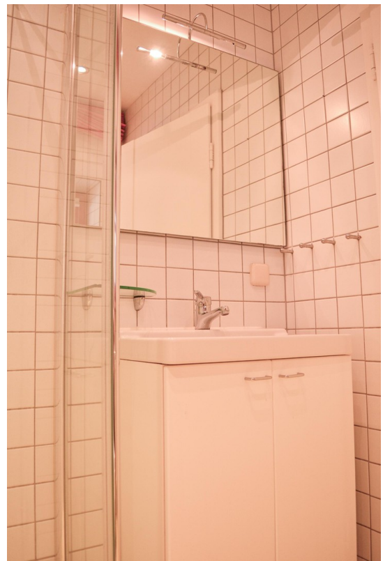
Gästebad mit Dusche