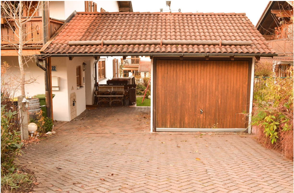
Garage und Carport