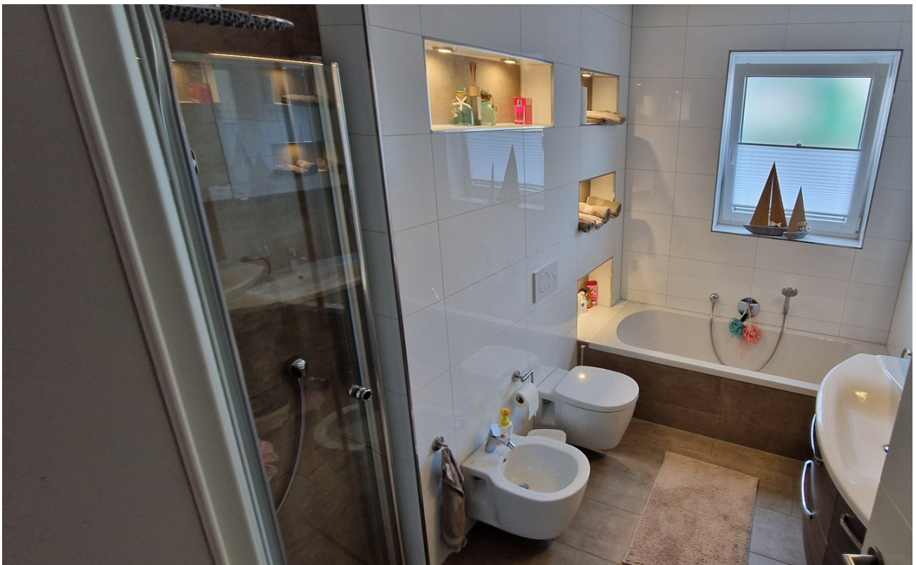
Badezimmer mit Bidet und co.