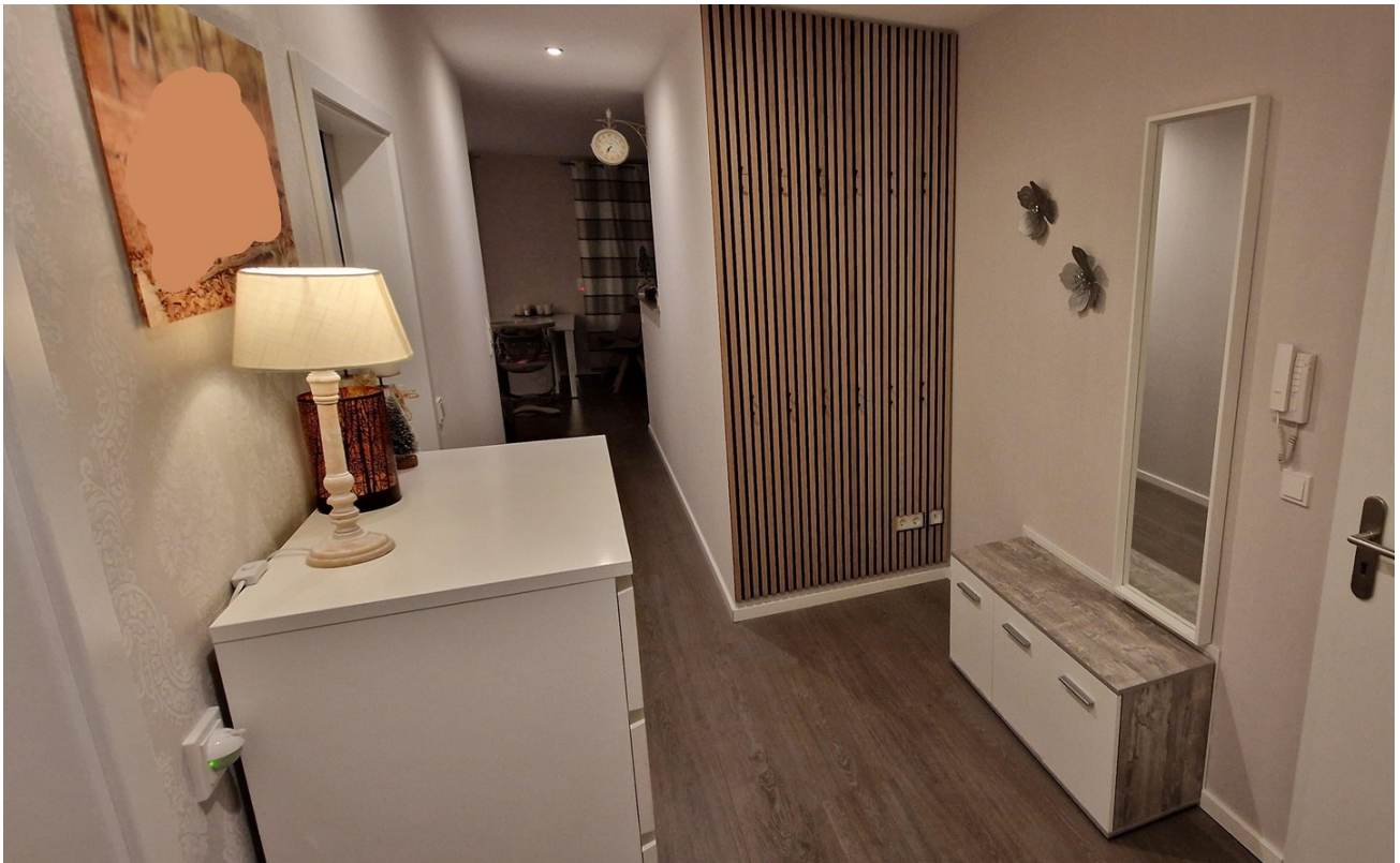
Flur / Diele