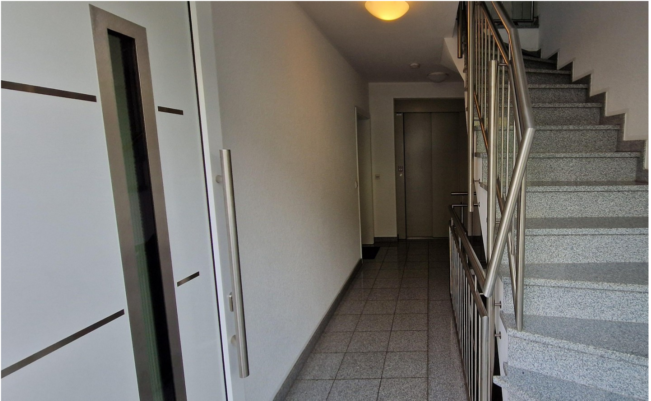
Treppenhaus mit Aufzug