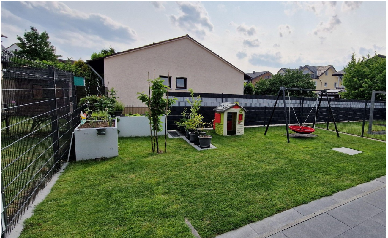
Garten ca 120m 2