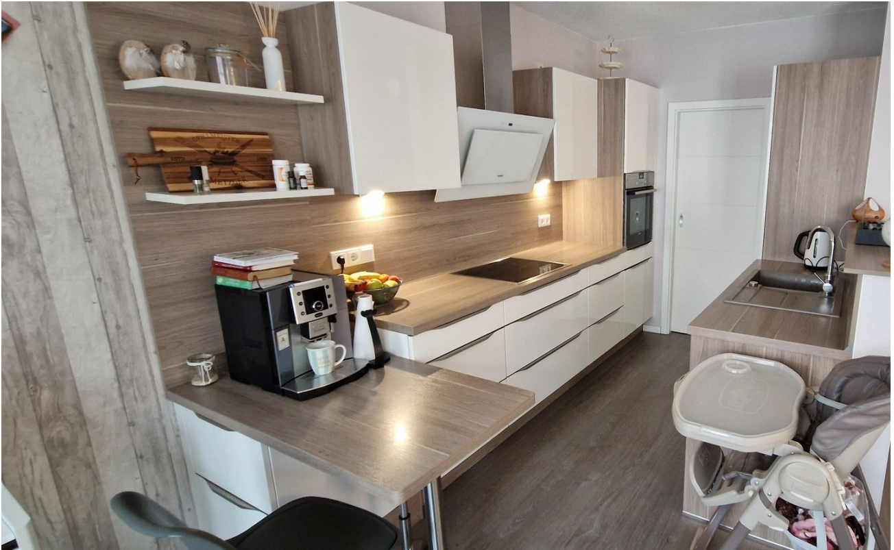
Küche, mit Abstellraum hinten