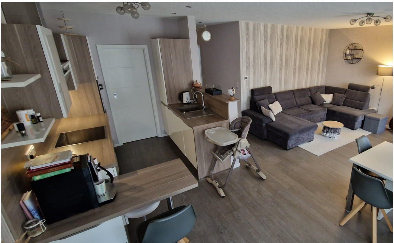
Küche mit Wohnzimmer