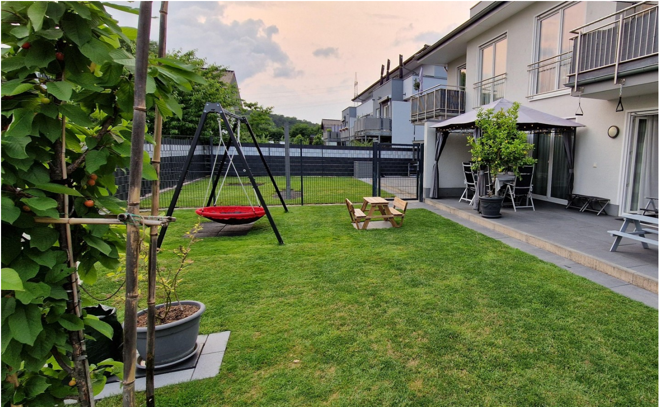
Terrasse ca. 21m 2