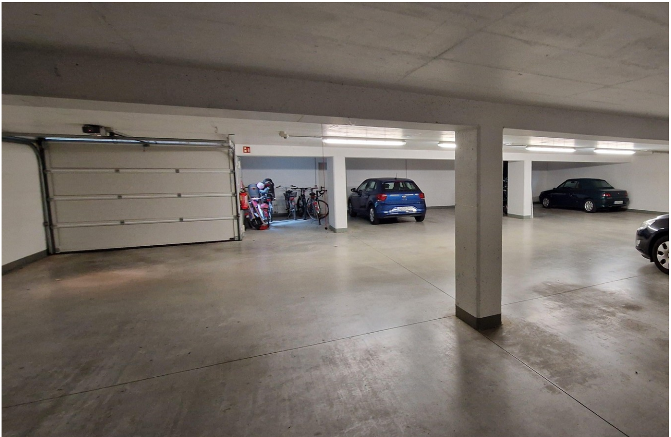
Tiefgarage mit 2 Stellplätzen