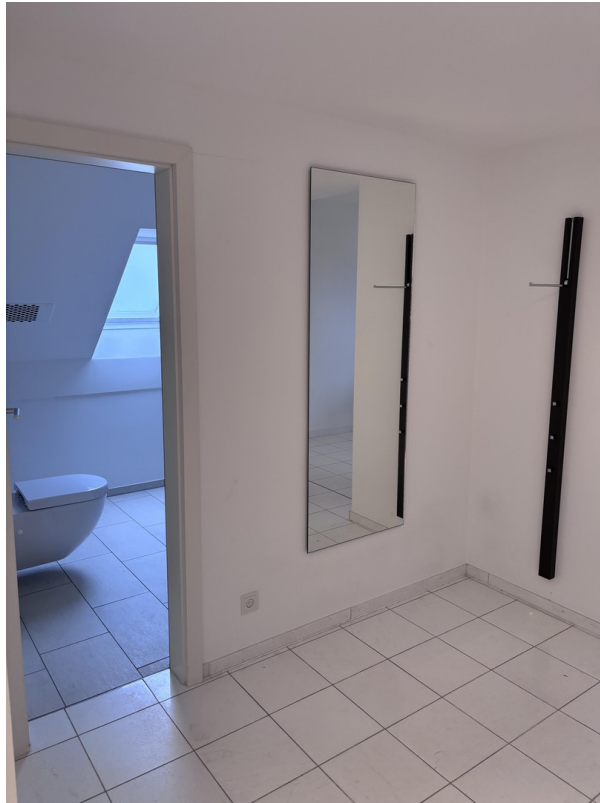
Garderobe und Gäste WC