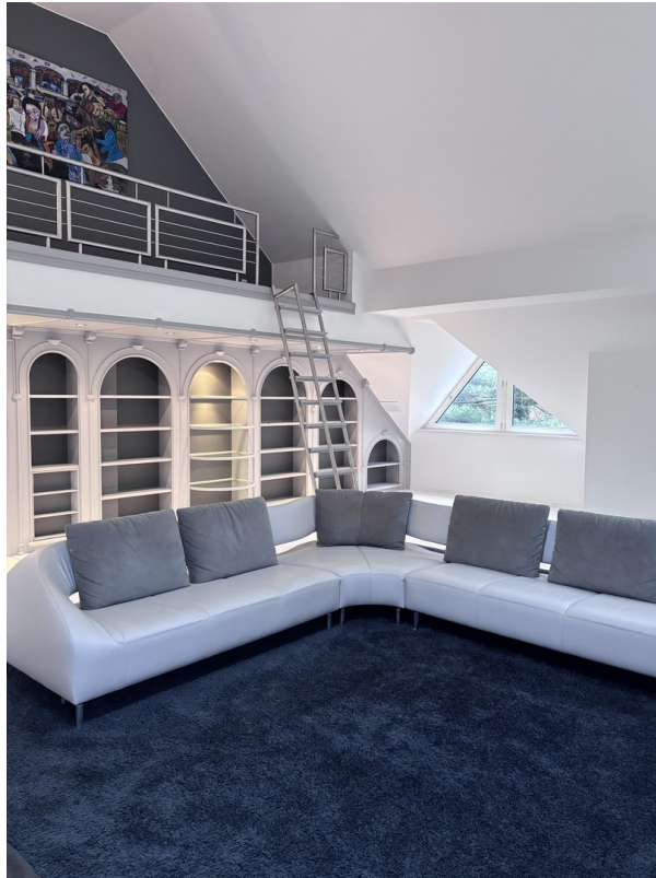
Wohnzimmer und Galerie