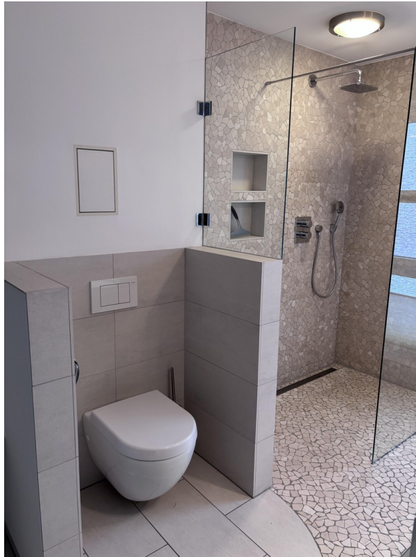
Bad - Dusche