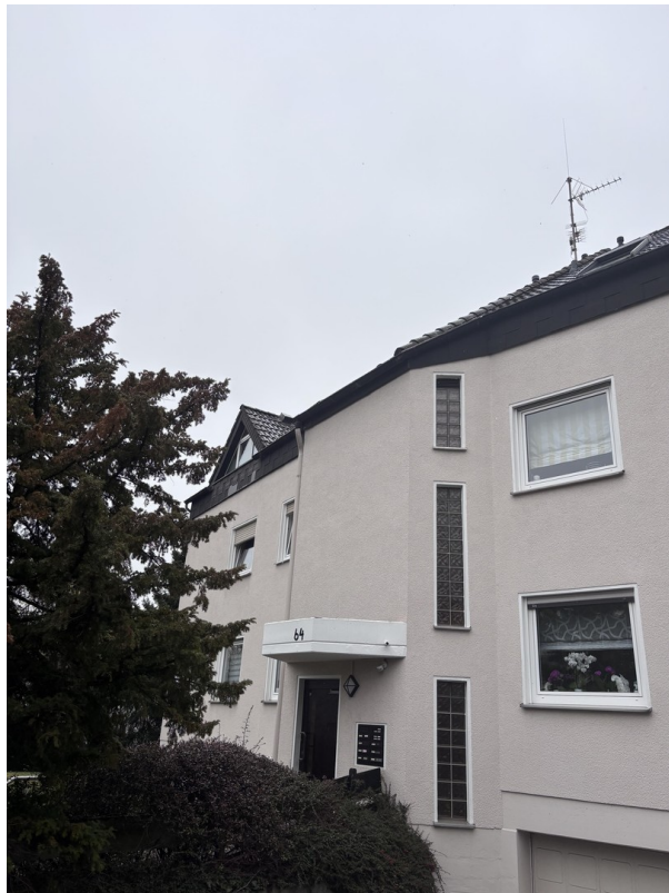
Haus - Außenansicht