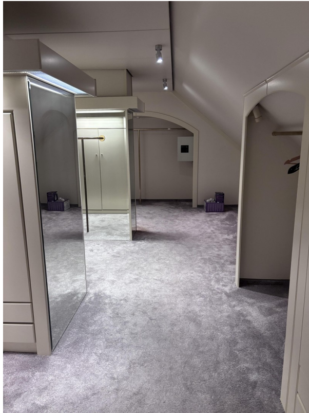
DG - Begehbarer Kleiderschrank