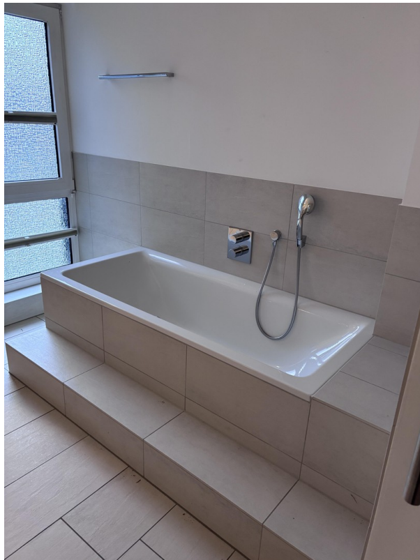
Bad - Badewanne