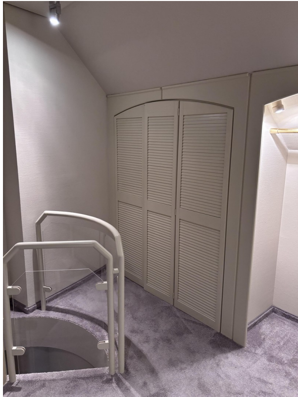
DG - Begehbarer Kleiderschrank