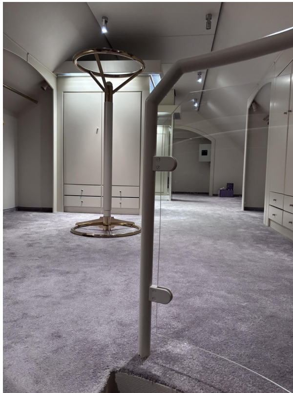
DG - Begehbarer Kleiderschrank