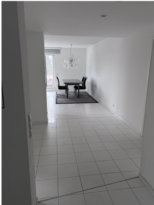
Eingang und Essbereich