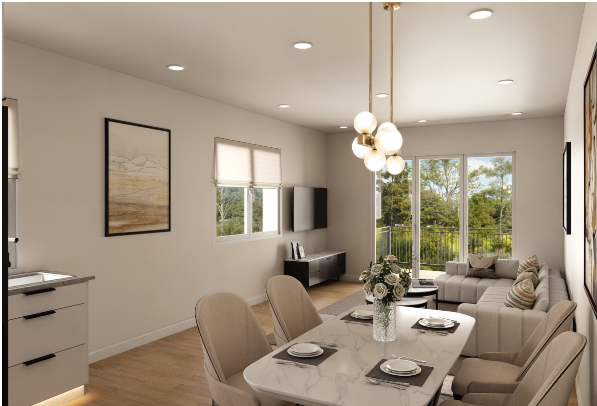
Wohn- & Essbereich (Beispiel)