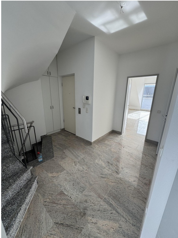
Flur, Eingang Aufzug, Treppe