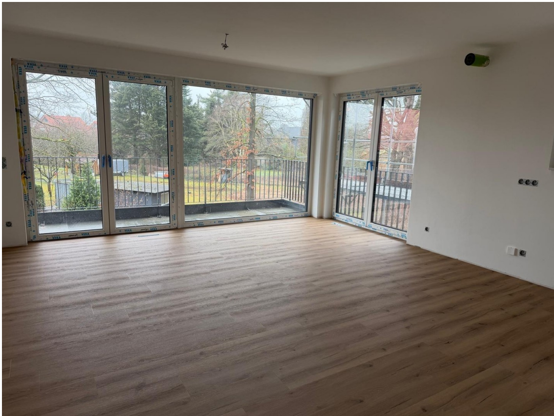
Wohnraum (aktueller Baustand)