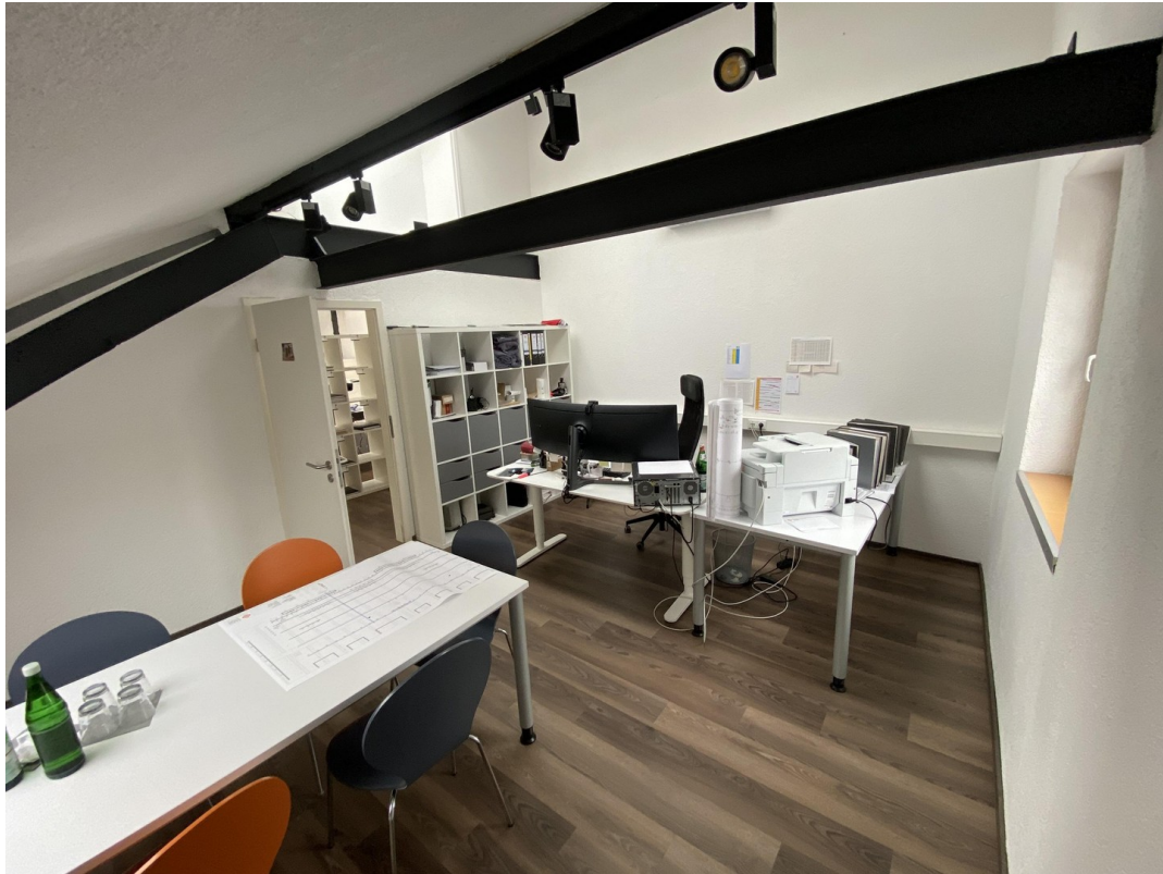
Büro 4 Dachgeschoß