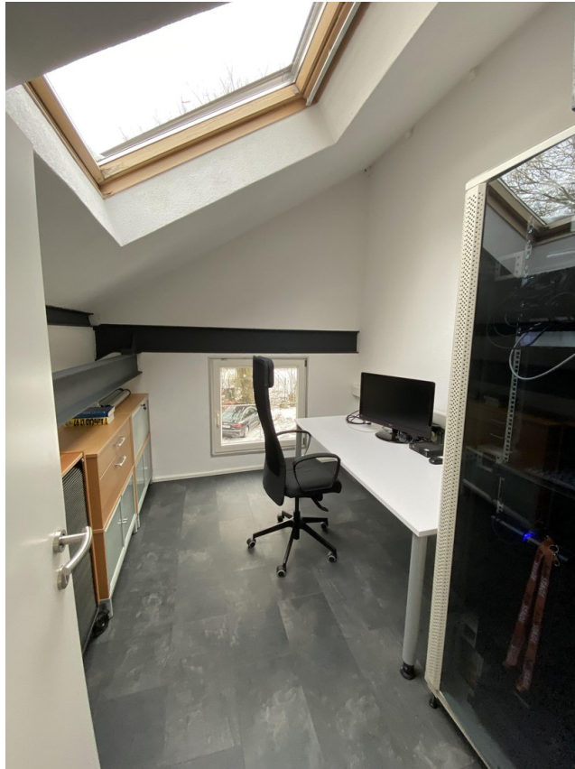
Büro 2 Dachgeschoß