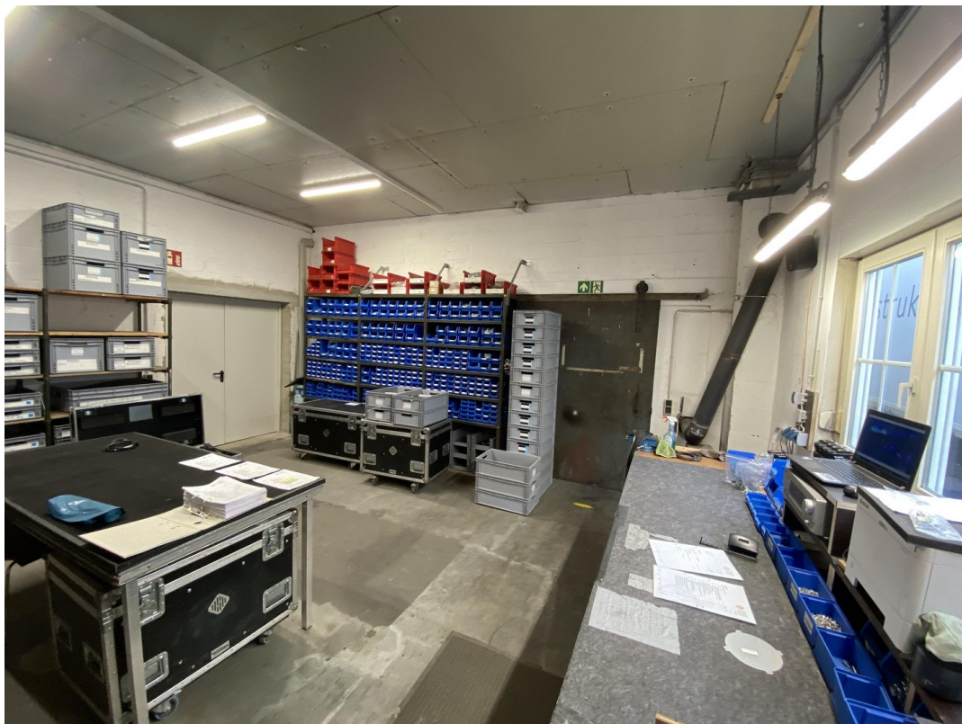
Werkstadt 2 35qm