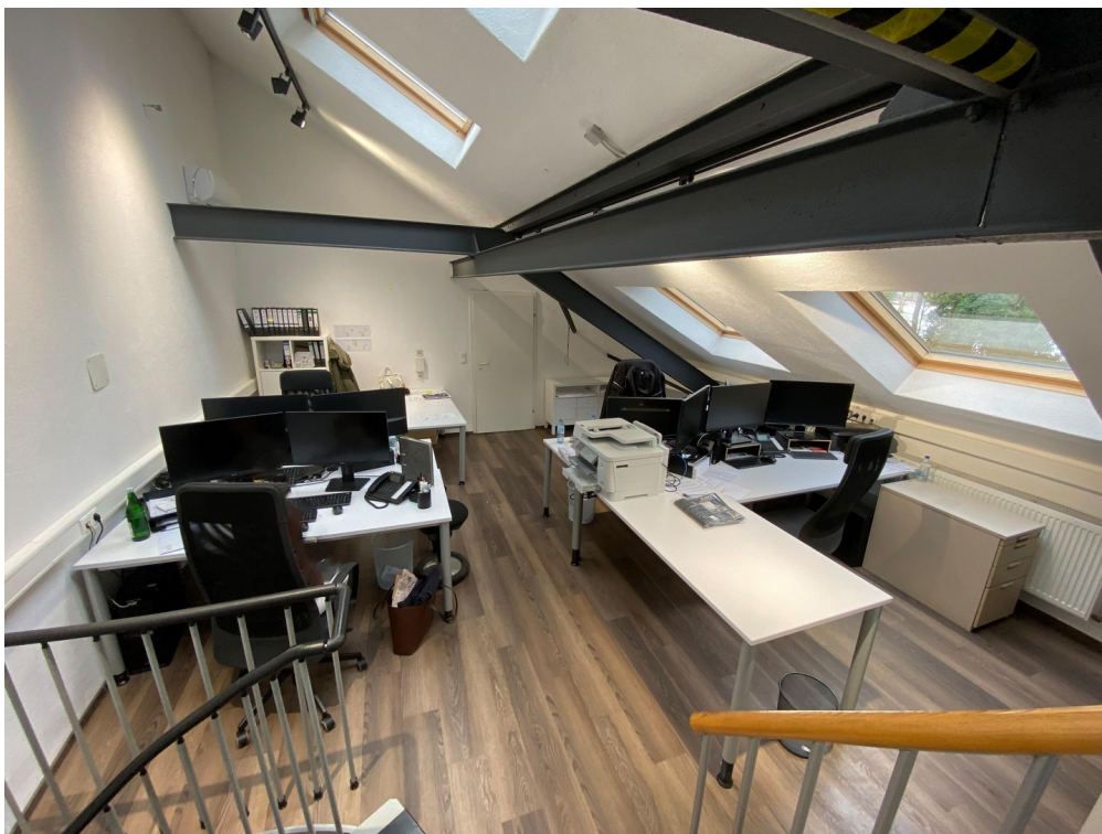
Büro 1 Dachgeschoß