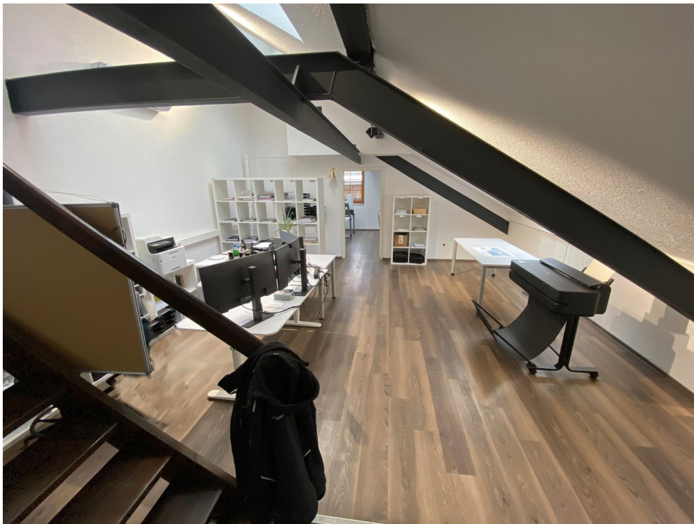
Büro 3 Dachgeschoß