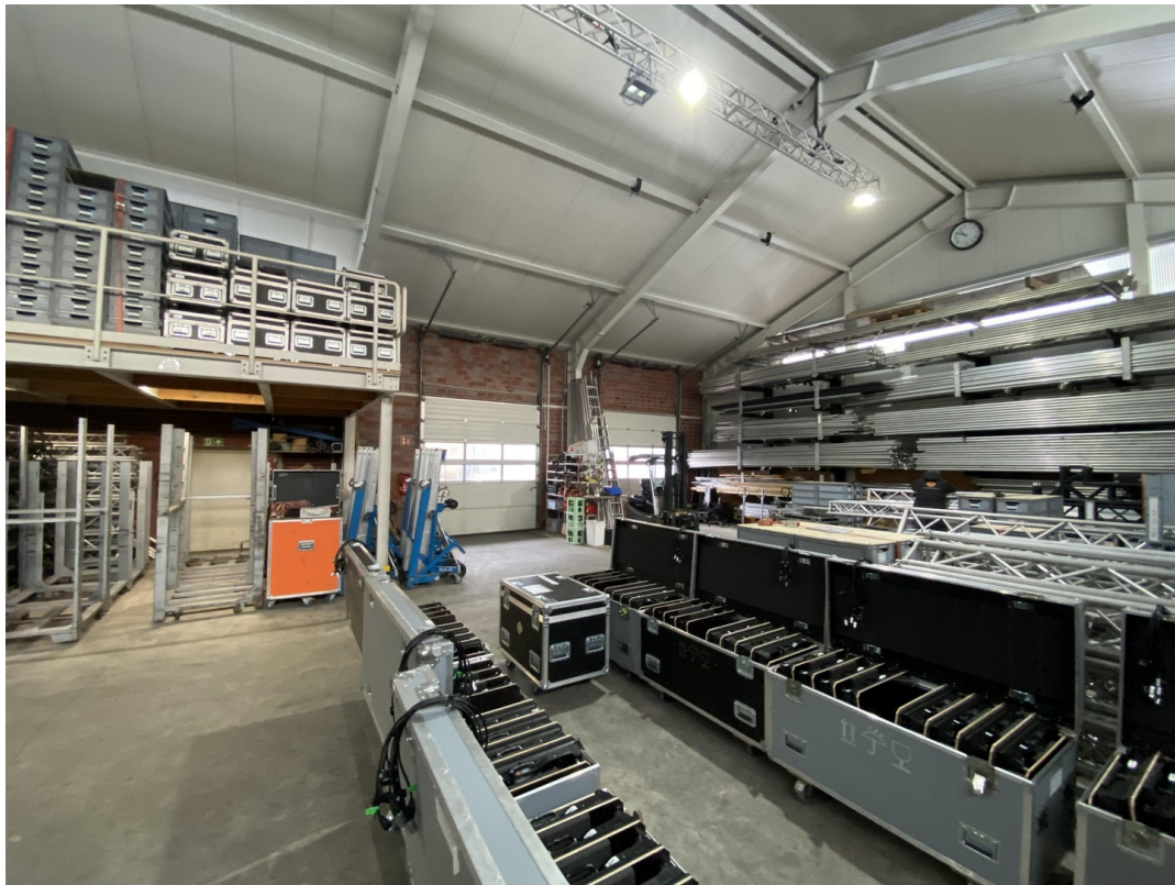
Ansicht- Lade Tore