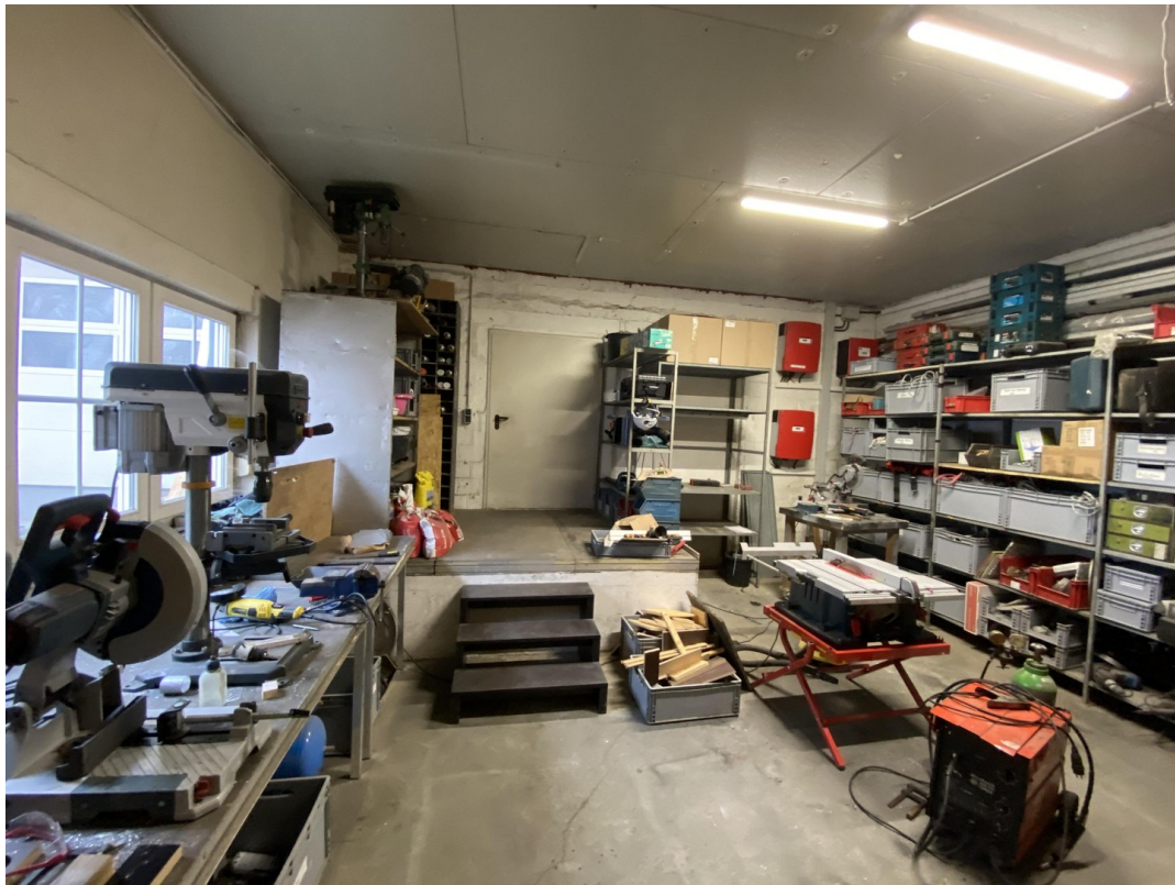
Werkstadt 1 35qm