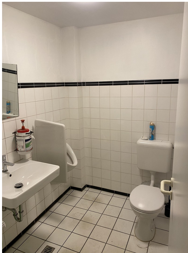
Toilette im Lager