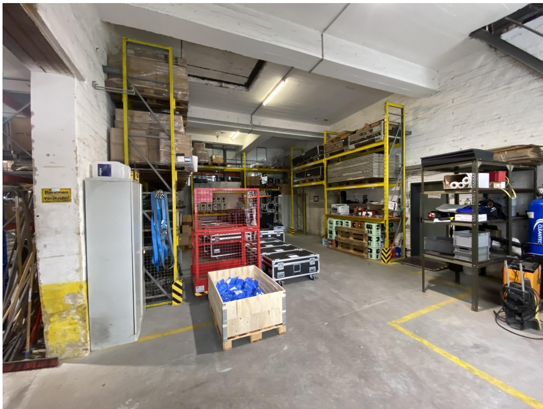
Lager 1- Eingangs. 88qm