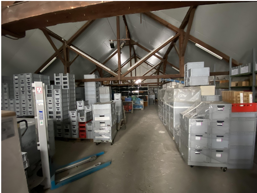
Lagerraum Dachgeschoß 230qm