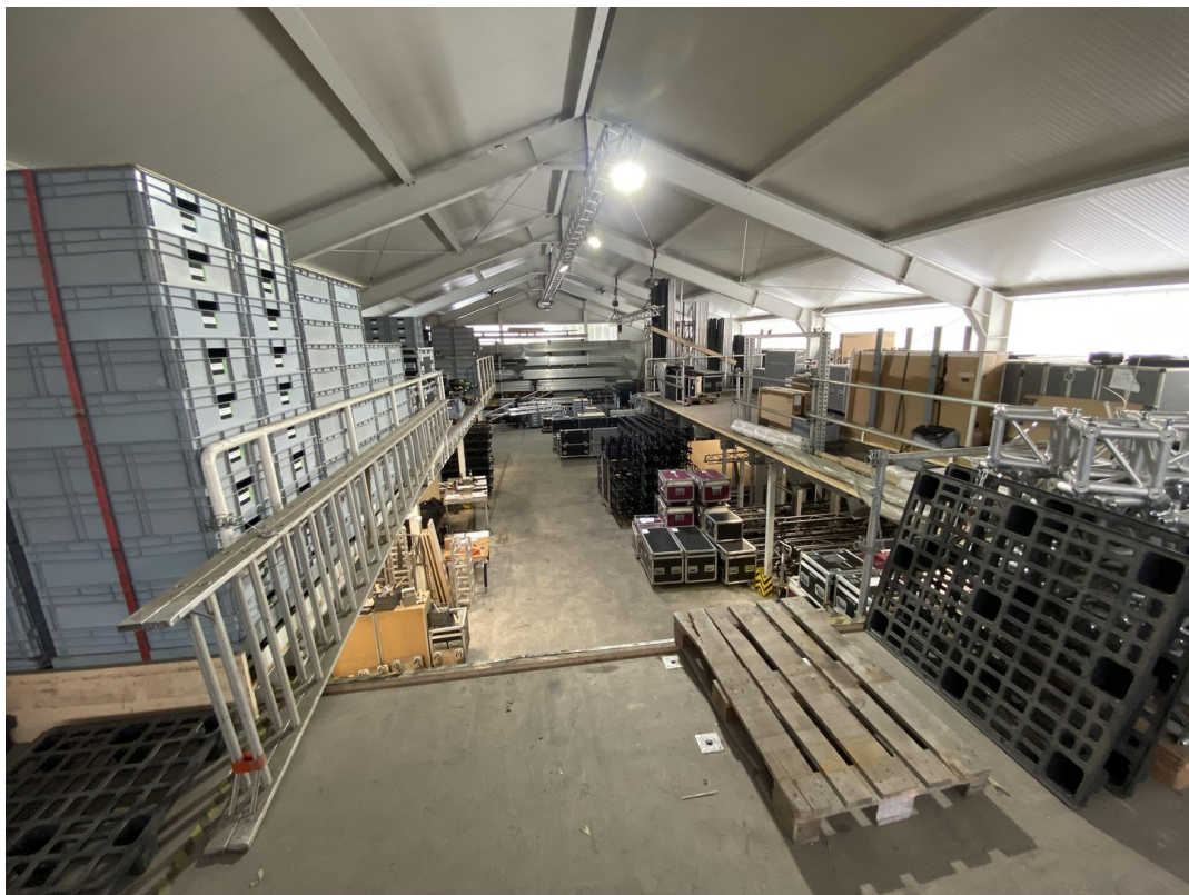
Lager 5 491qm