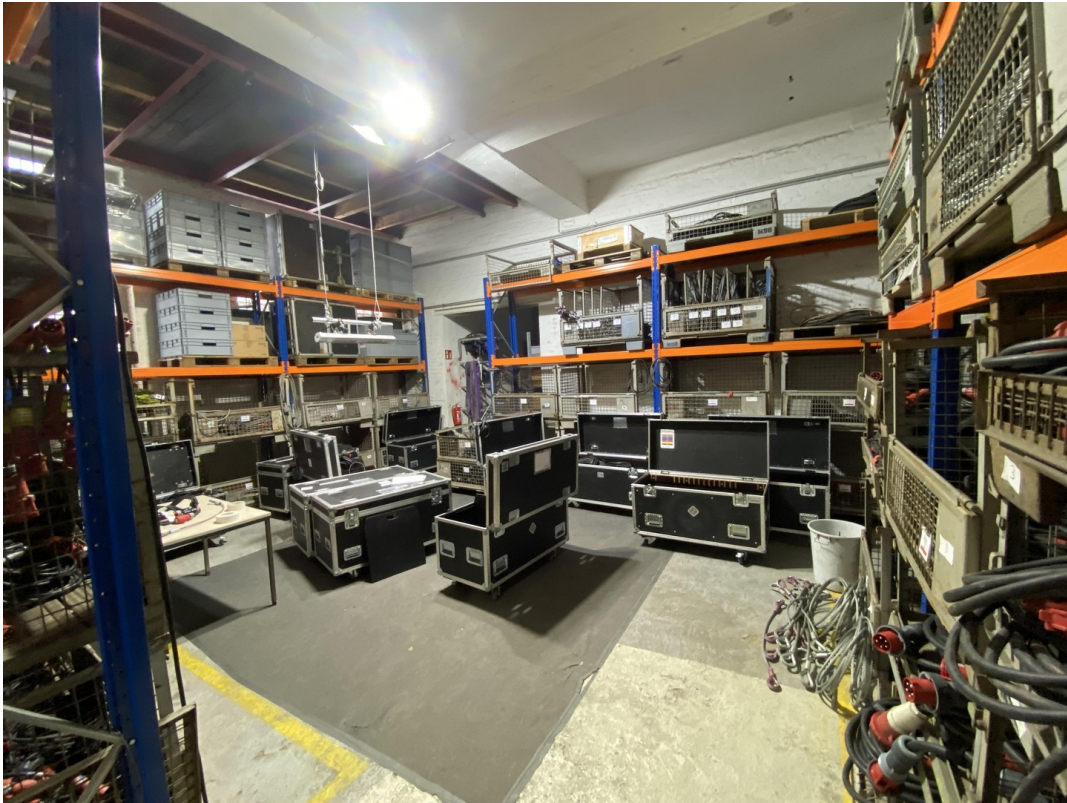
Lager 2 62qm