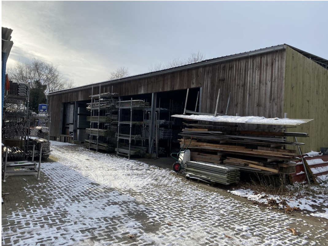
überdachte Freifläche 240qm