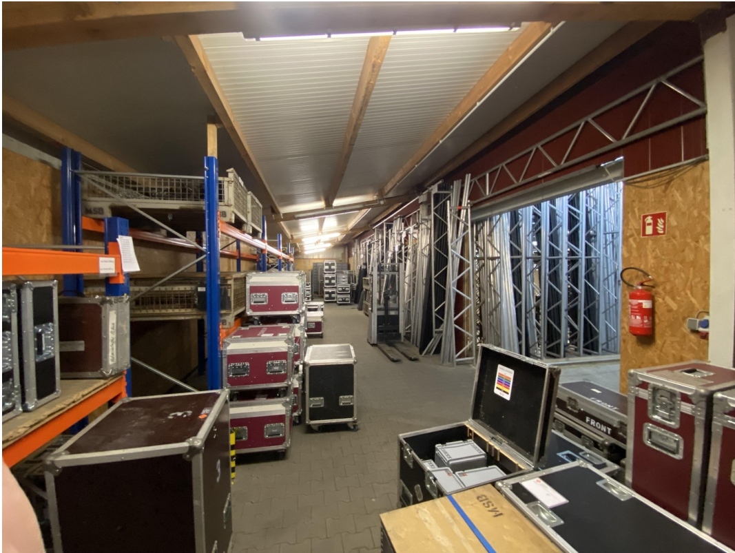
Lager 6 157qm