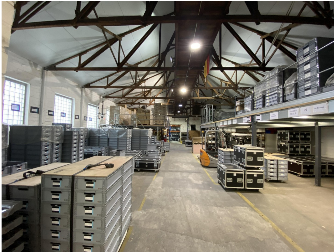
Lager 4 310qm