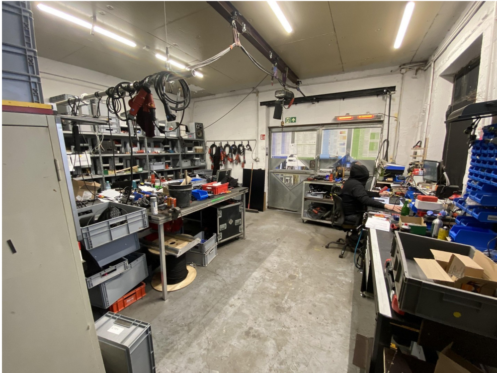
Werkstadt 3 37qm