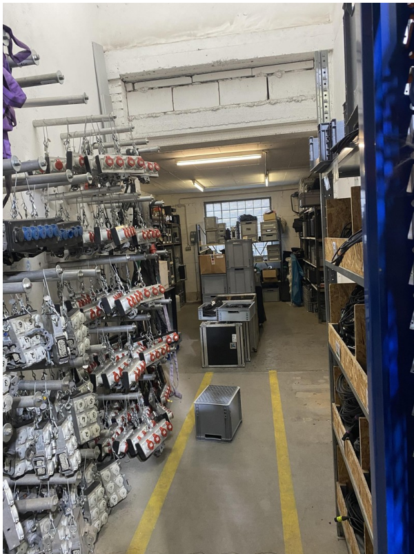
Lager 3 24qm