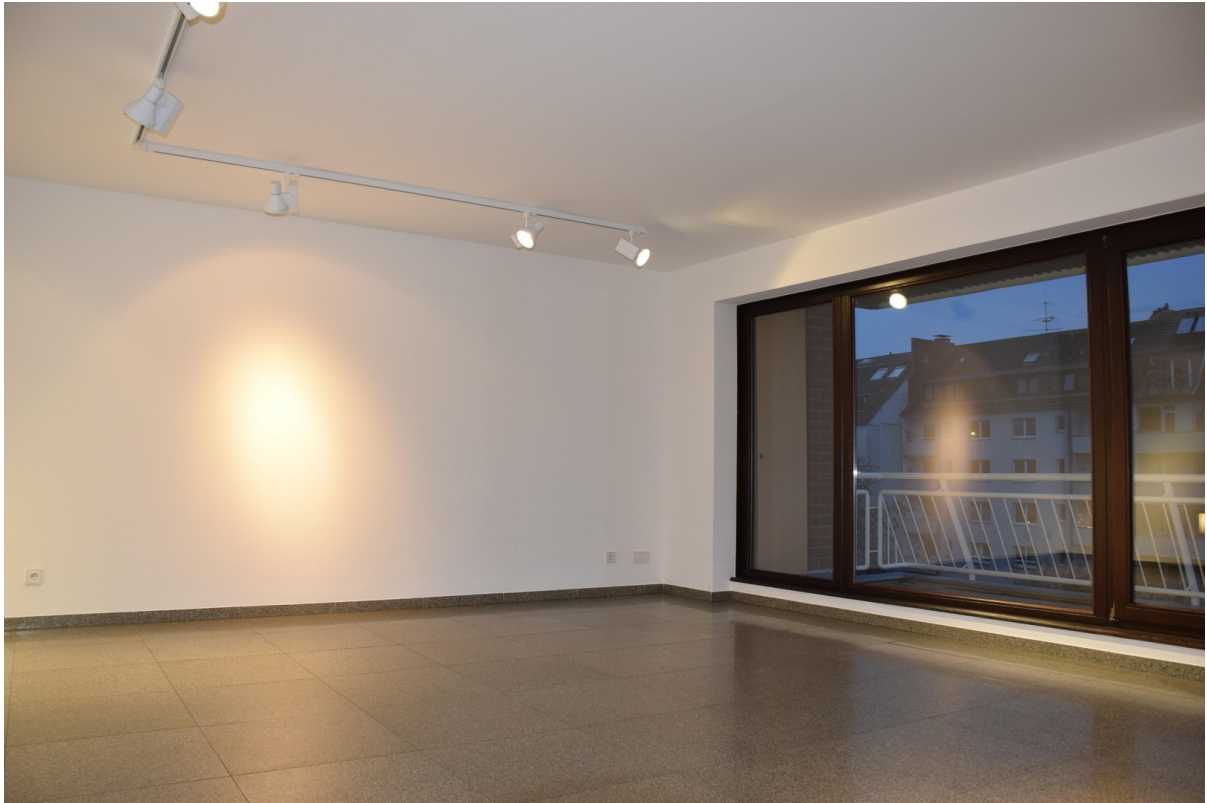
Raum 3 groß