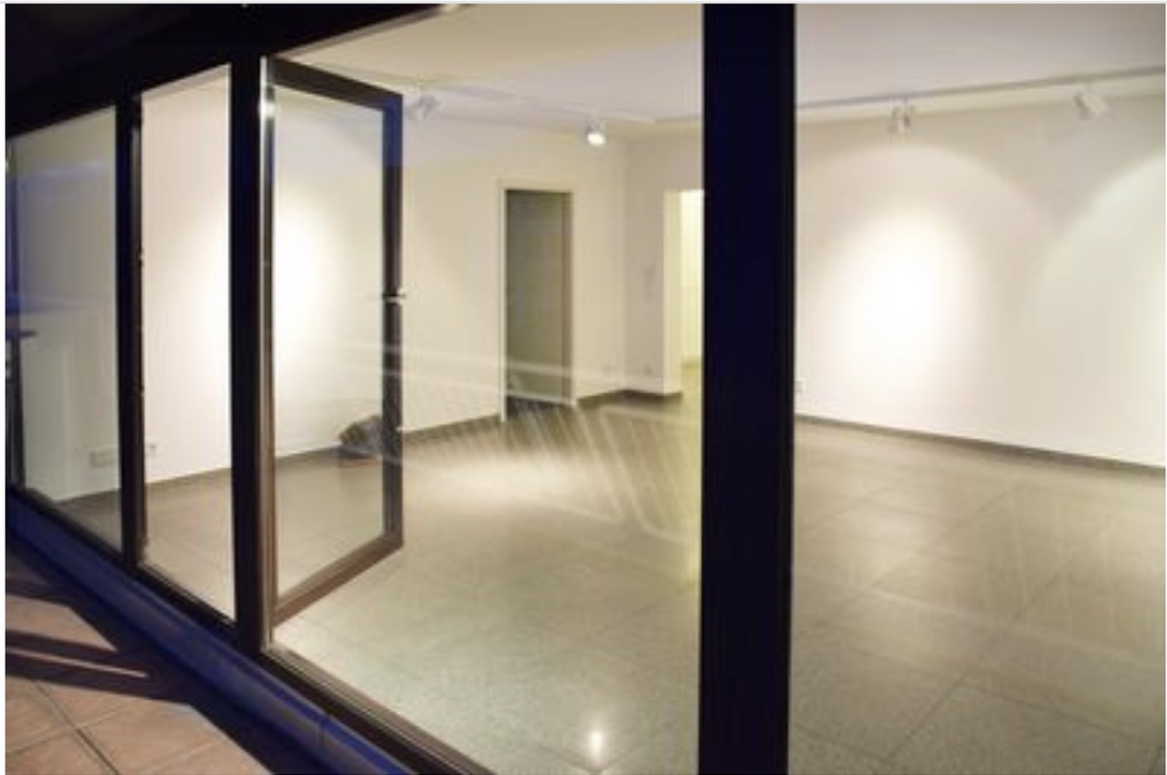
Raum 3 Blick von Balkon