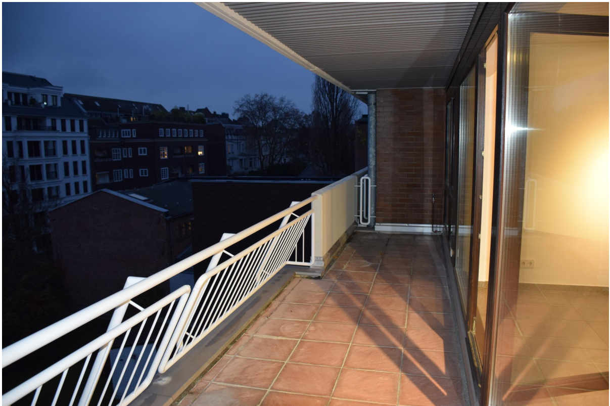
Balkon mit Gartenblick