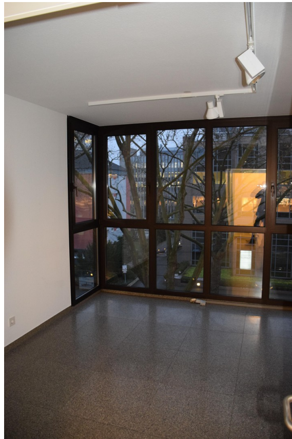
Raum 1, klein