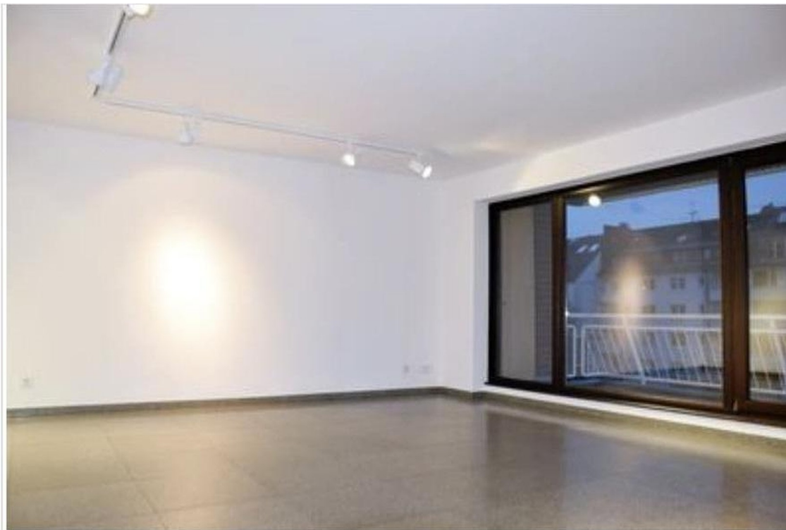
Raum 3 groß