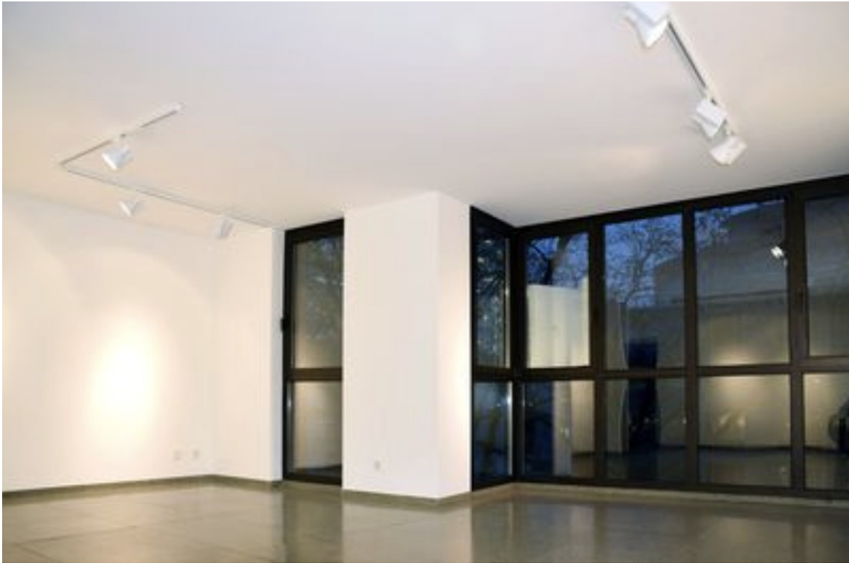
Raum 2 groß