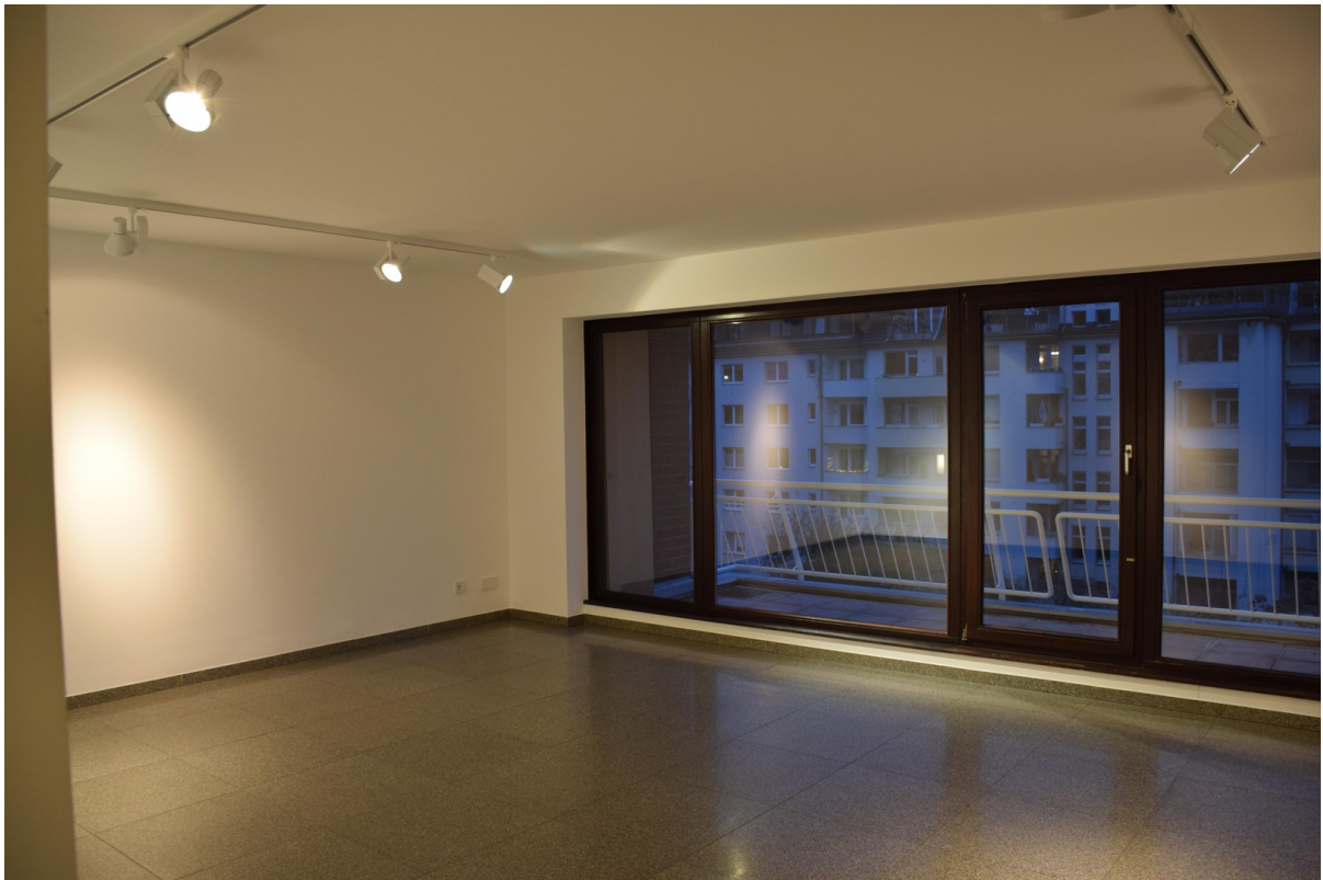
Raum 3 groß