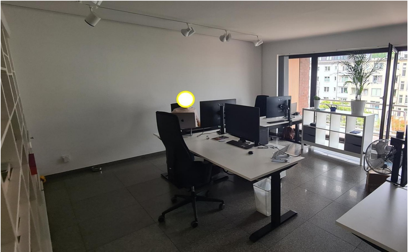
Raum 3 als Büroraum