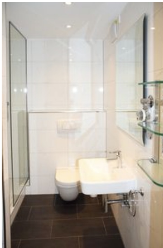
Bad 1 klein