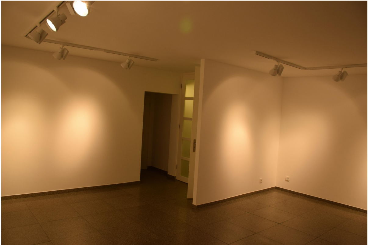
Raum 2 Raumsicht