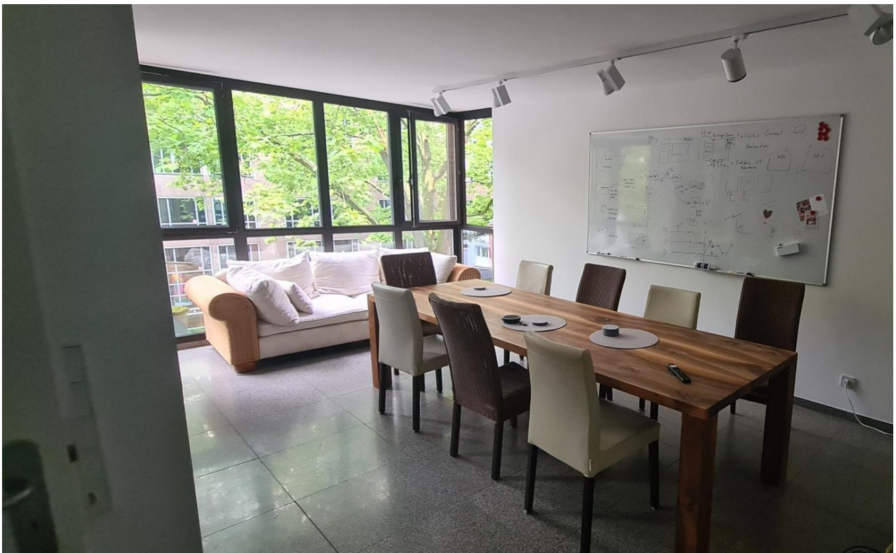
Raum 2 // Meetingpoint