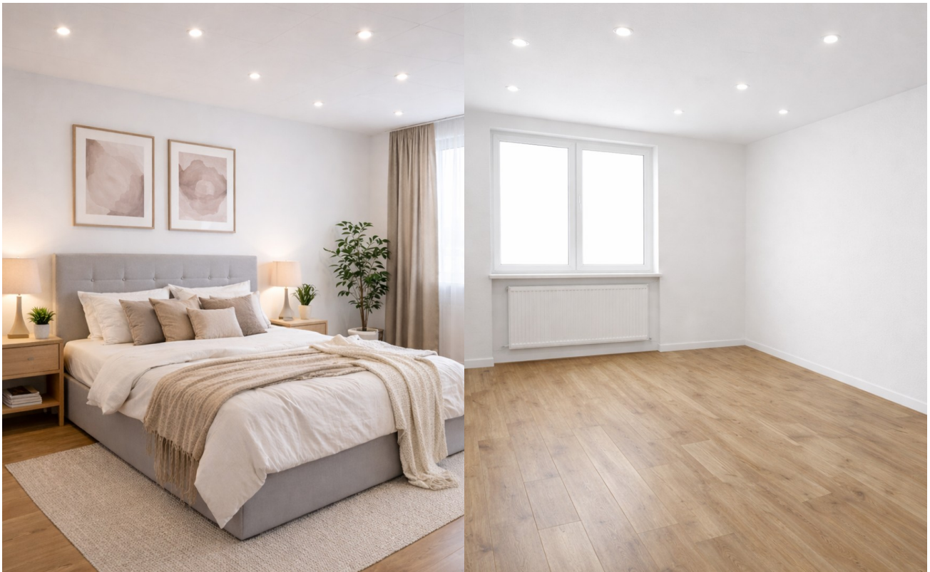
Schlafbeispiel - KI generiert