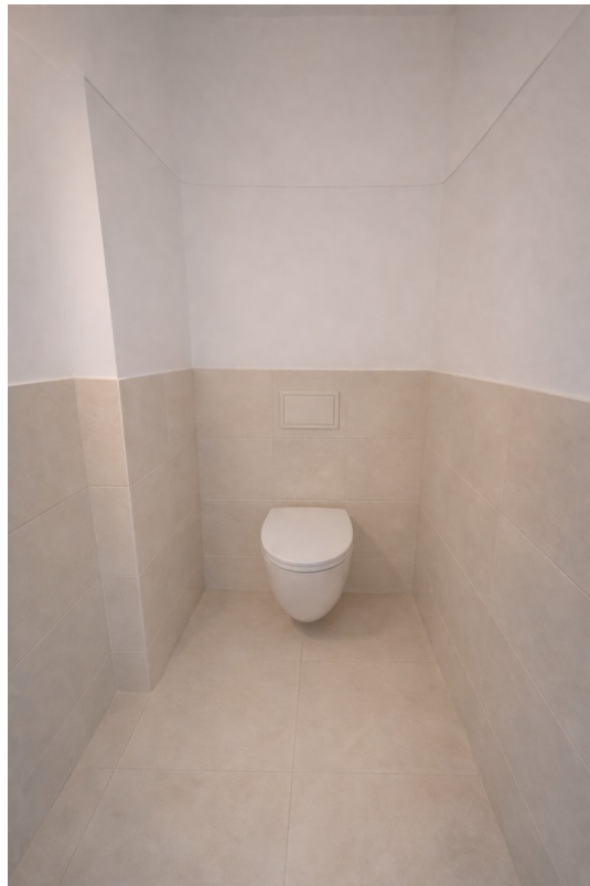
Bad mit Toilette