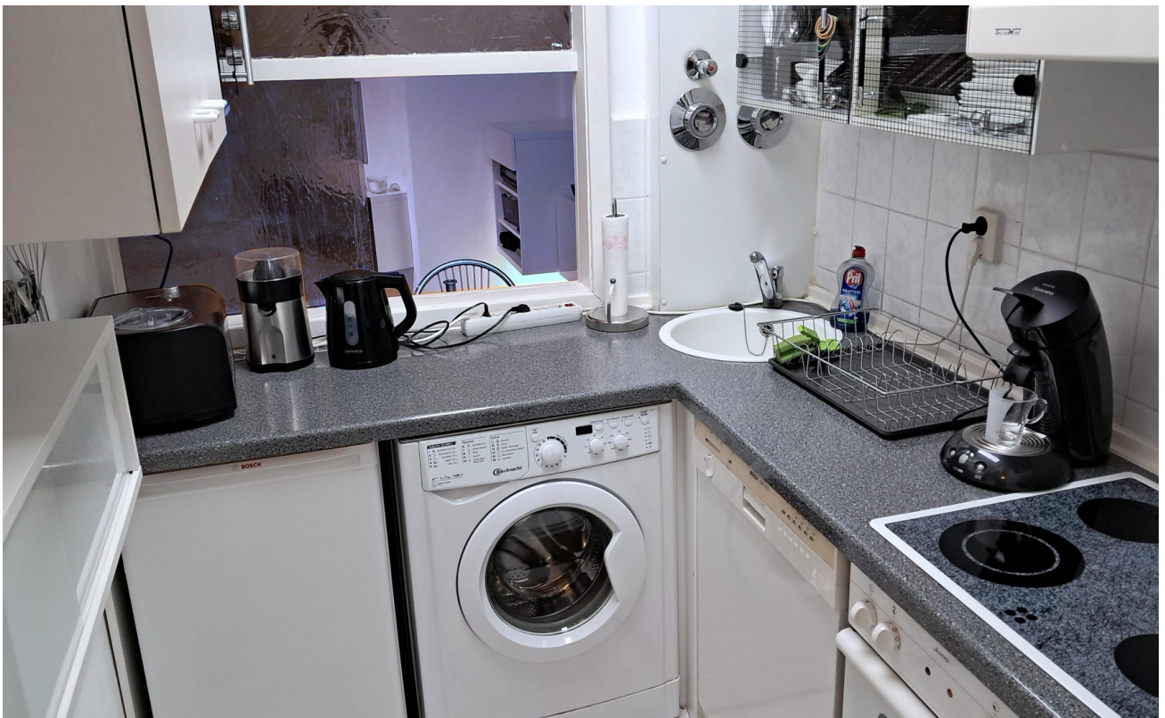
Küche mit Durchreiche