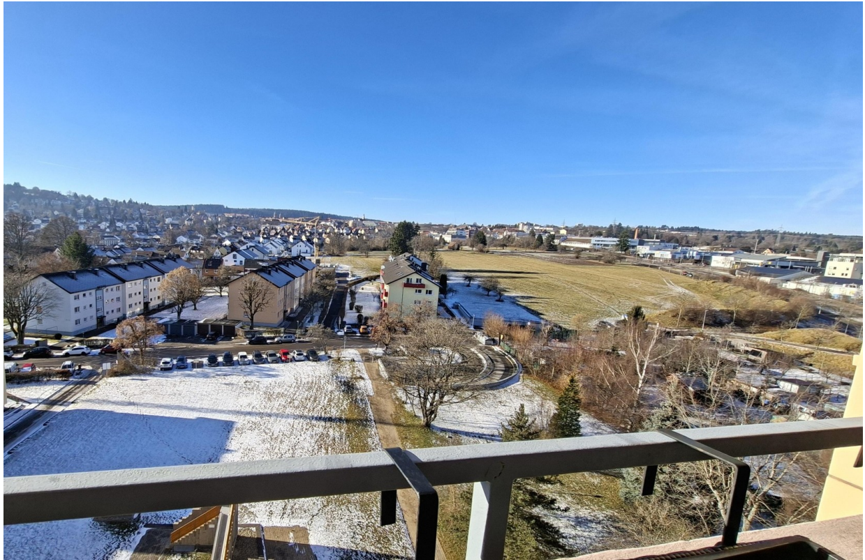
Panoramablick über Freudenstad