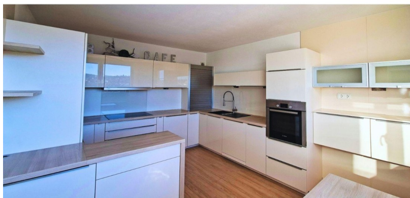
Küche mit Panoramablick