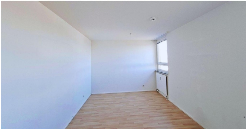
Kinderzimmer / Gästezimmer