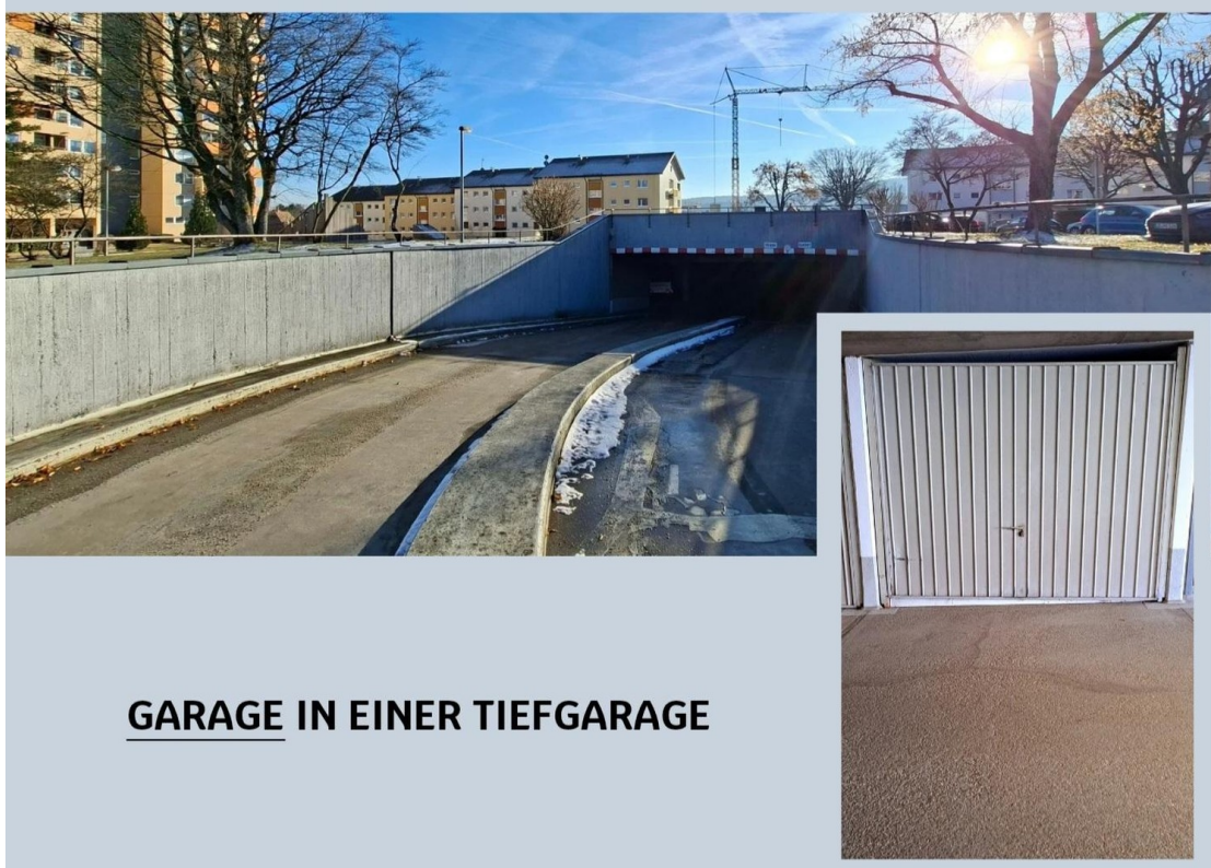
GARAGE IN EINER TIEFGARAGE