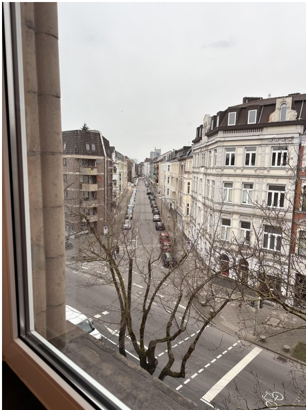
Blick nach draussen