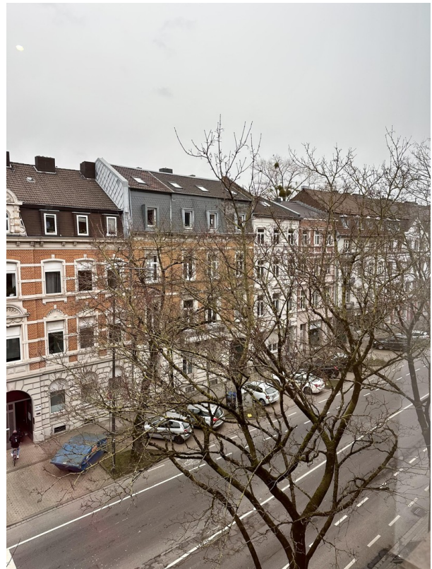
Blick nach draussen