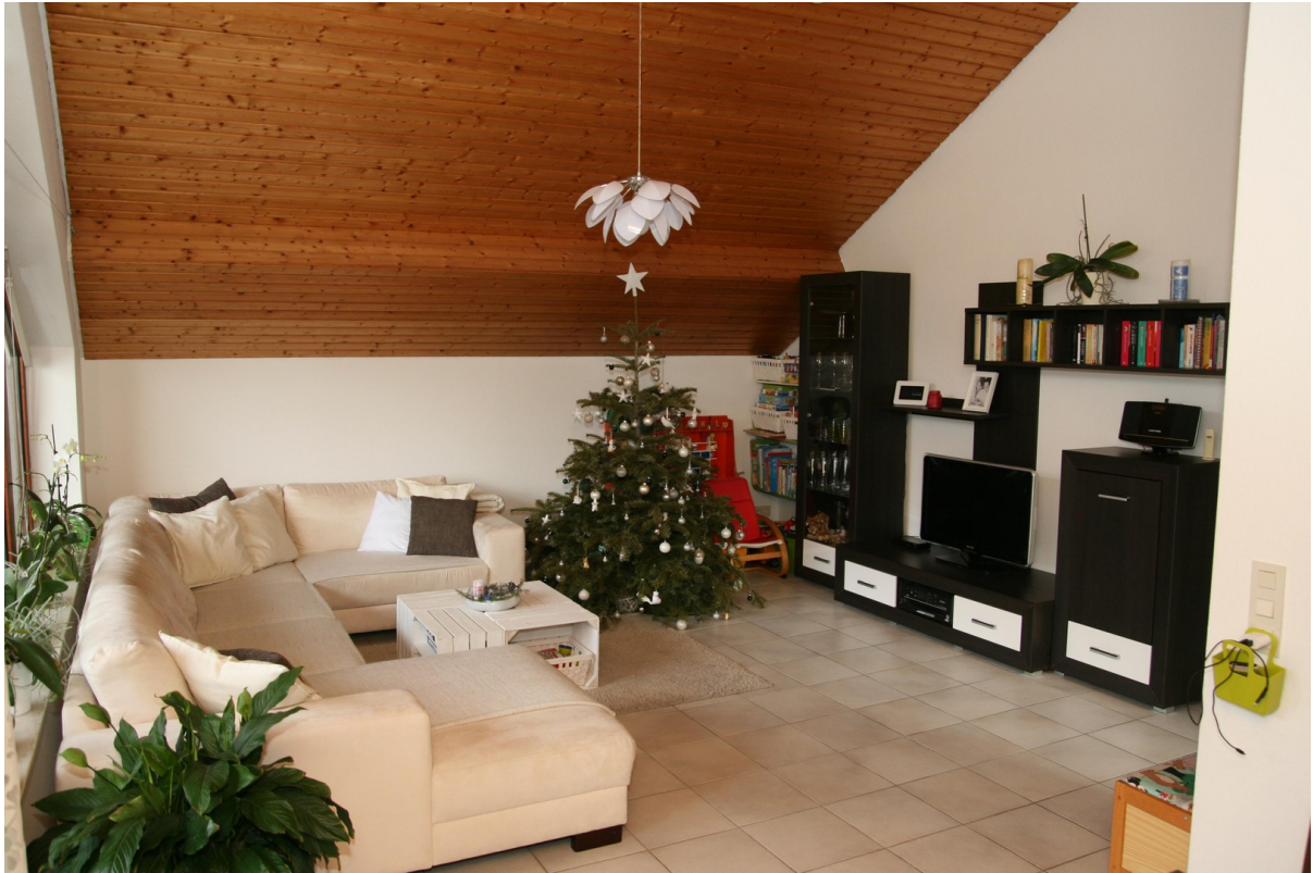
Wohnzimmer (Beispiel 2)