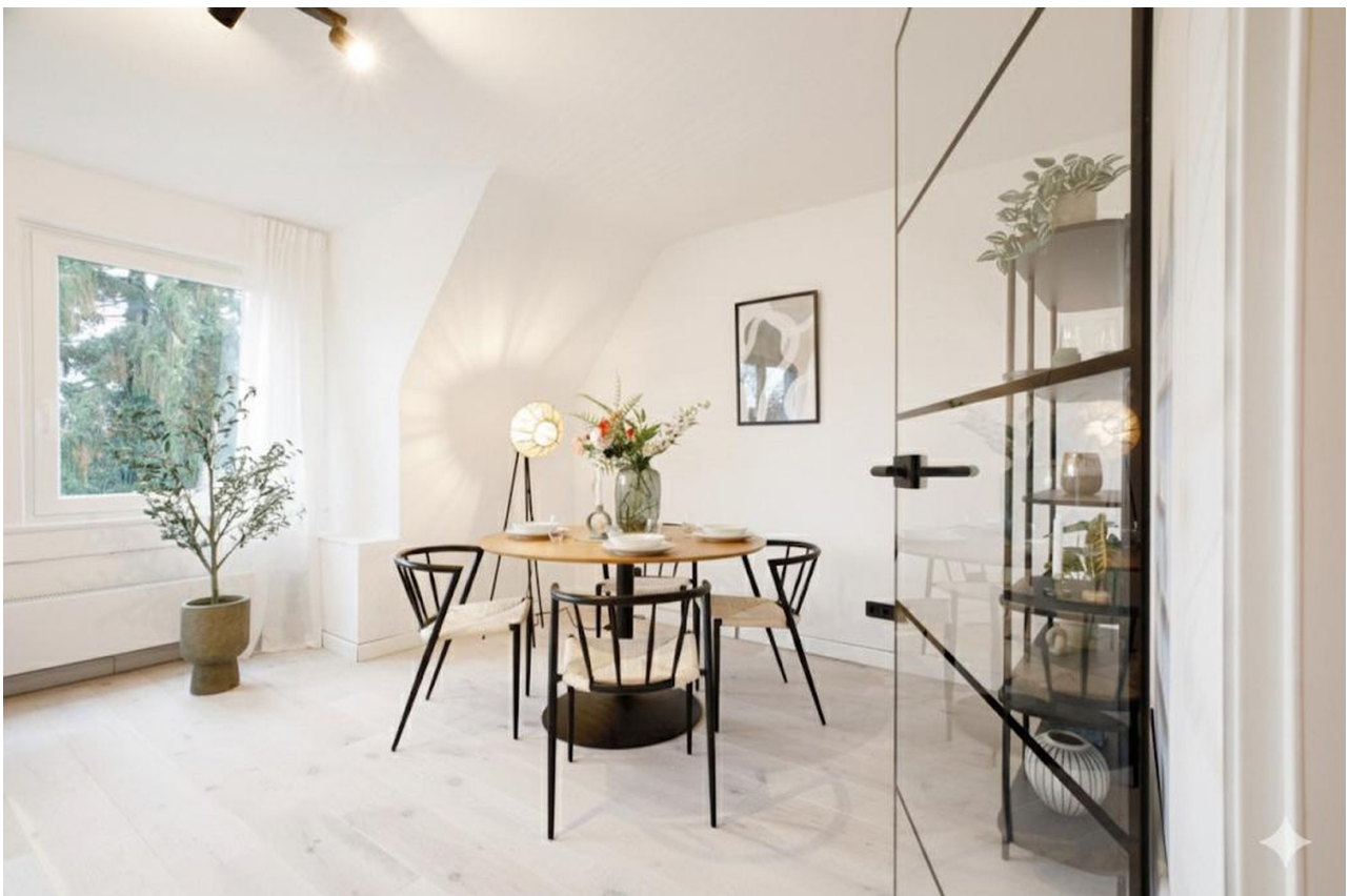
Design-Glastür & Essbereich