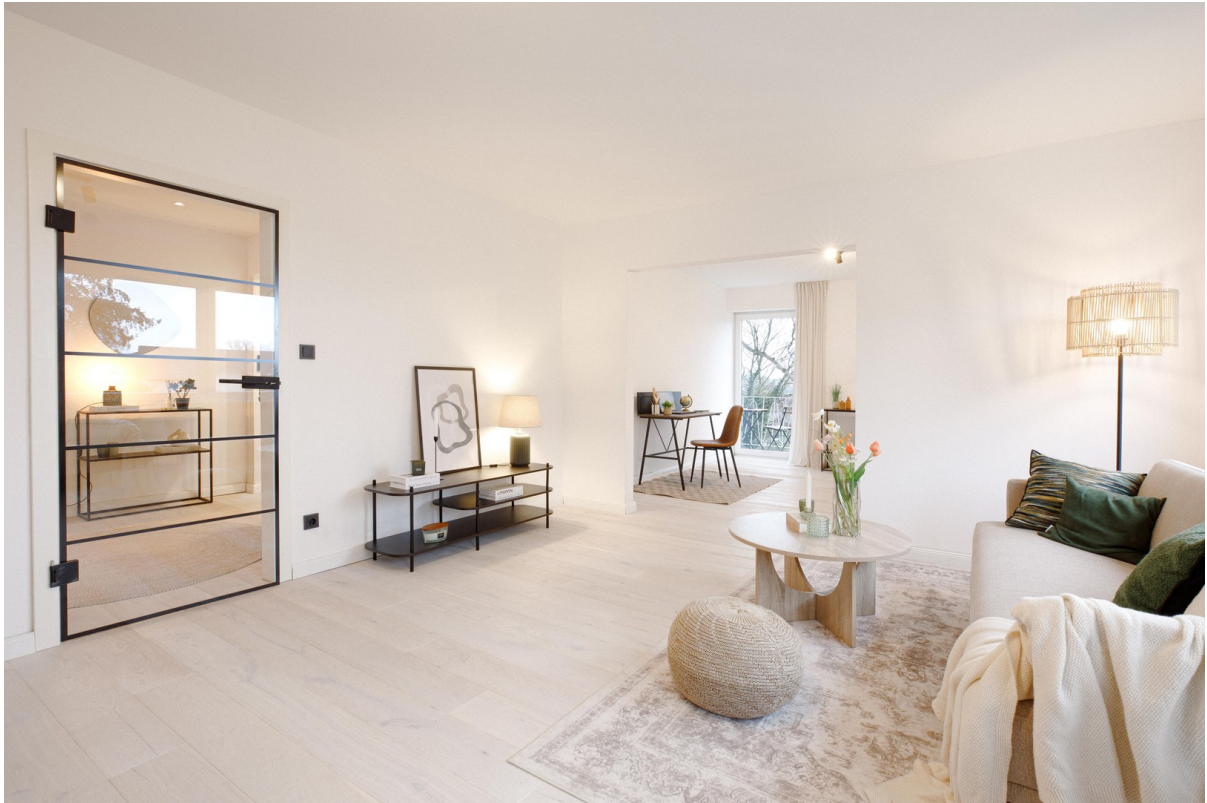
Helles Parkett & viel Licht