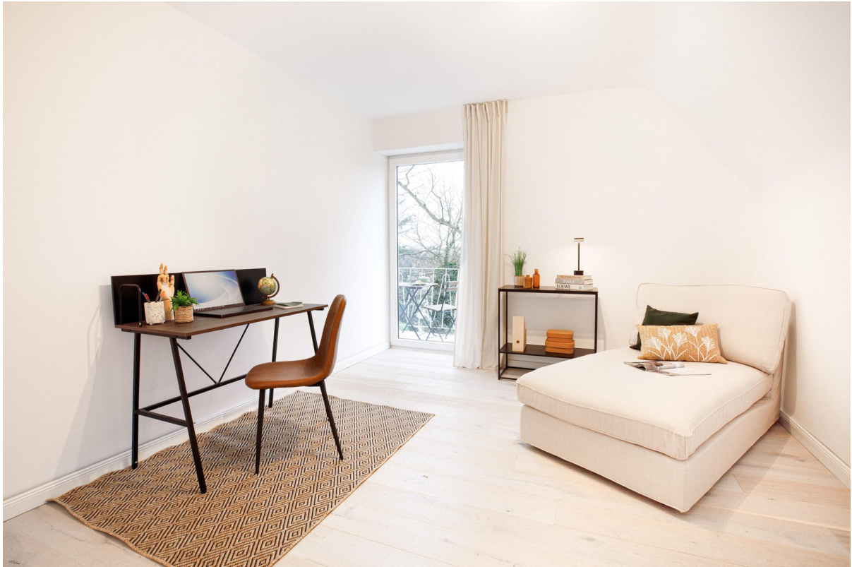
Home-Office / 3. Zimmer