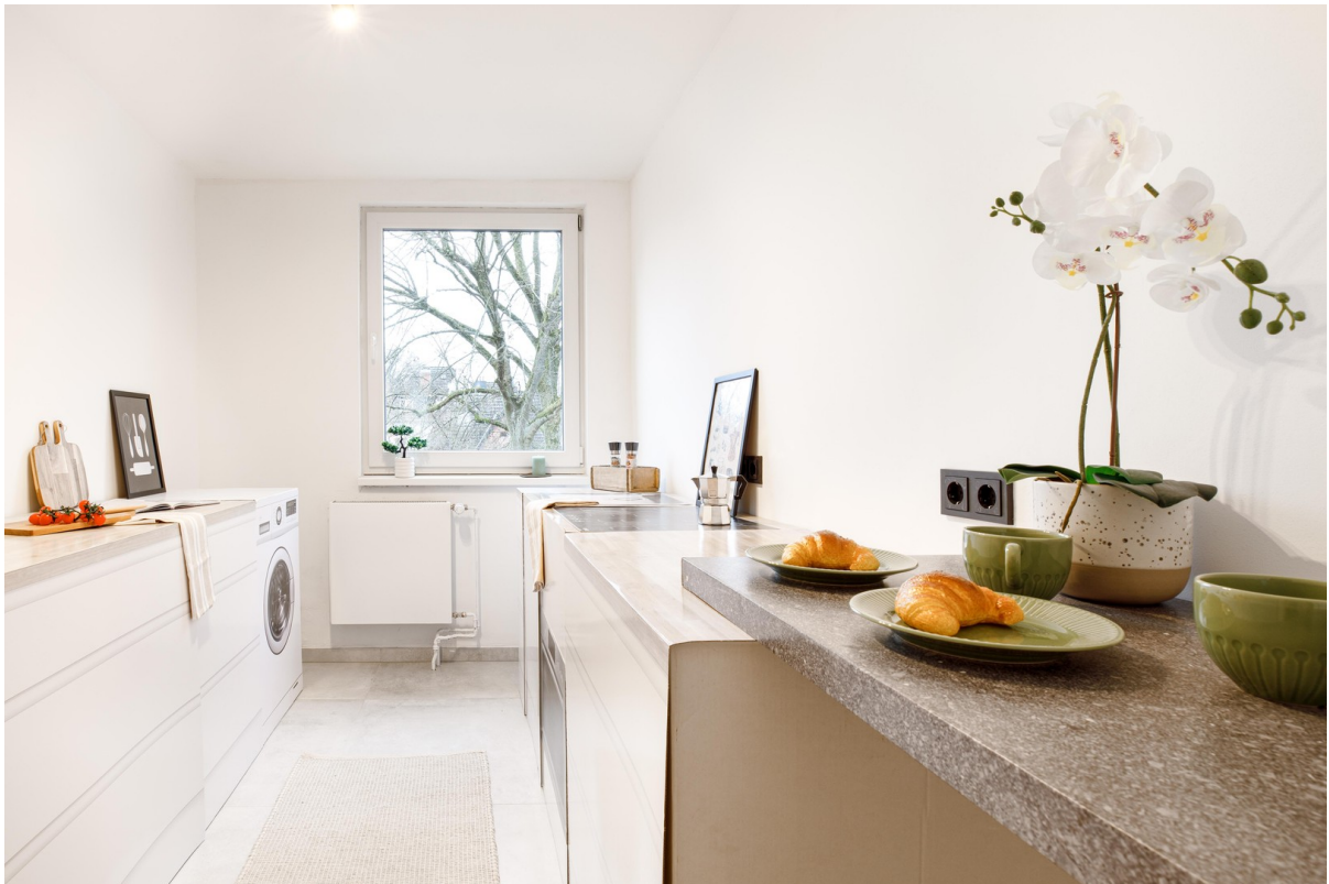
Küche mit XL-Designfliesen