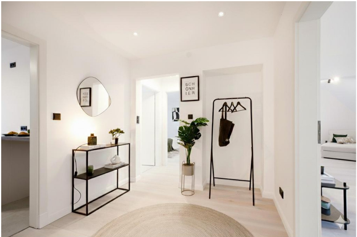
Einladender, moderner Entree