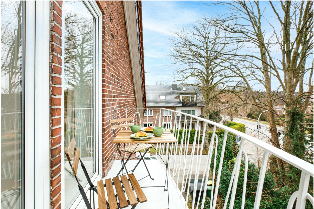
Sonniger Balkon im Grünen