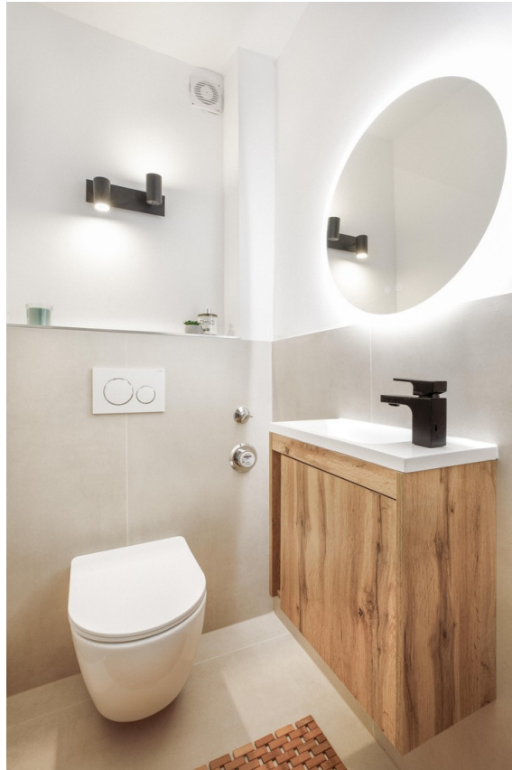
Neues Gäste-Wc mit Stil