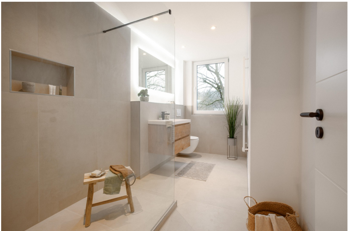
Walk-In Dusche & Design Bad