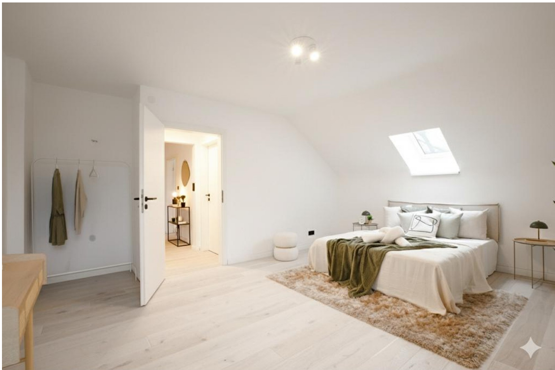
Ruheoase mit neuem Design