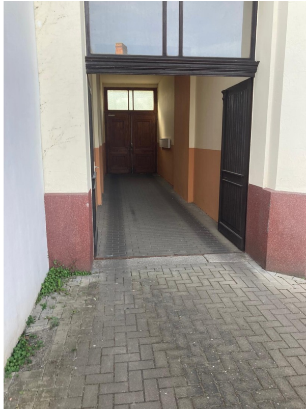
Blick vom Hof zur Einfahrt