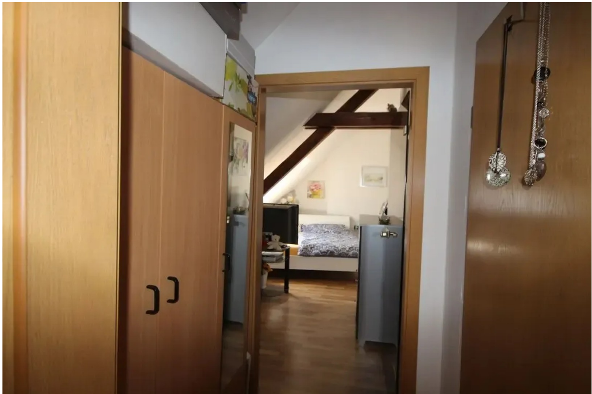
zweiter Eingang oben (rechts)