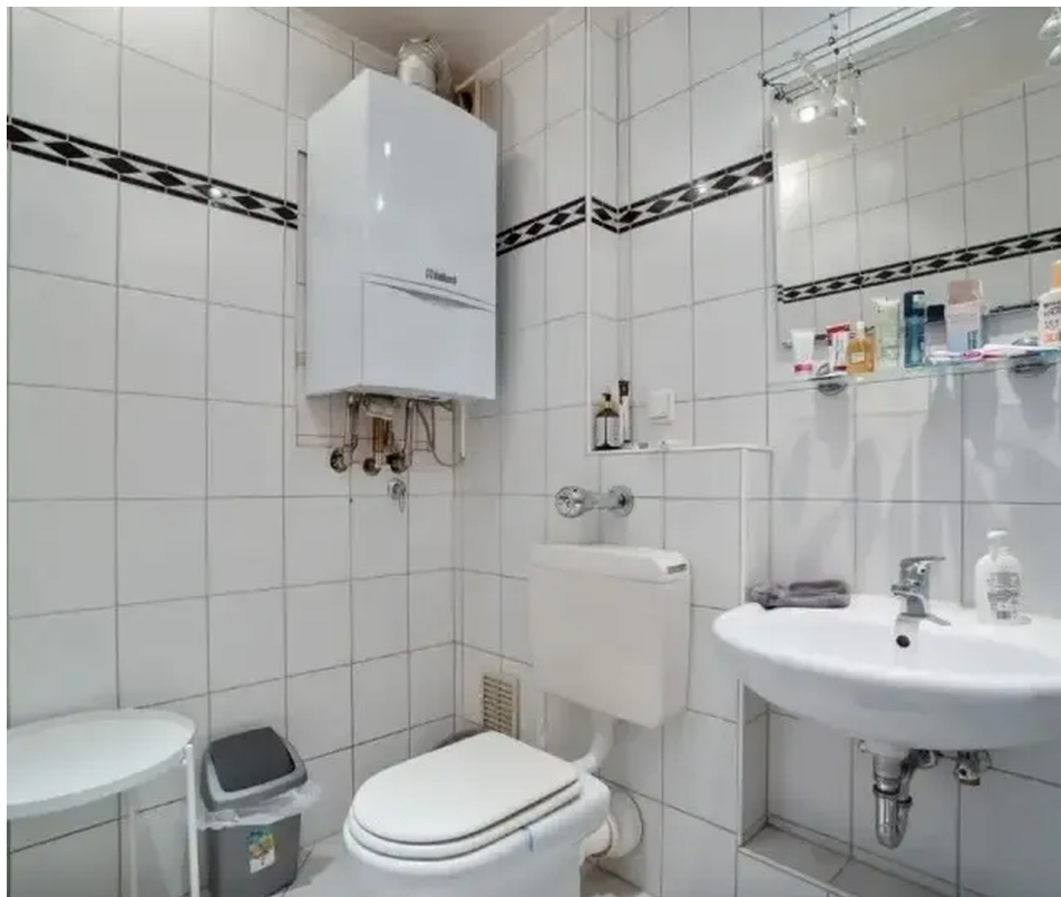
Gäste-WC und Etagenheizung