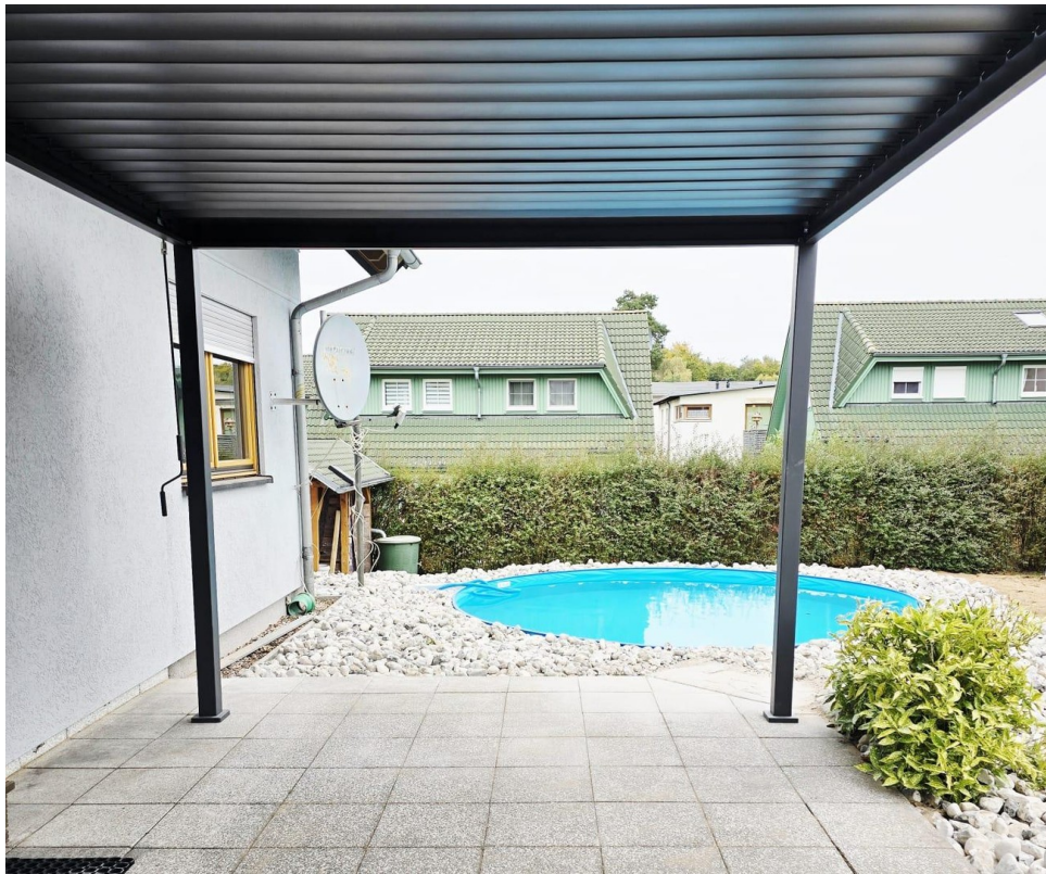
Terrasse mit Pool