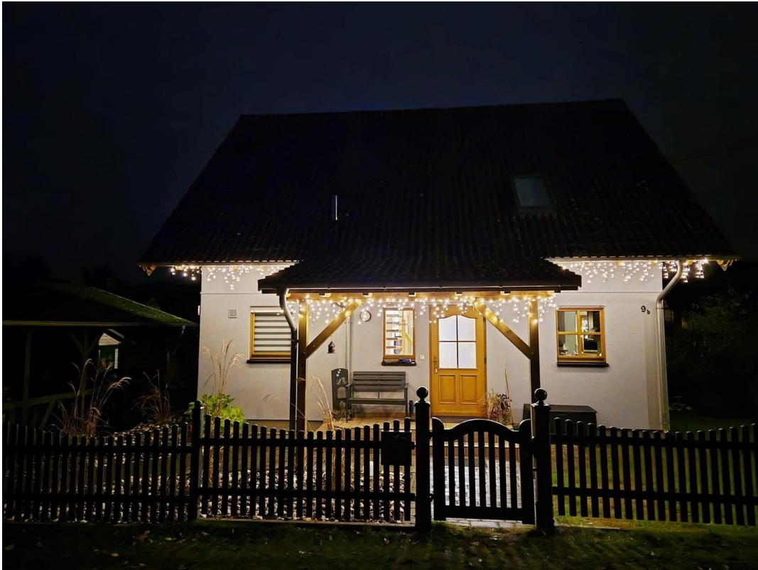
Vorderansicht bei Nacht