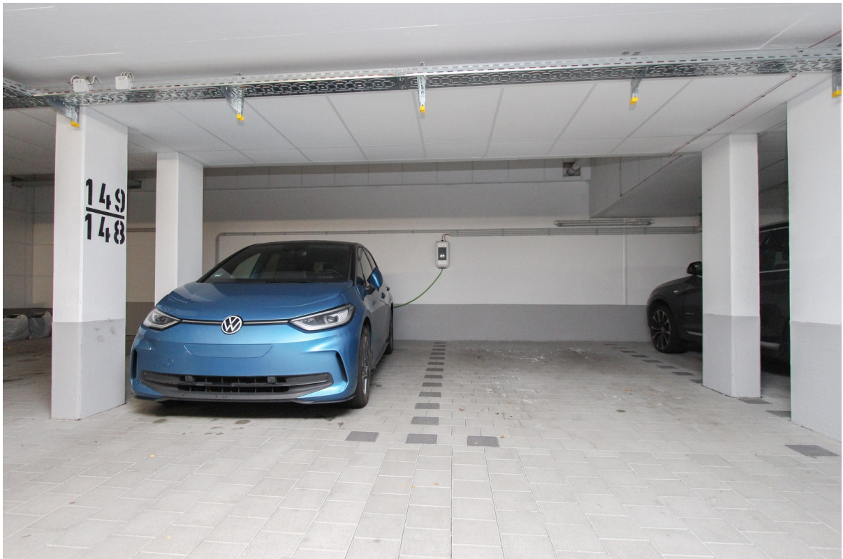
TG-Stellplätze mit Wallbox