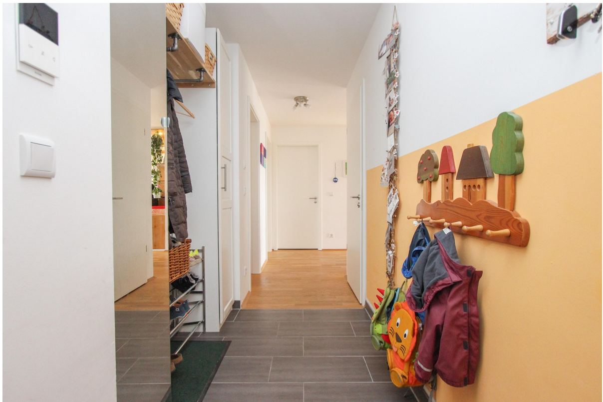
Gefliester Flur mit Garderobe