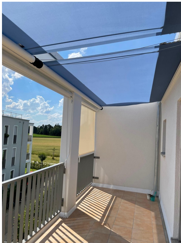
Balkon im Sommer