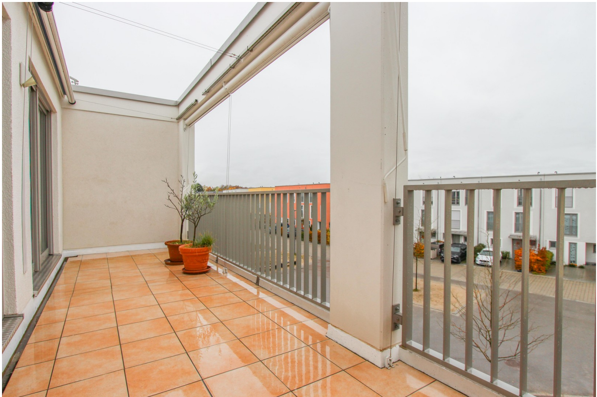
Balkon im Winter