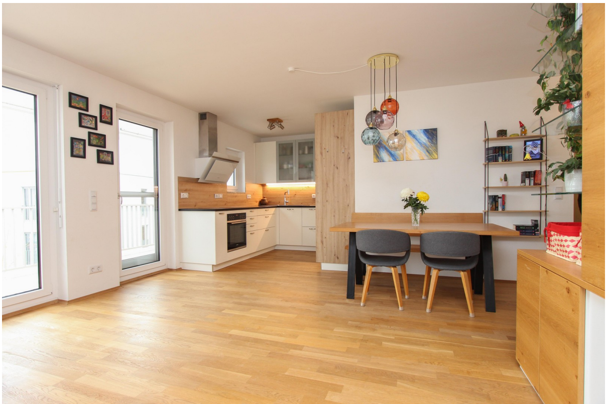
Essbereich mit offener Küche