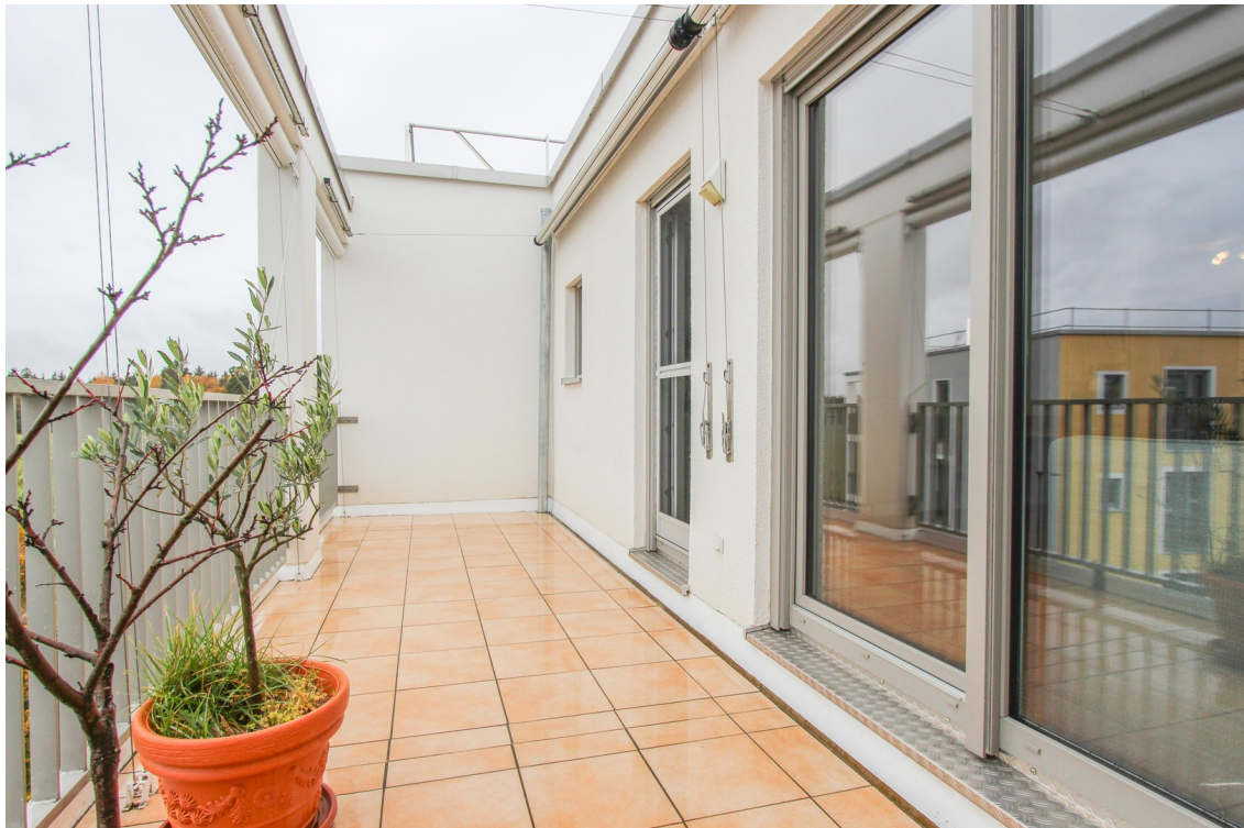
Balkon im Winter