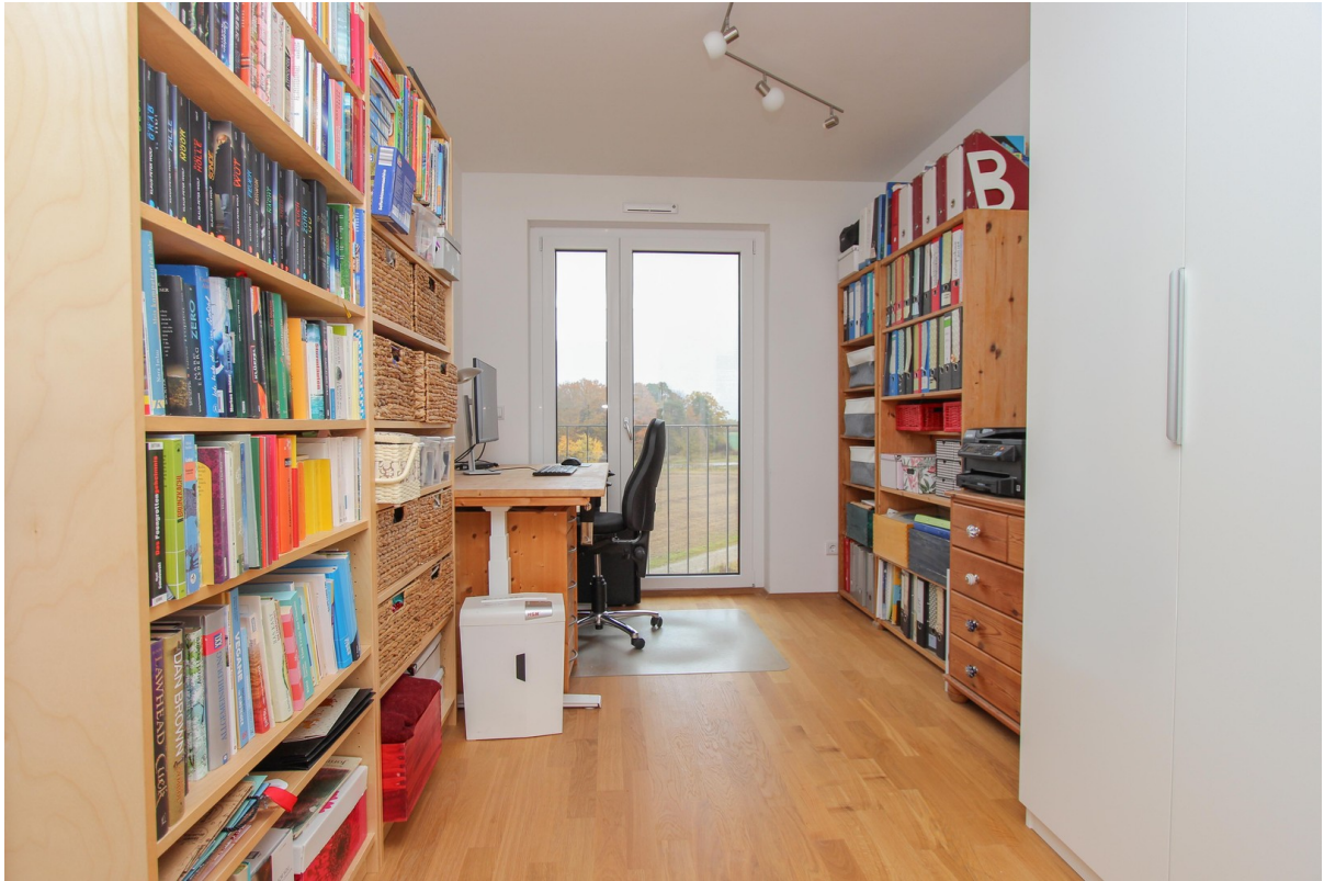
Arbeitszimmer / Kinderzimmer