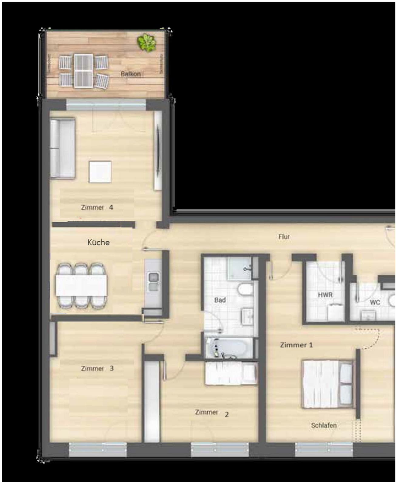
4-Zimmer (Küche abgetrennt)