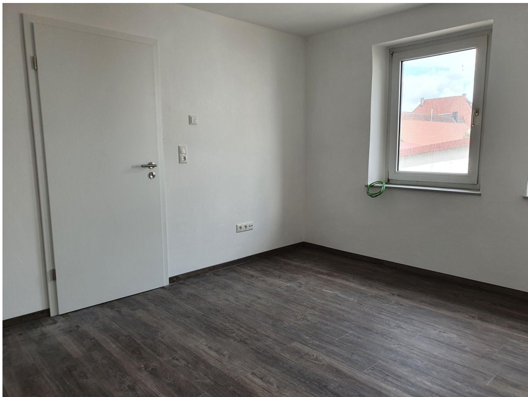
Schlafzimmer 1. OG