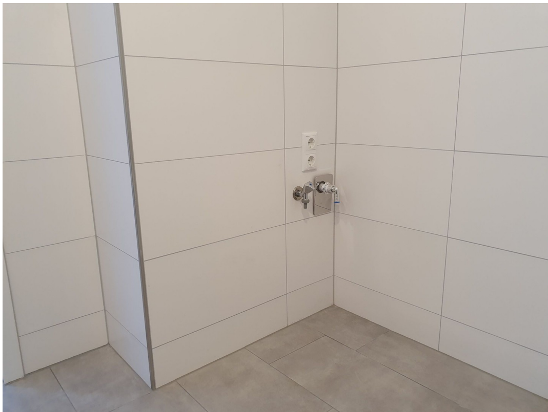
Waschmaschinenanschluss im Bad