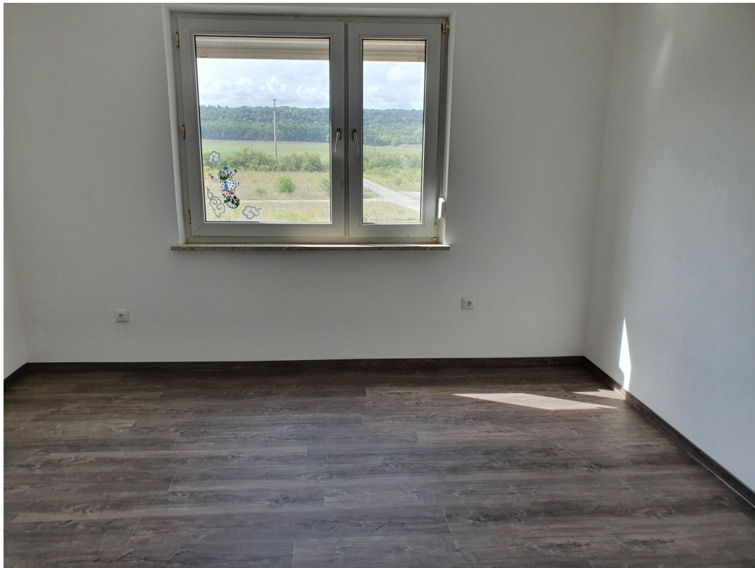
Wohnzimmer/Arbeitszimmer 1. OG