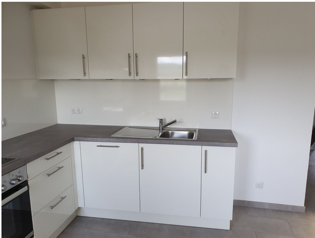
Küche 1. OG