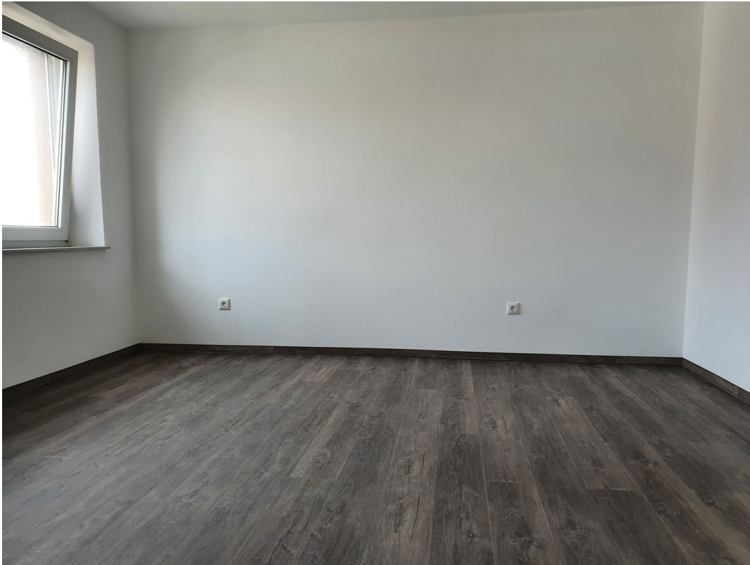
Schlafzimmer 1. OG