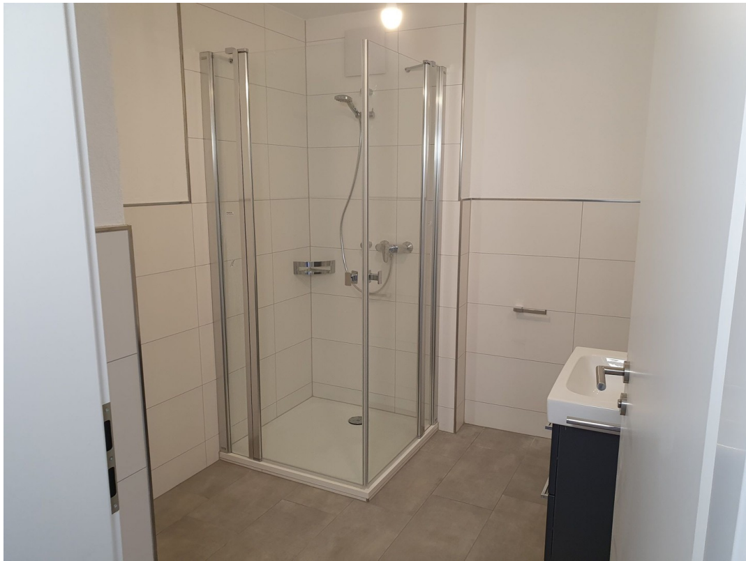
Bad 1. OG