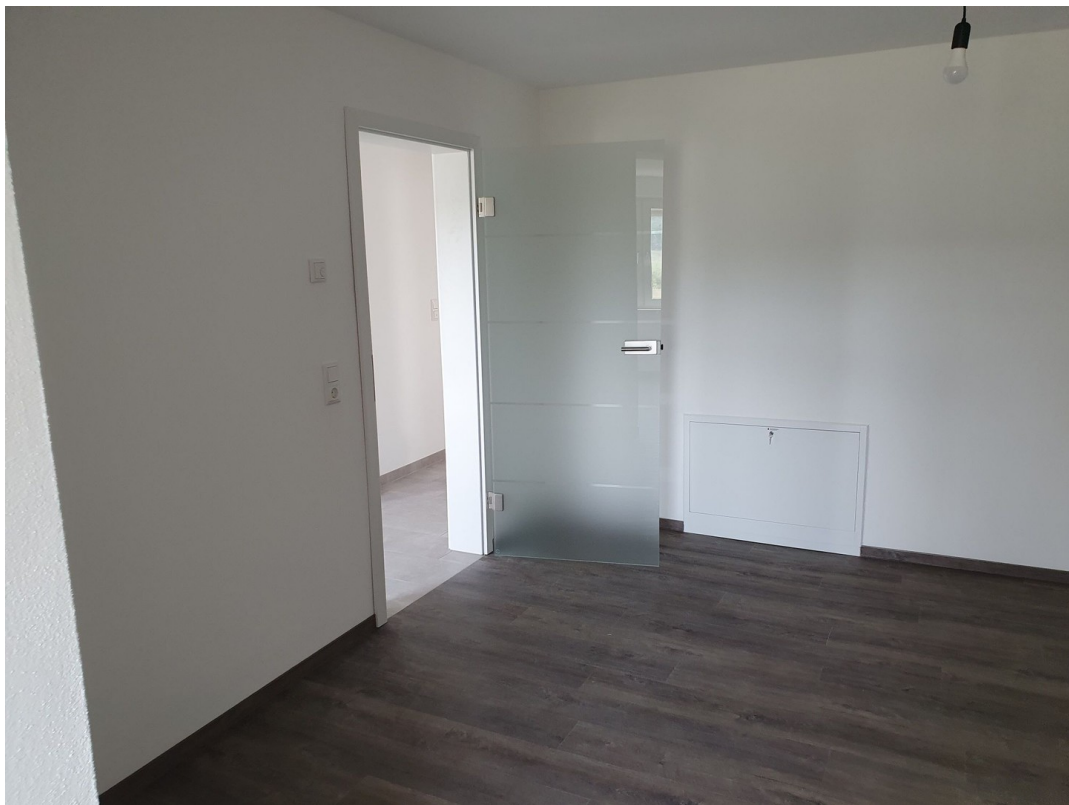
Wohnzimmer 1. OG