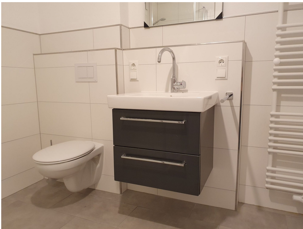
Bad 1. OG