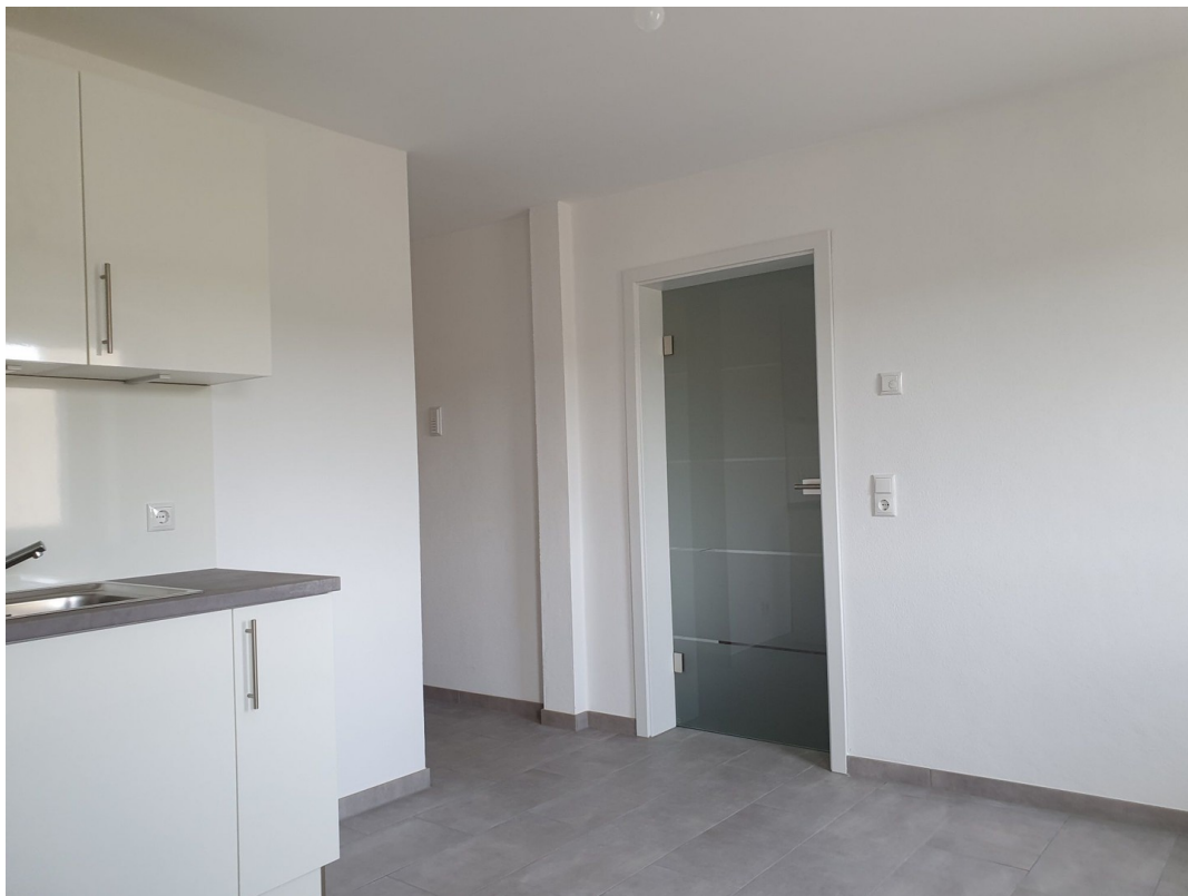
Küche 1. OG