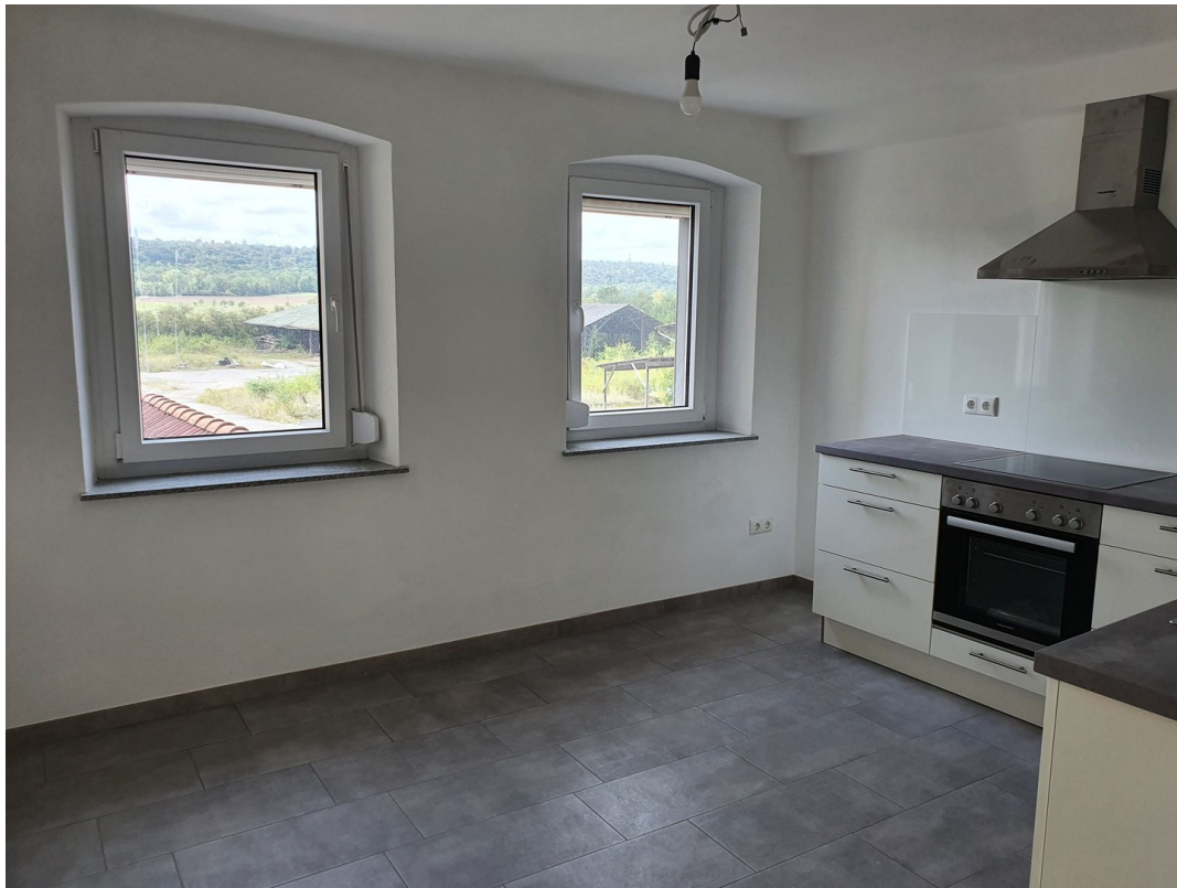
Küche 1. OG