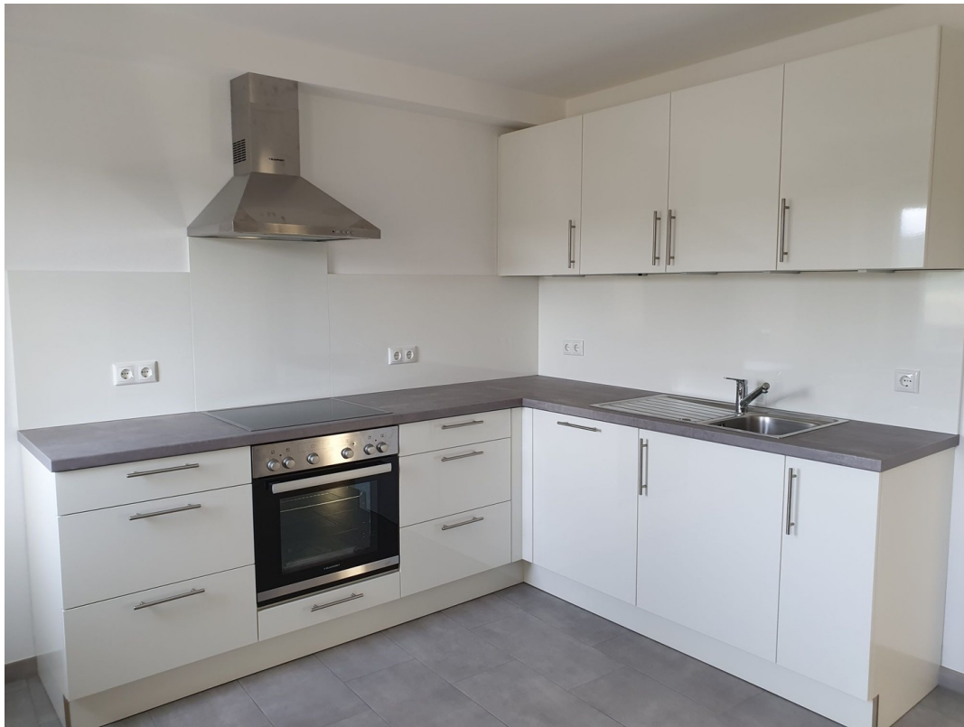
Küche 1. OG