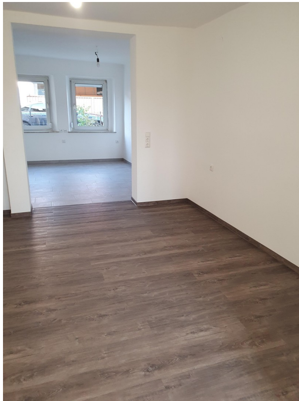
Blick v. WZ in die Küche EG