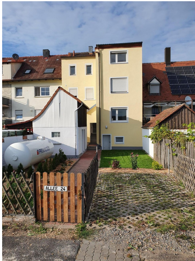
Ansicht von der Gartenseite