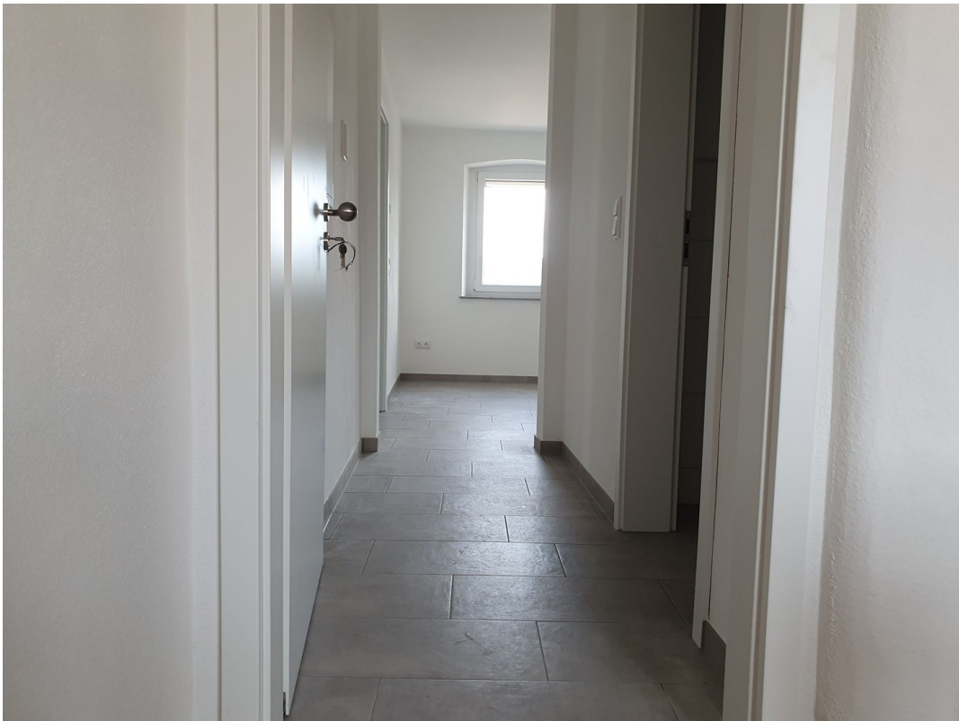
Flur 1. OG