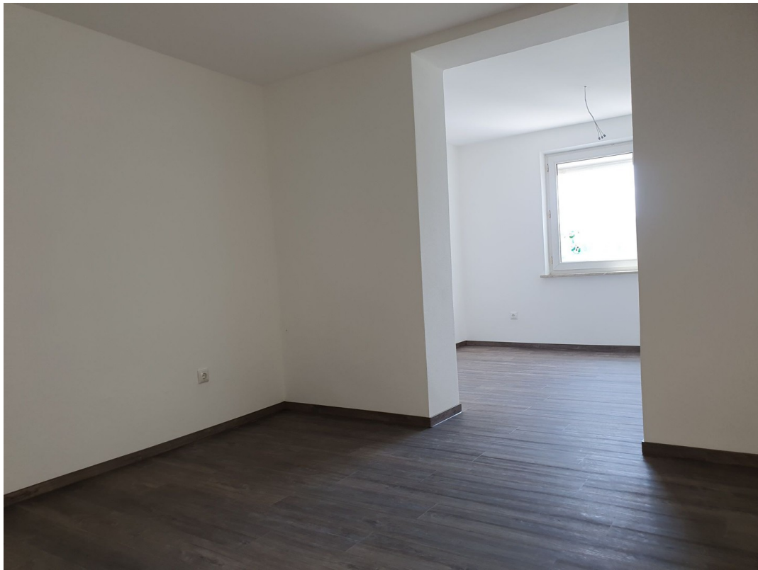
Wohnzimmer 1. OG