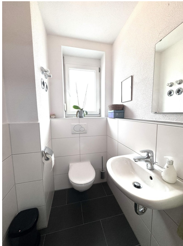
Gäste-WC mit Fenster