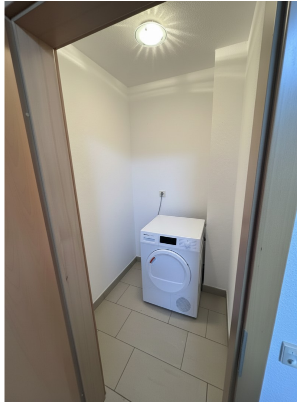
Abstellraum mit Trockner