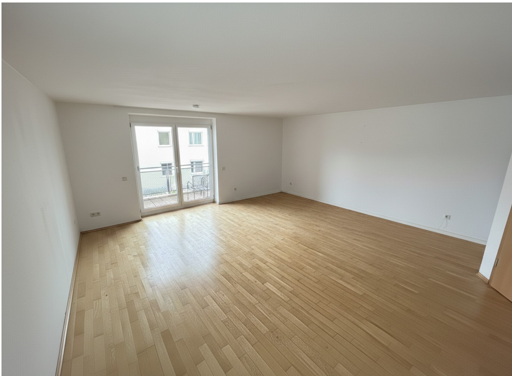
Wohnzimmer 35m 2