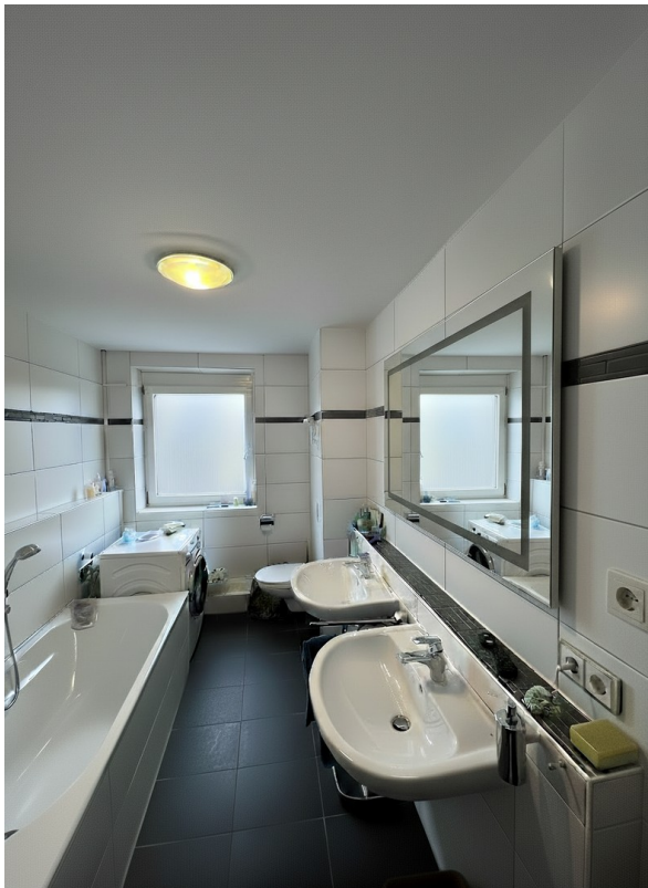
Bad mit Dusche und Wanne