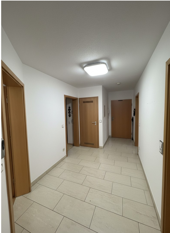
Gang Keine Durchgangszimmer