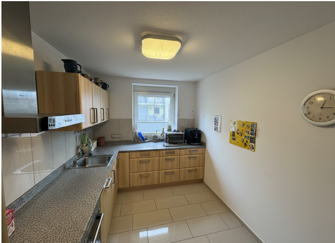
Küche mit Granitplatte