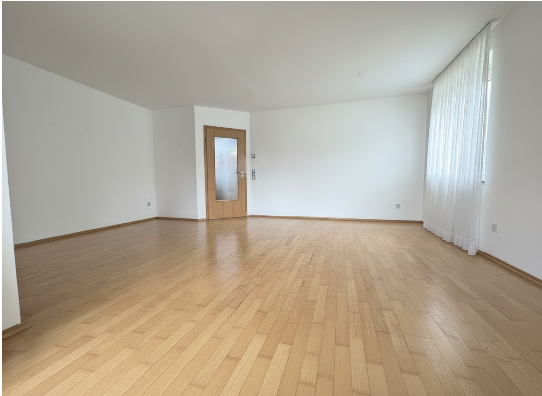
Wohnzimmer mit Balkon