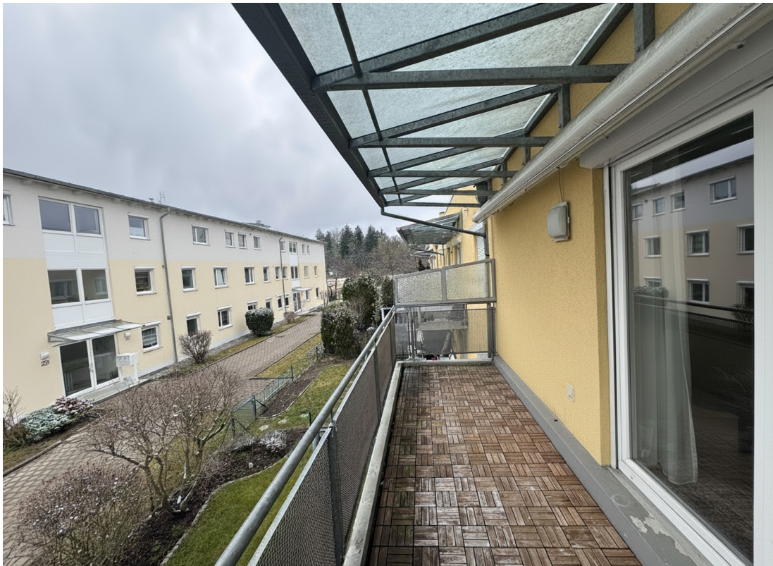
Balkon mit Blick ins Grüne