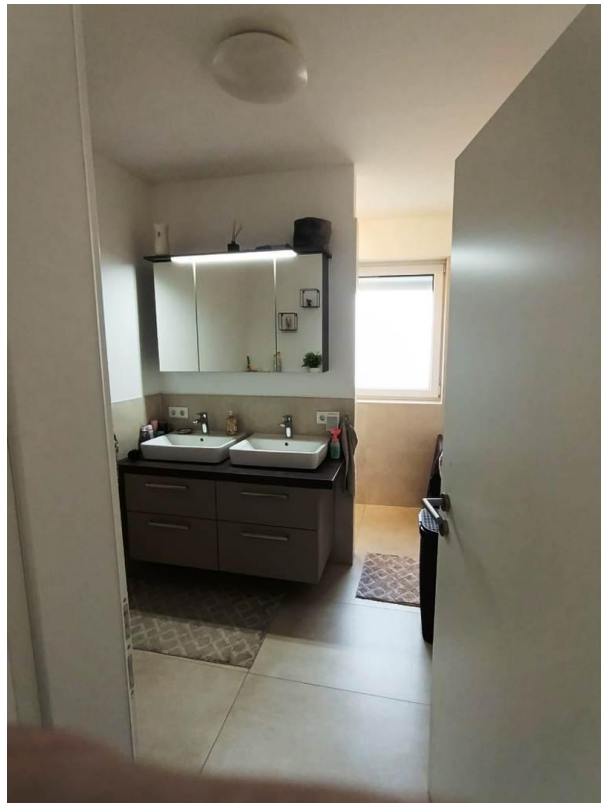
Duschbad im OG mit Fenster