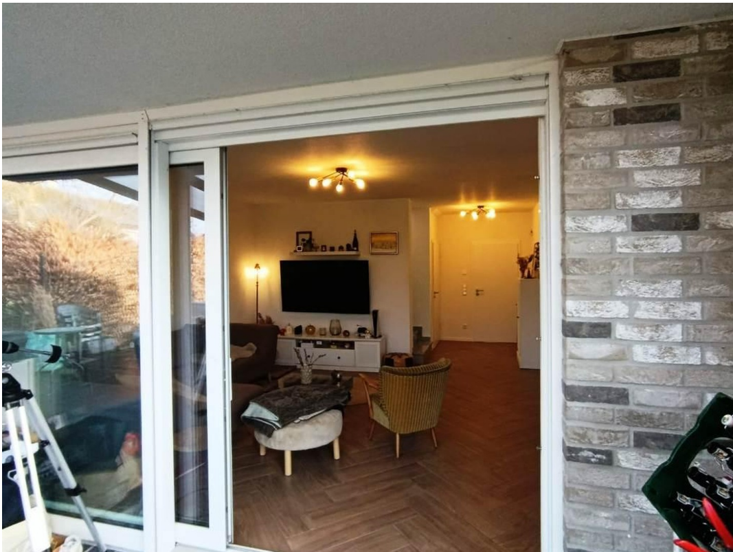
Panoramafenster 4 Meter lang