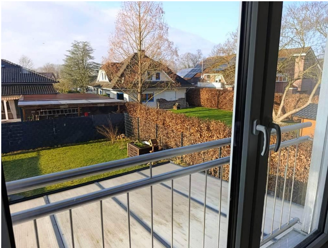
Blick auf Garten vom SZ