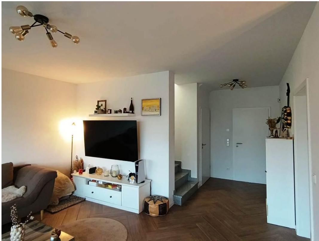
Blick auf Eingangstür/Treppe