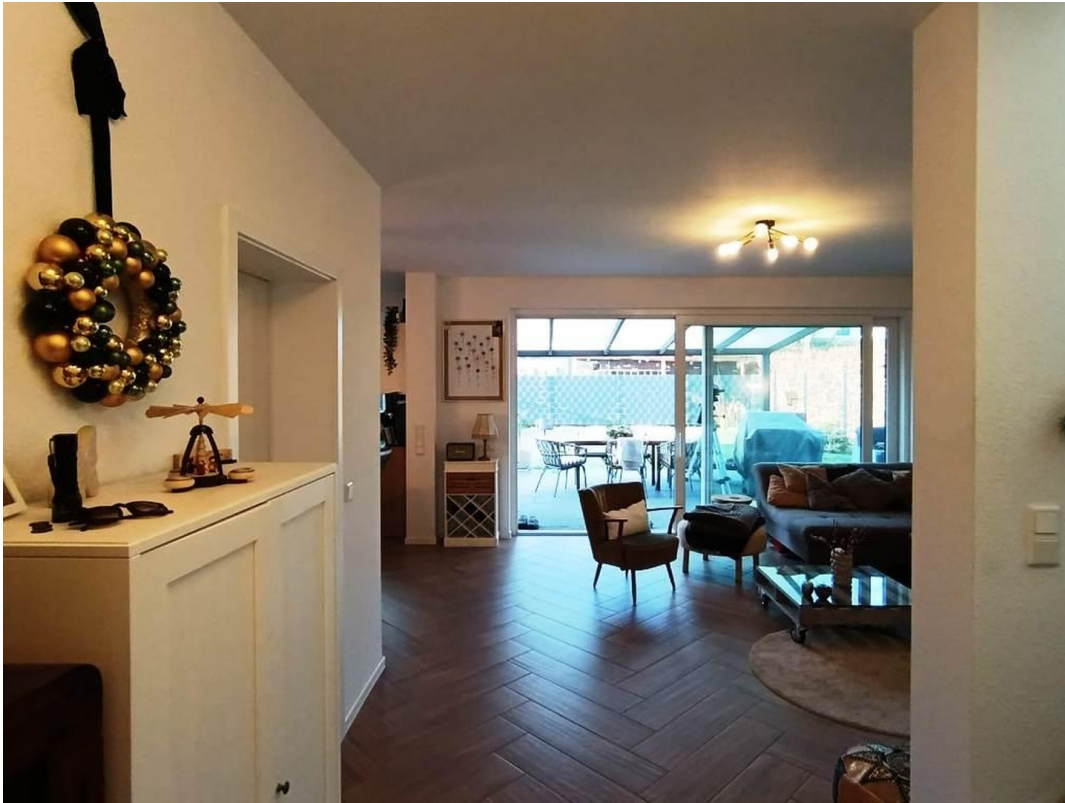
Wohnbereich mit Terrasse