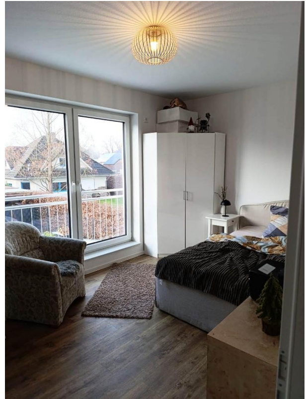
SZ mit sehr schönem Ausblick