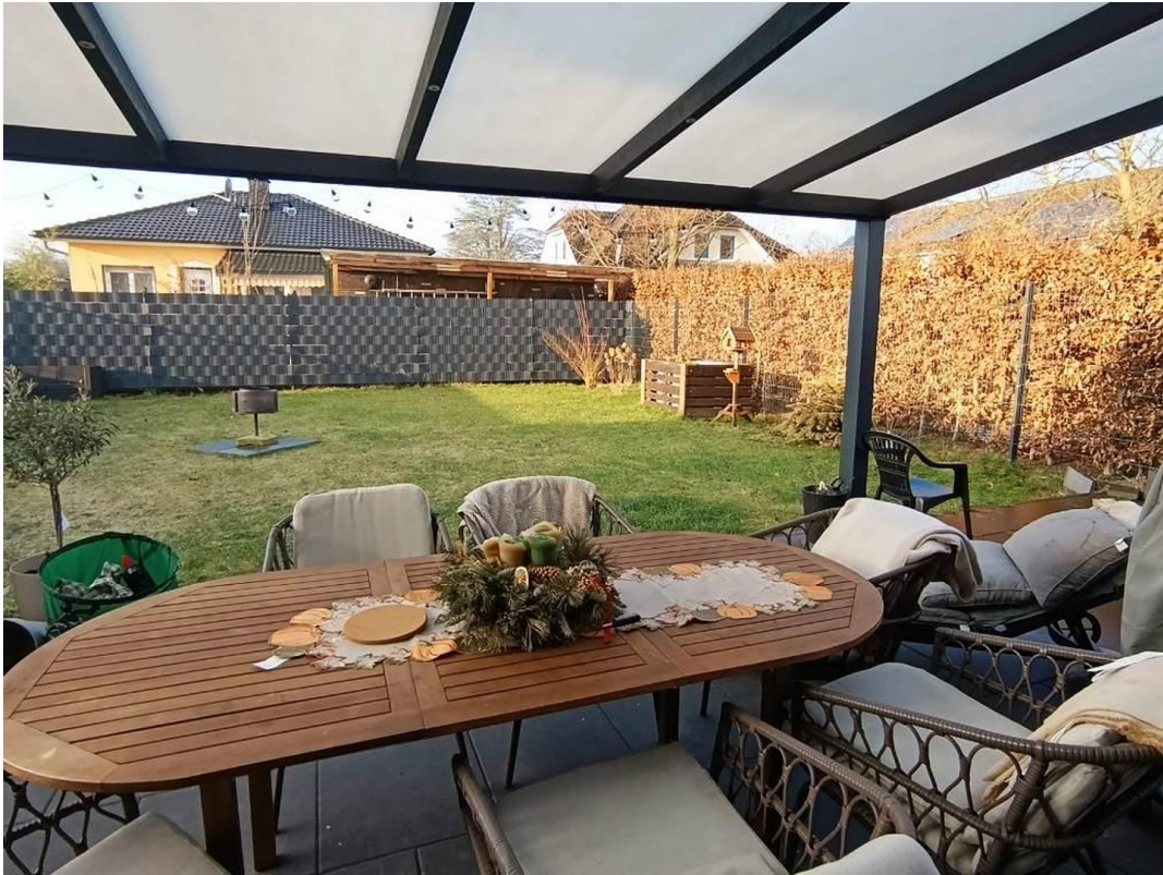
25qm überdachte Terrasse