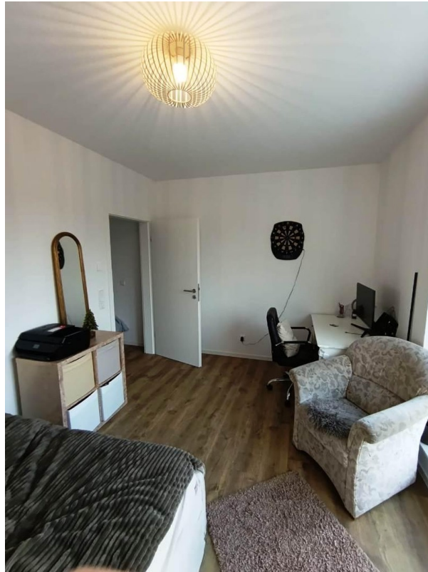
Gästezimmer oder Büro