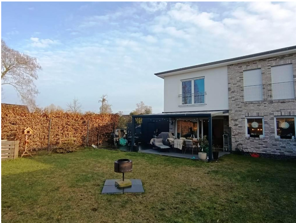
Grillplätzchen und Terrasse