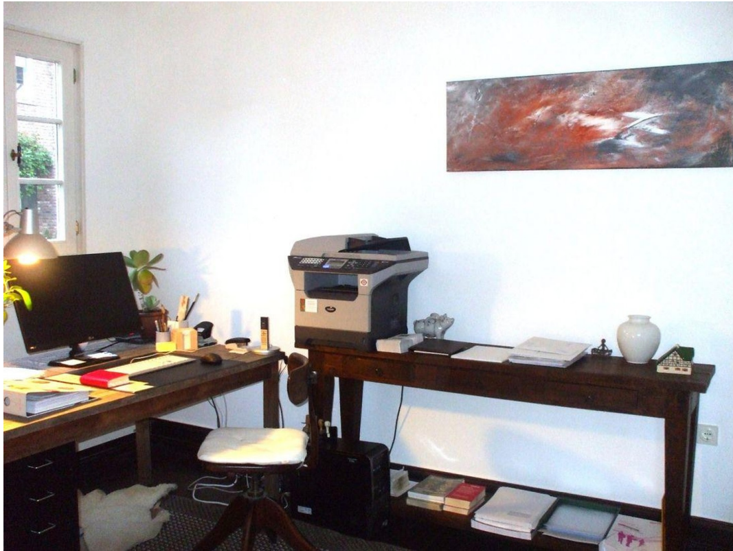
Kleiner Raum im EG ca. 10 qm