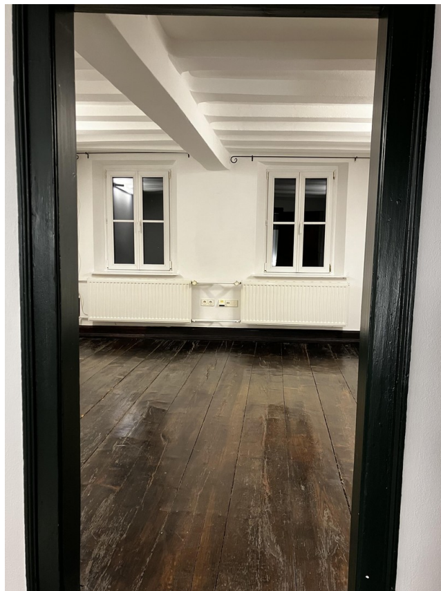
Büro OG (2 mal ca. 15-16qm)