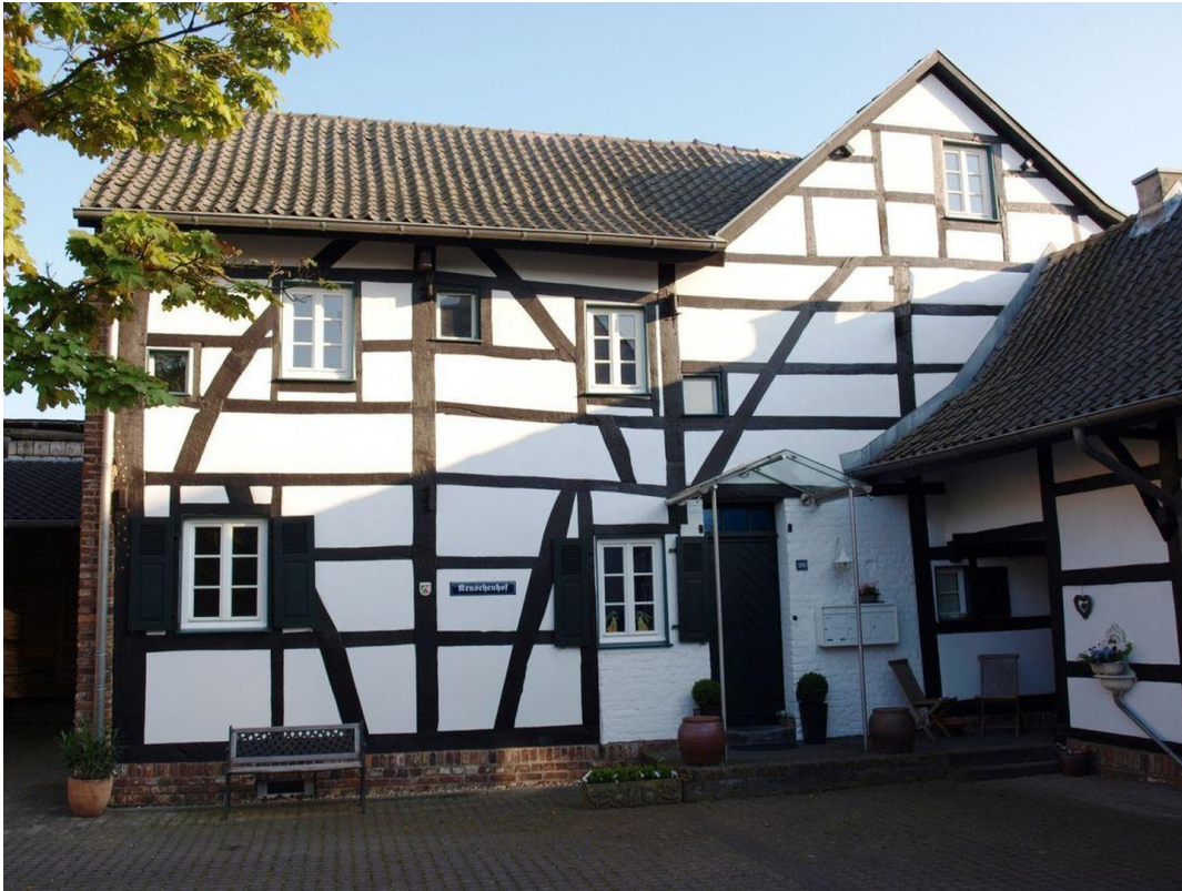
Außenansicht vom Innenhof