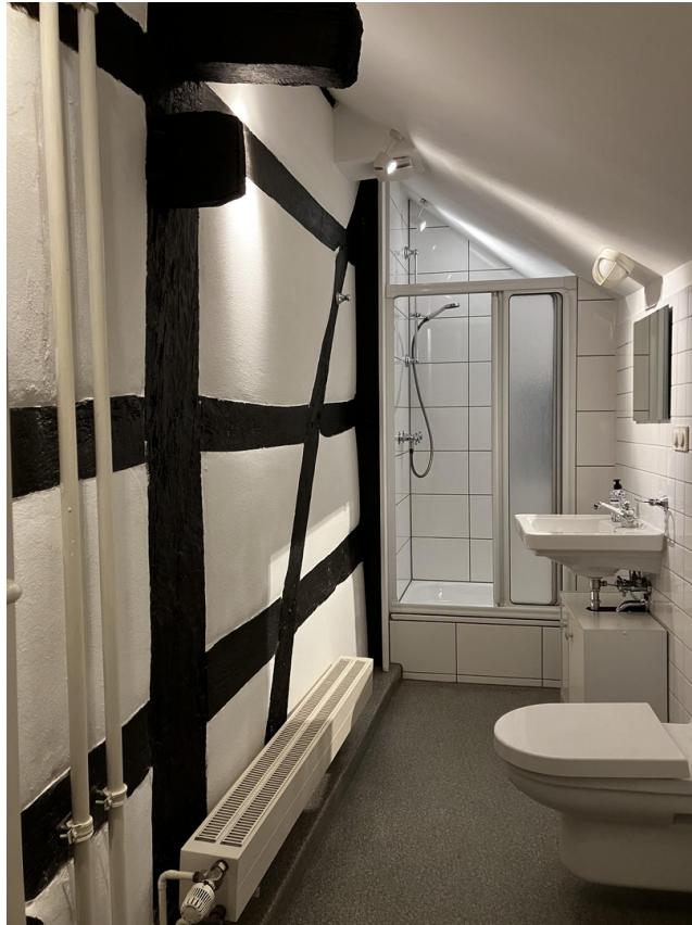
Nasszelle mit Dusche und WCs