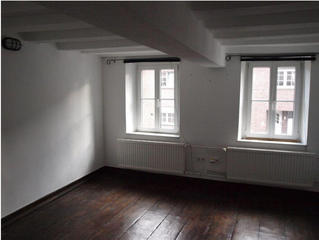
Großer Raum im OG (1 von 2)