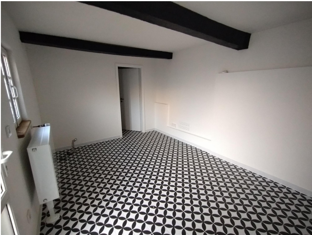
Raum mit separatem Eingang