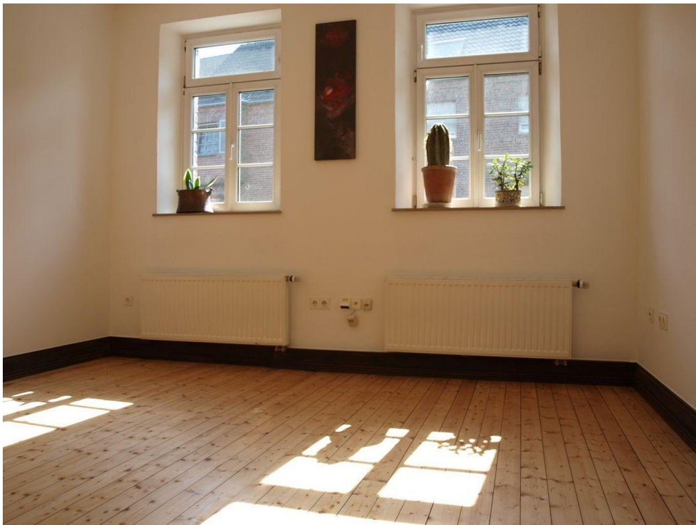
Großer Raum im EG (1 von 2)