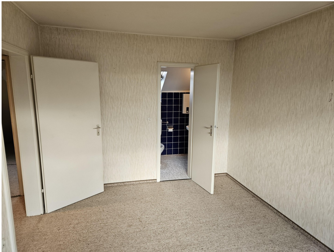
Dusch-WC im DG-Studio