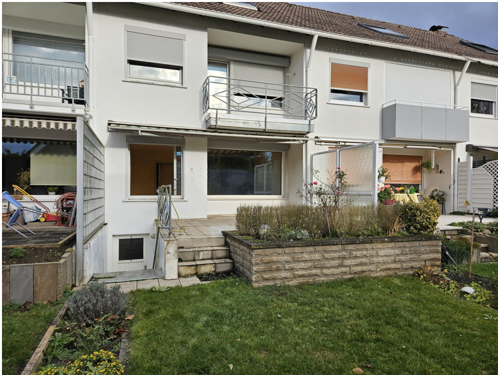
Haus von hinten