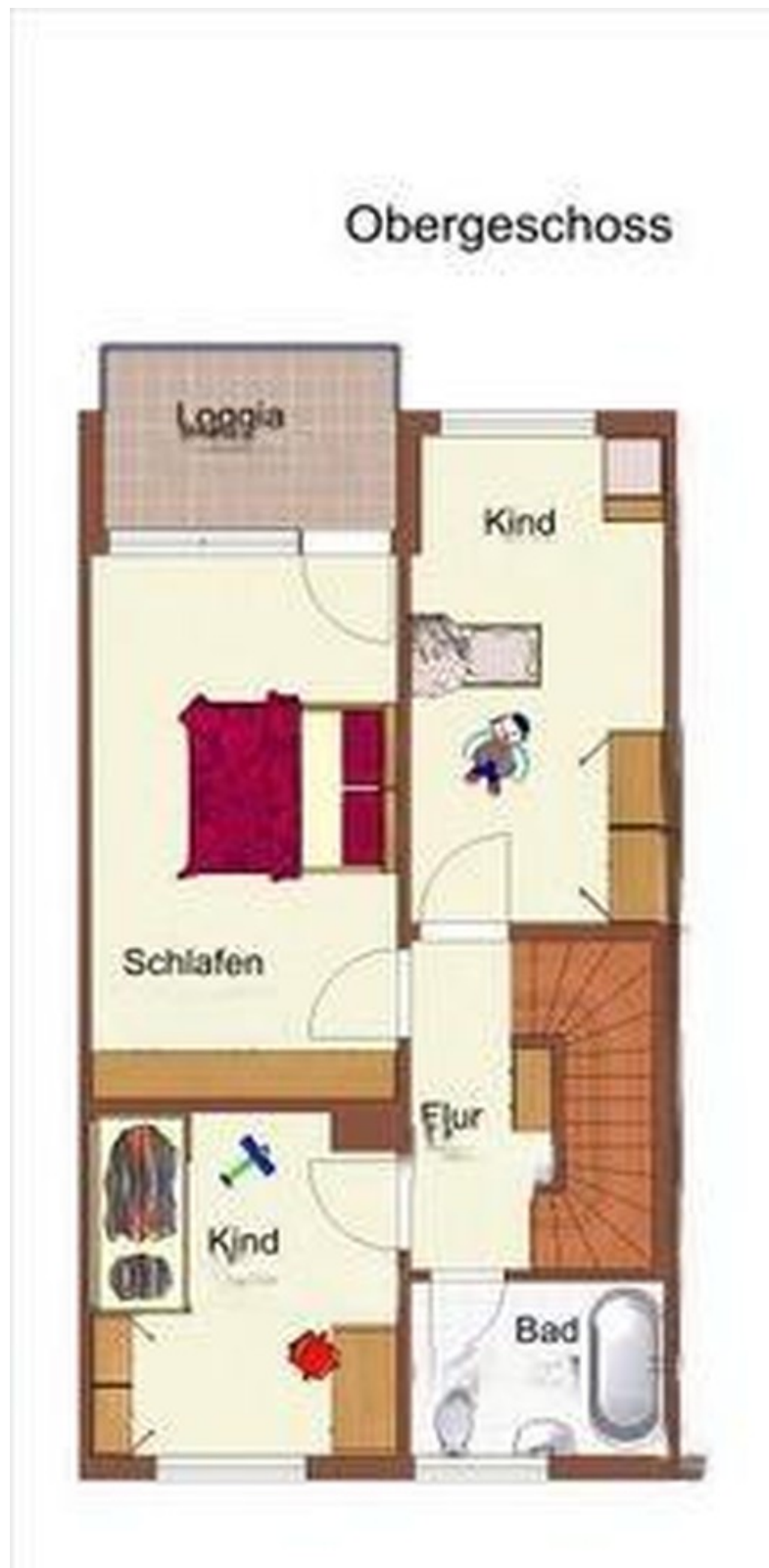
1. OG mit Balkon