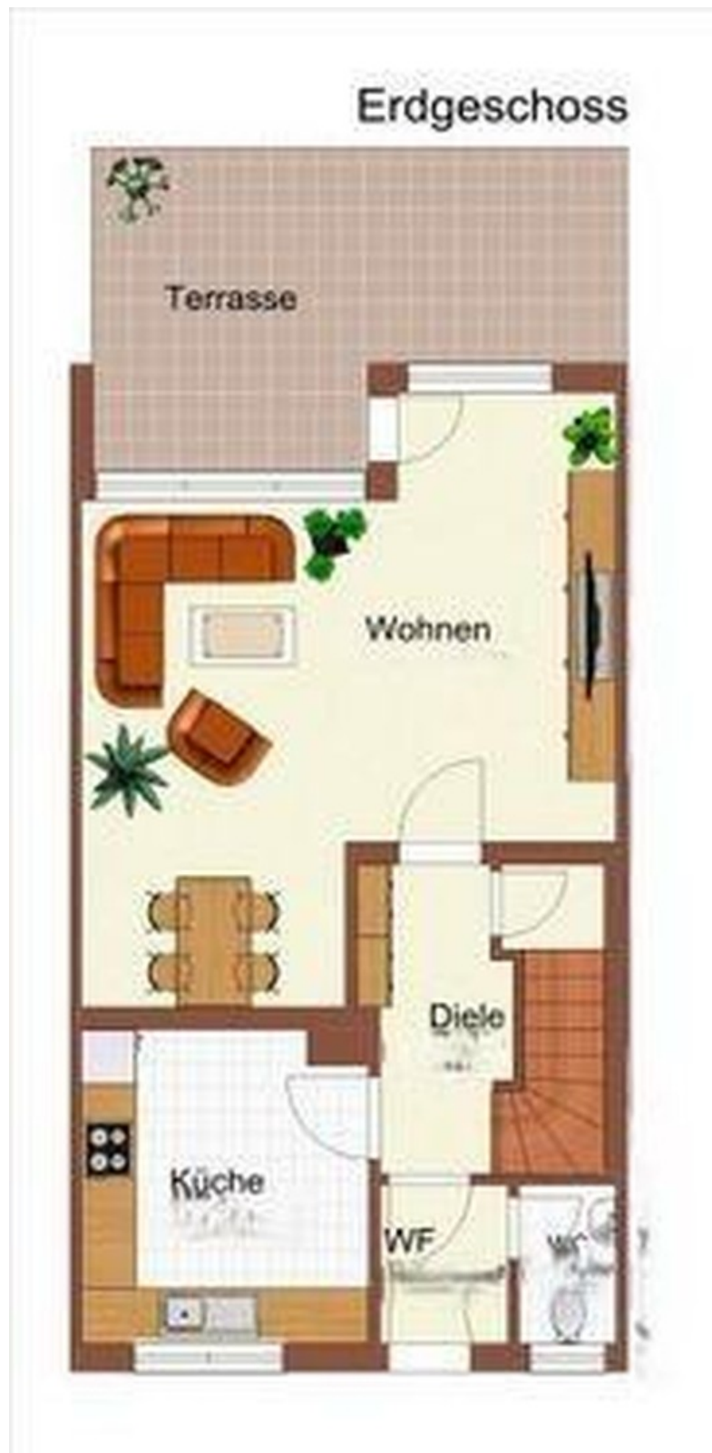
EG mit Terrasse