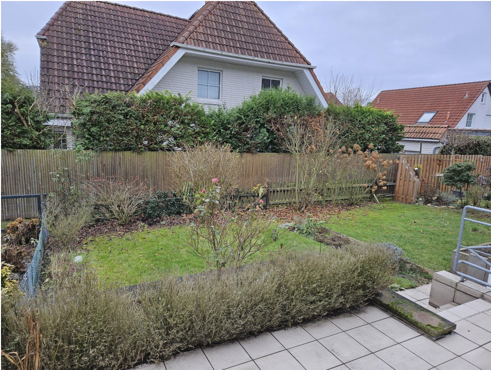
Blick von der Terrasse