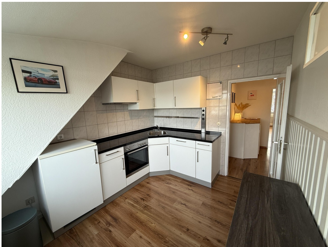
Küche (Geschirrspüler etc)