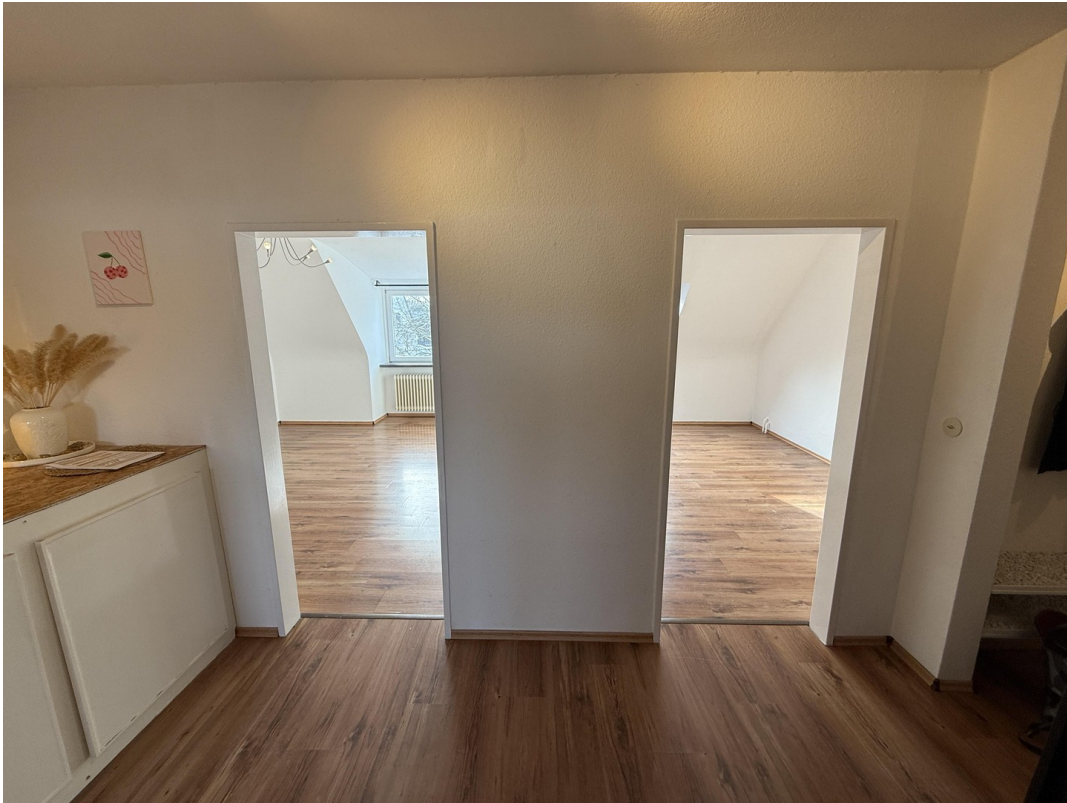
Flur, li. Wohnzimmer, re. Schl