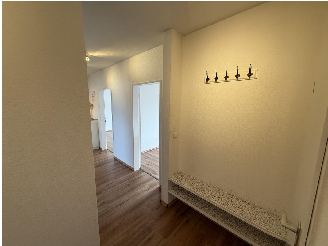
Flur / Garderobe