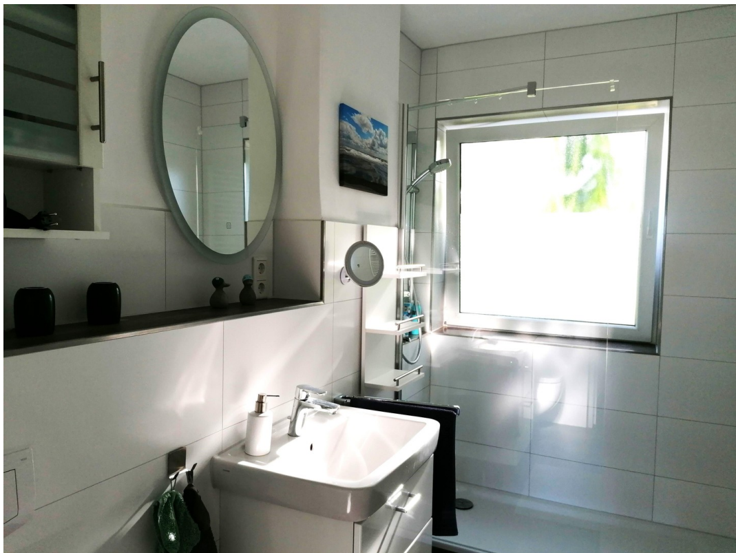
Bad mit begehbare Dusche