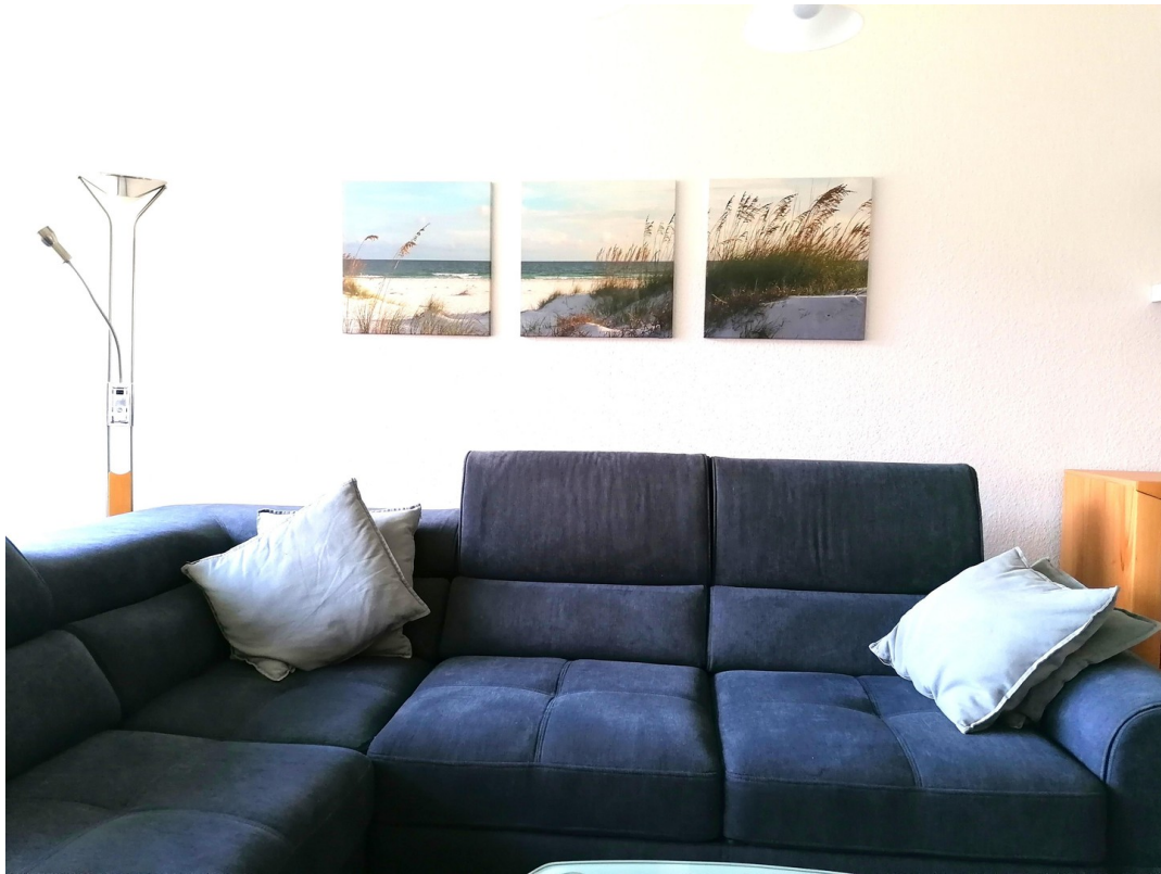
Ecksofa mit Schlaffunktion