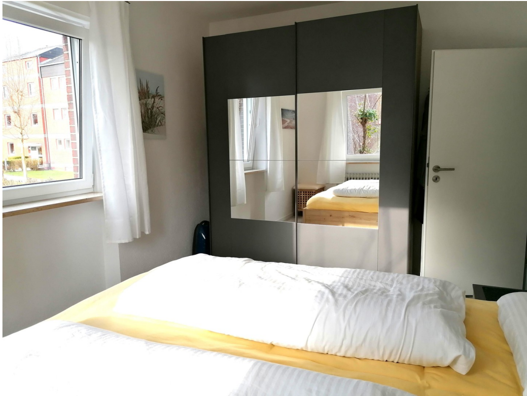
Schlafzimmer m. Kleiderschrank