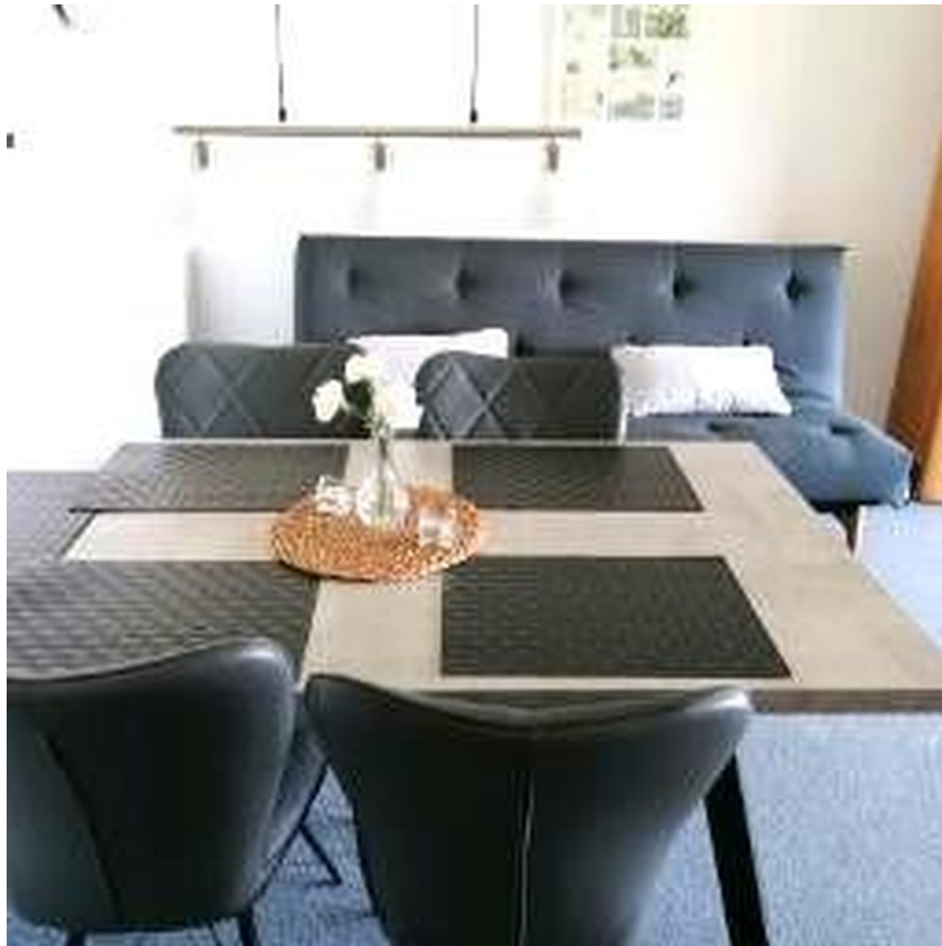
Wohnzimmer inkl. Schlafsofa