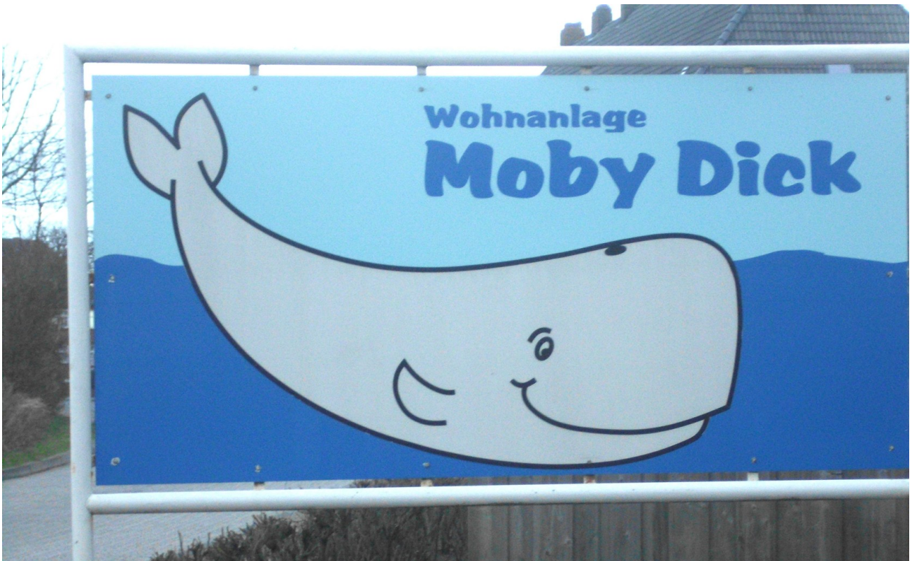
Ferienwohnanlage "Moby Dick"