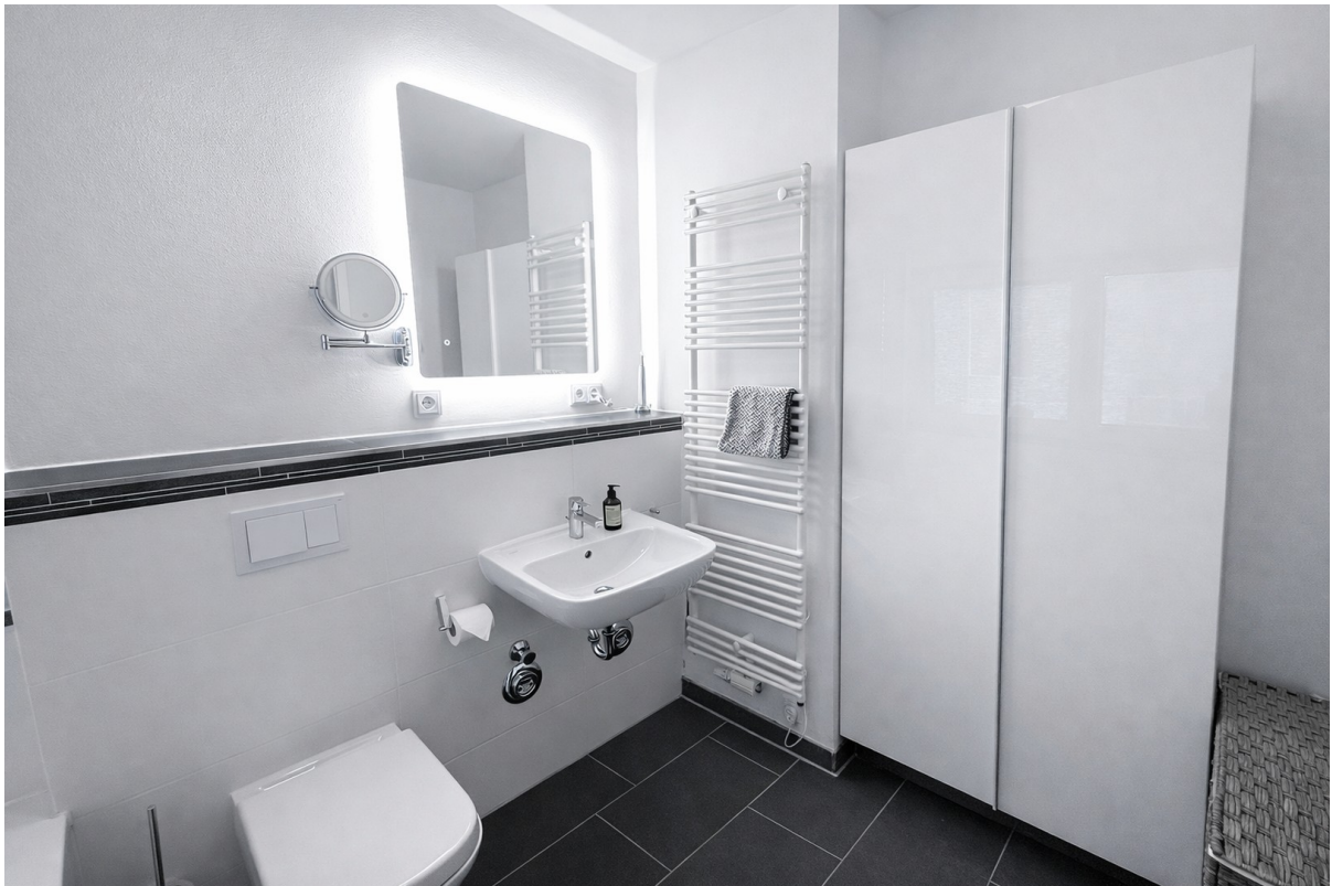
Bad en suite_1