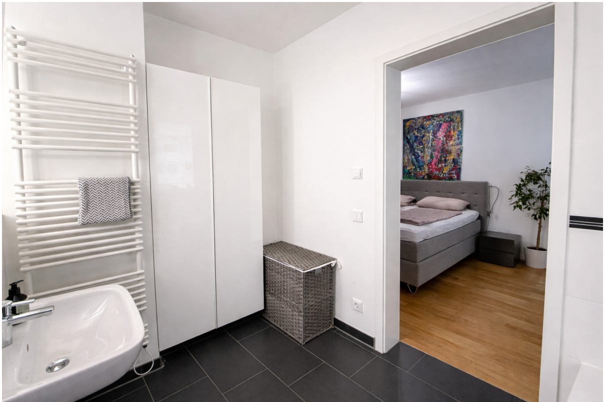
Bad en suite_3