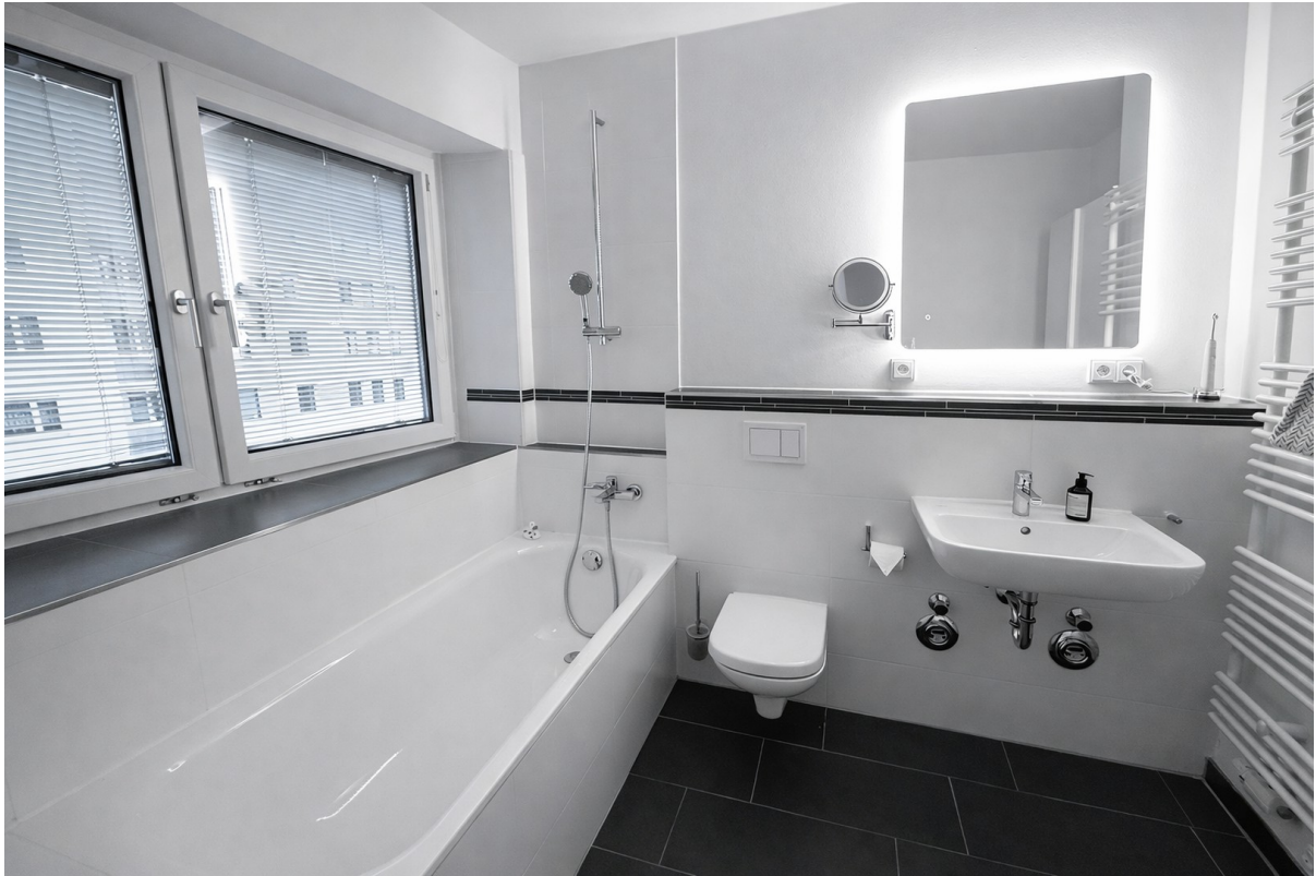
Bad en suite_2