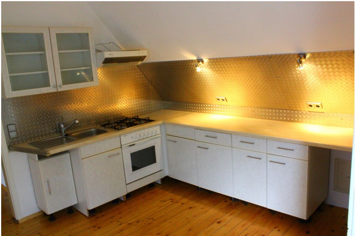
Küche mit Einbauküche