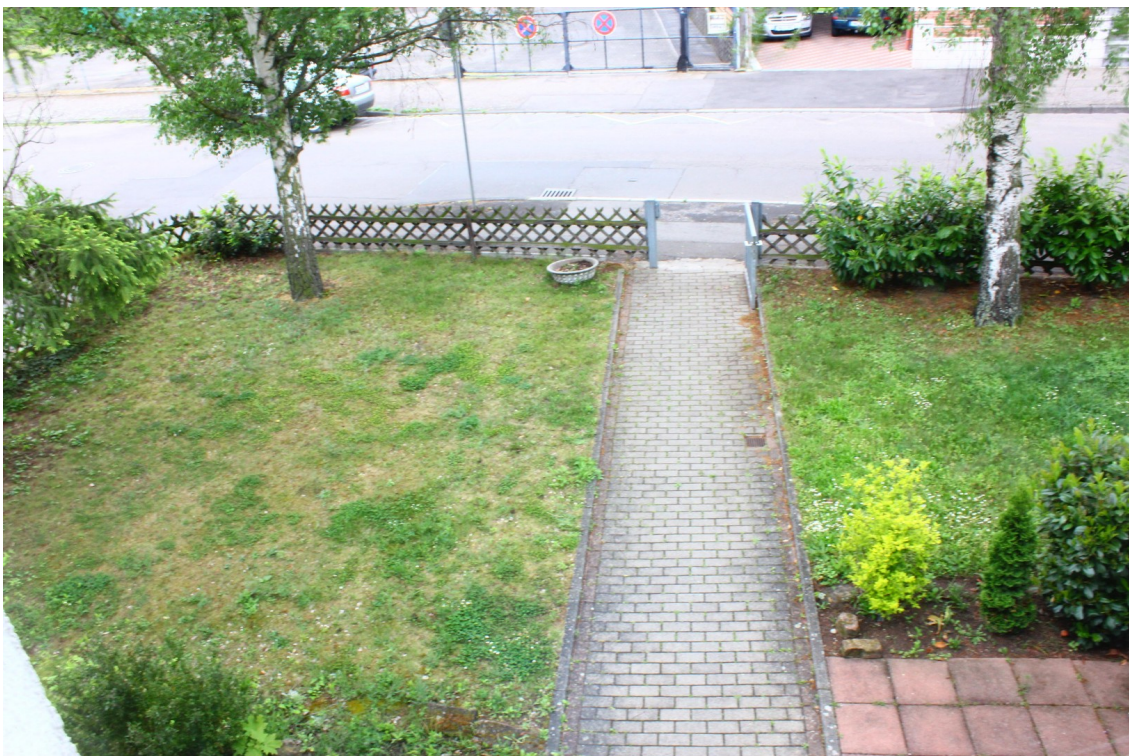
Blick aus dem Schlafzimmer