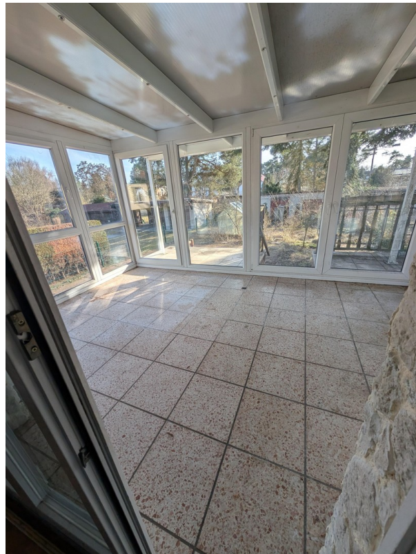
Blick zum Wintergarten