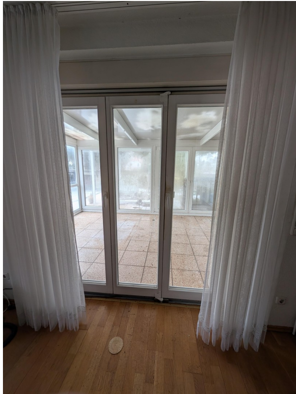
Blick zum Wintergarten