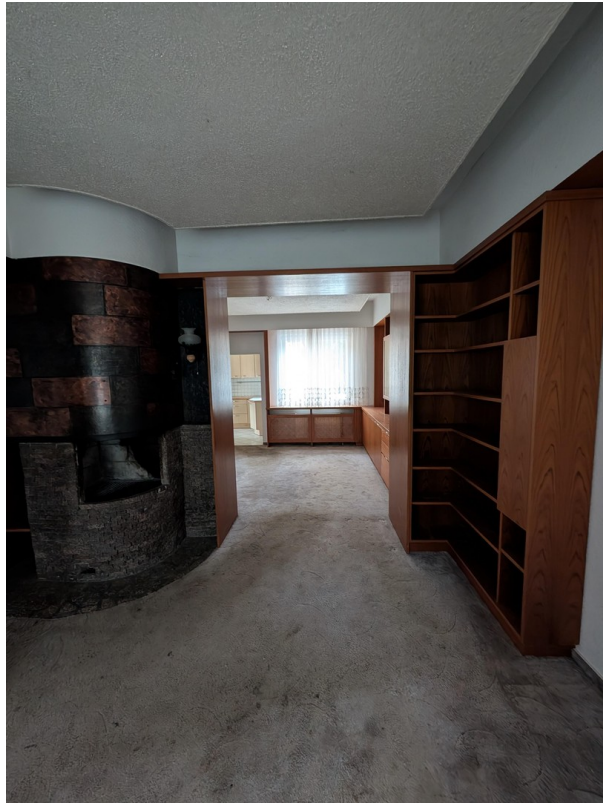
Wohnzimmer mit Kamin