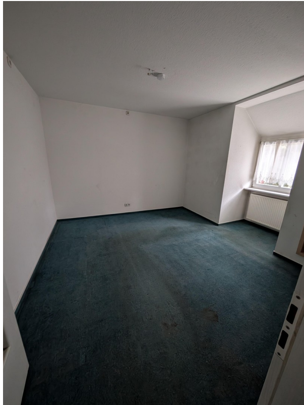
Zimmer 1 im OG