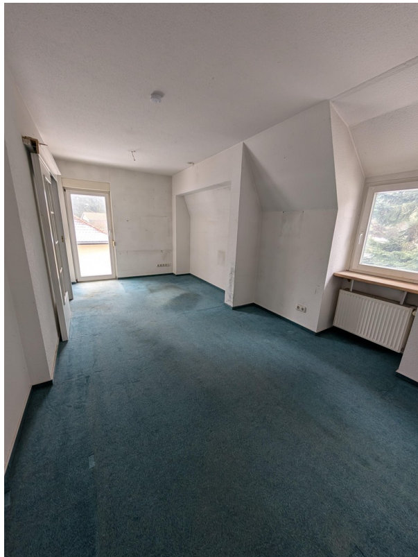
Zimmer 2 im OG