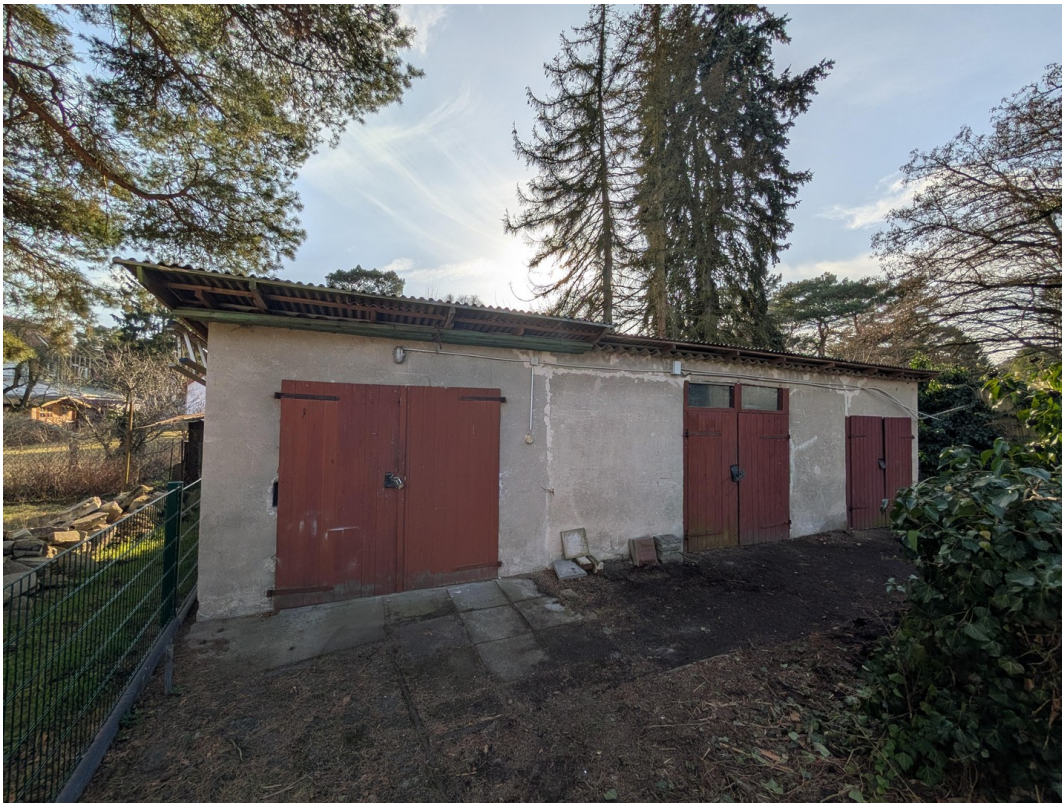
Garage und Schuppen