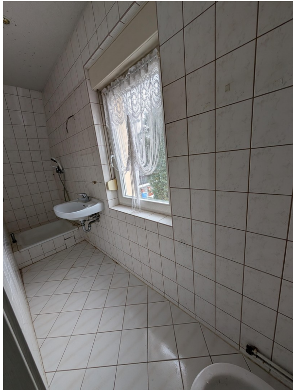
Bad im OG