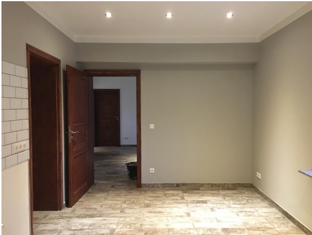
Küche OG 2