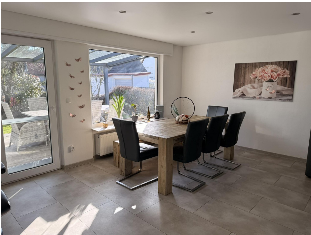
Essbereich mit Blick in Garten