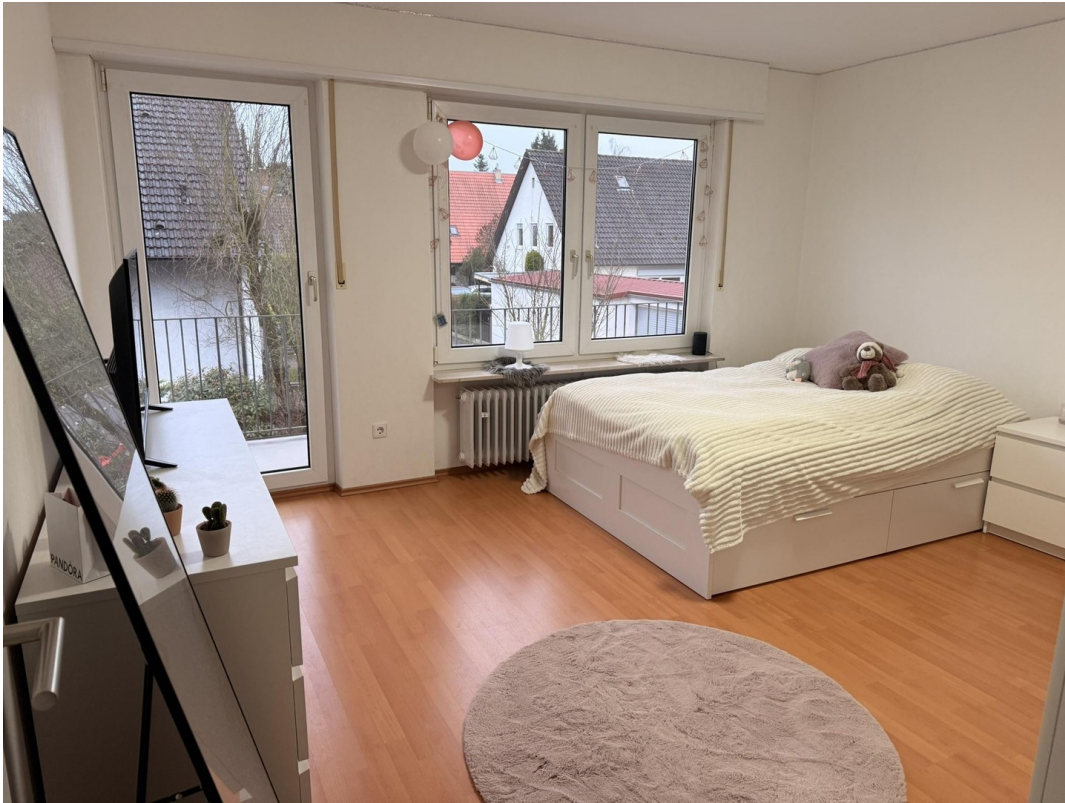
Kinderzimmer mit Balkon