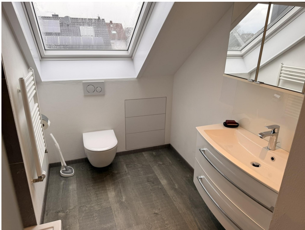
Bad mit Dusche DG