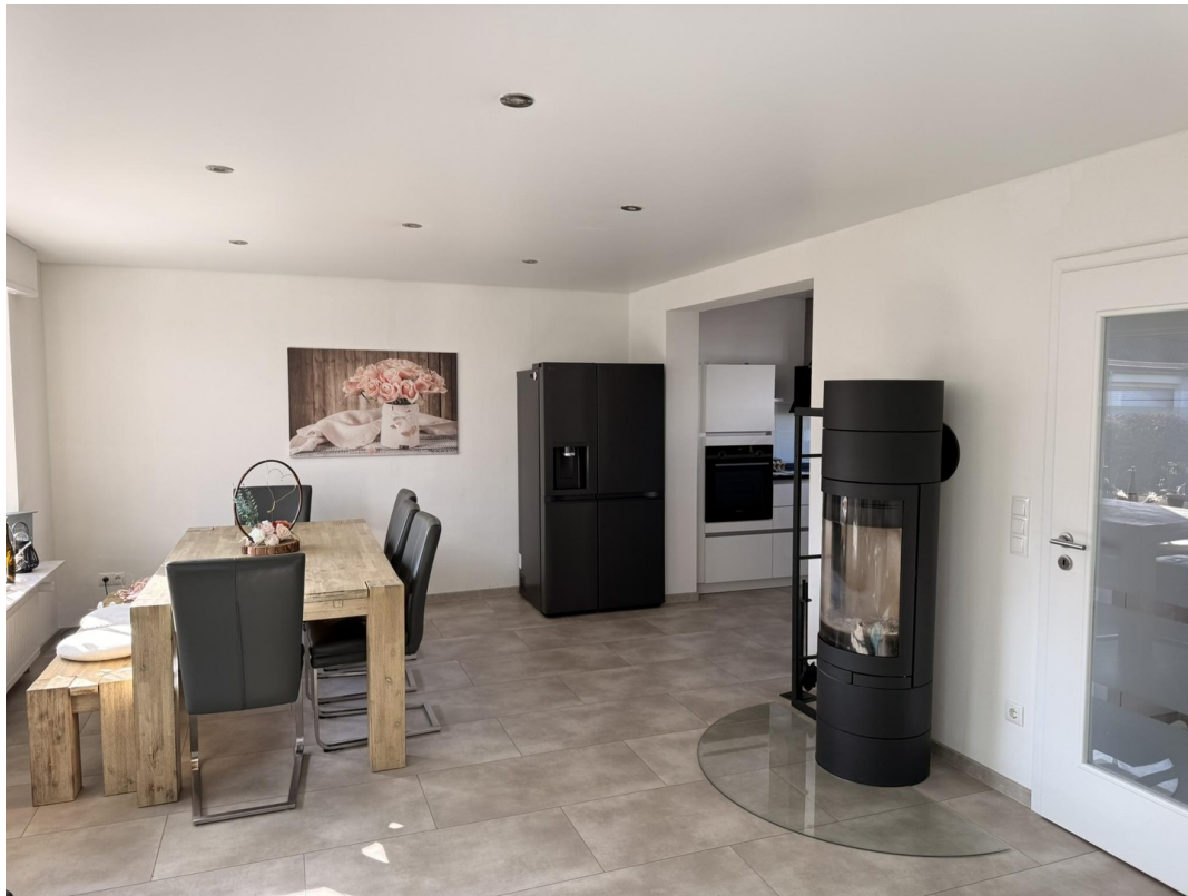
Essbereich mit Kamin