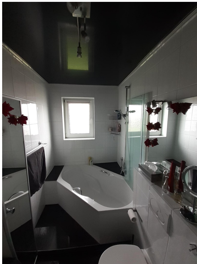
Bad_03 ohne Deko