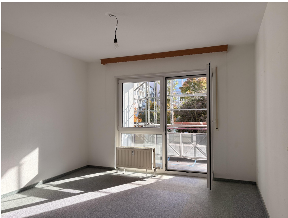
Arbeits- / Kinderzimmer