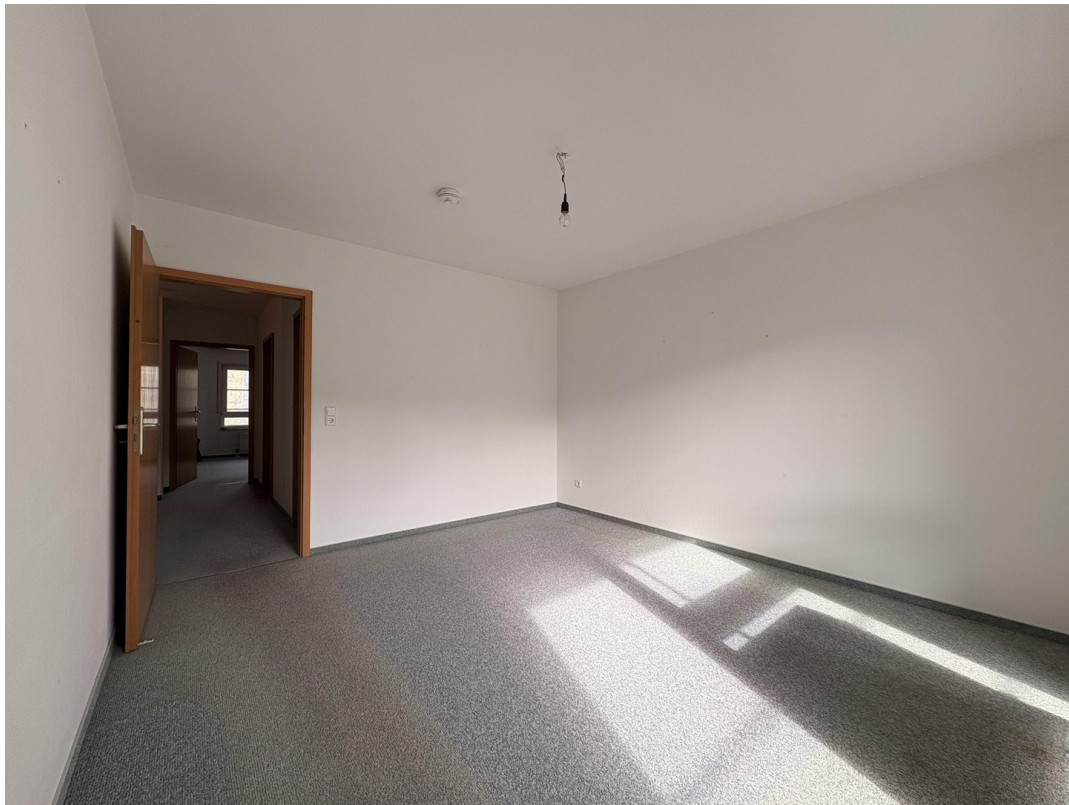
Arbeits- / Kinderzimmer