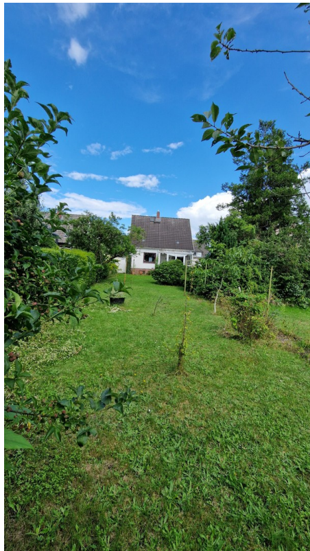
Garten Blickrichtung zum Baukõ