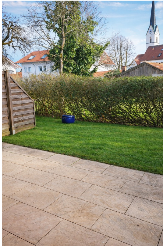
Eigener Garten und Terrasse