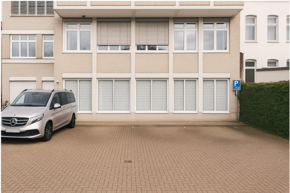
5 eigene Parkplätze