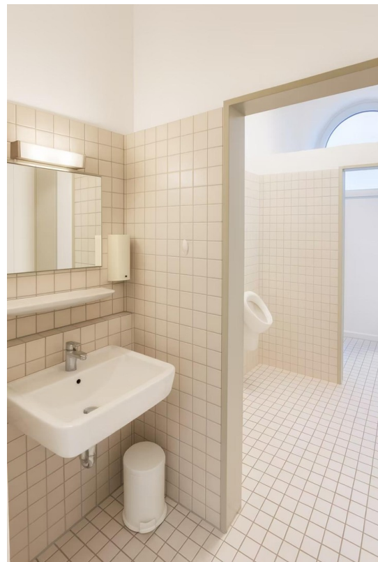
Toilettenraum 2 (3-geteilt)