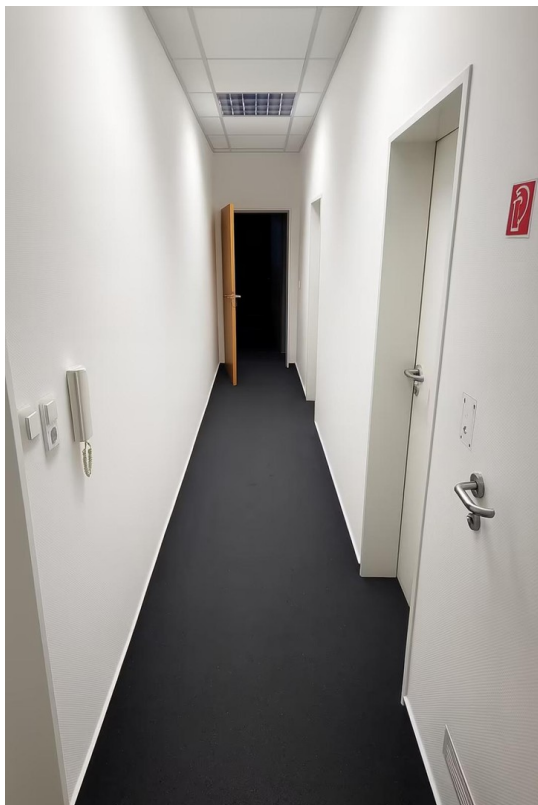
Flur zum Pausenraum