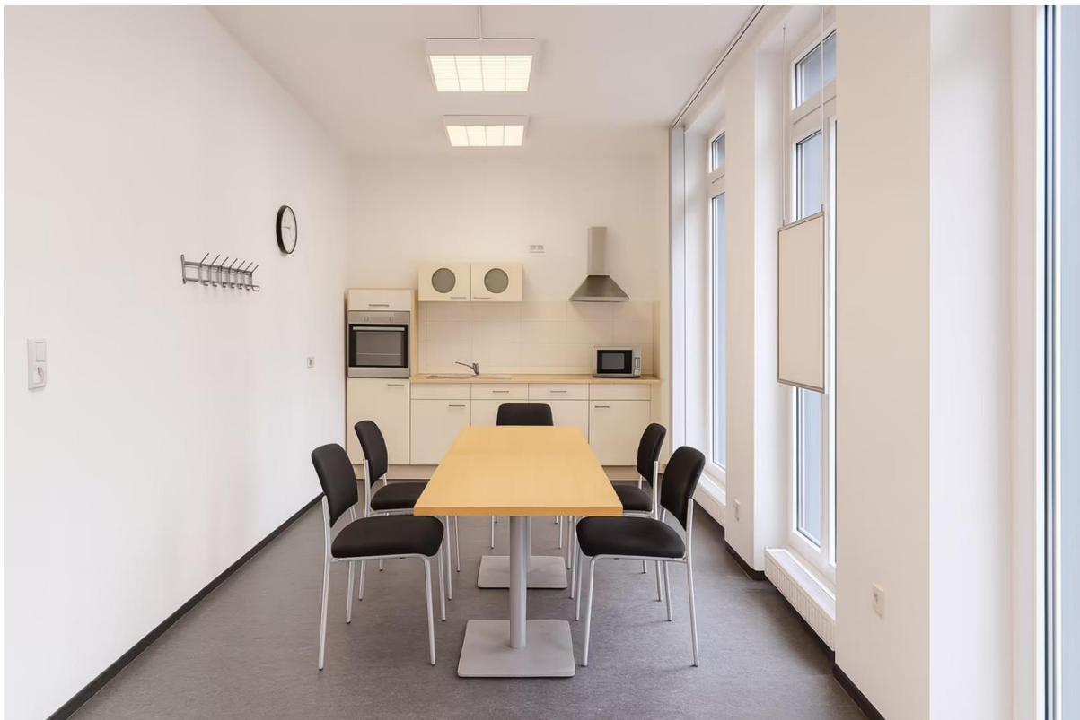
Sozialraum mit Einbauküche