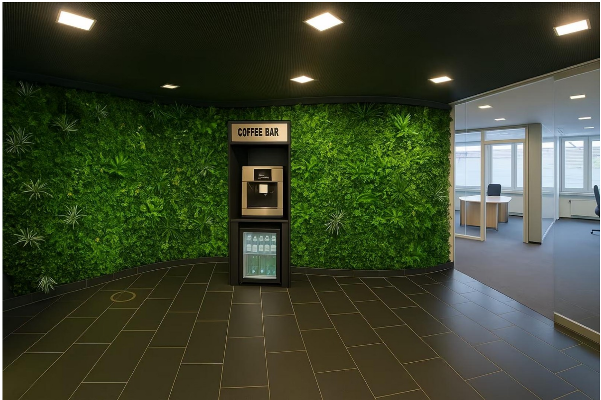
Foyer/Empfang mit Coffeebar