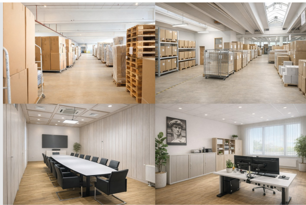
Lager/Produktion/Büro - flexibel und modern