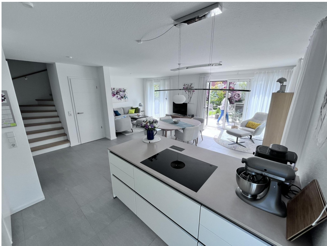
Kücheninsel mit Treppe