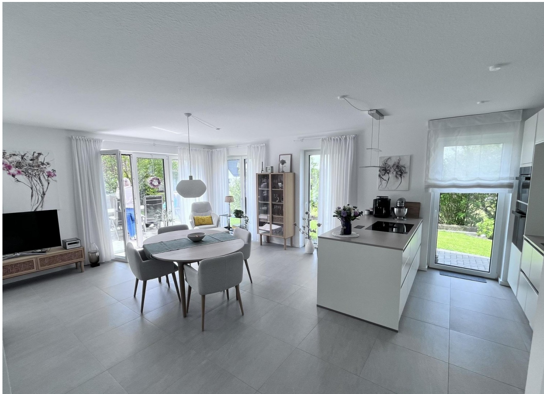
Kücheninsel mit Essplatz