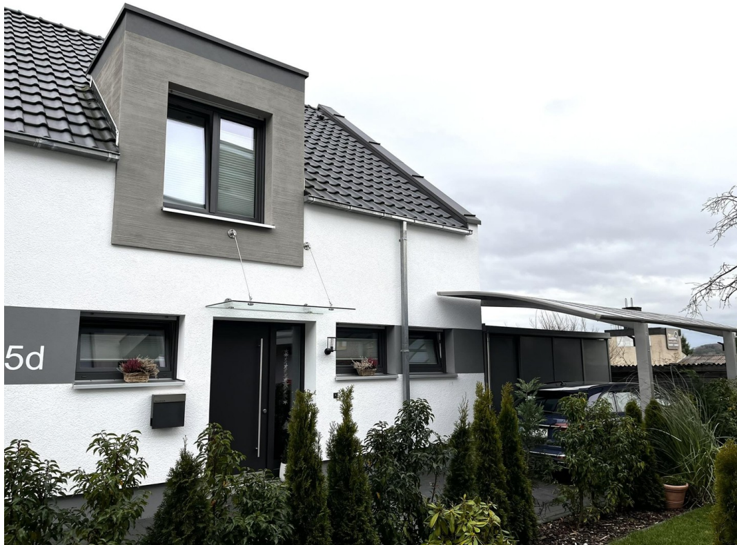
Nordansicht mit Wing-Carport