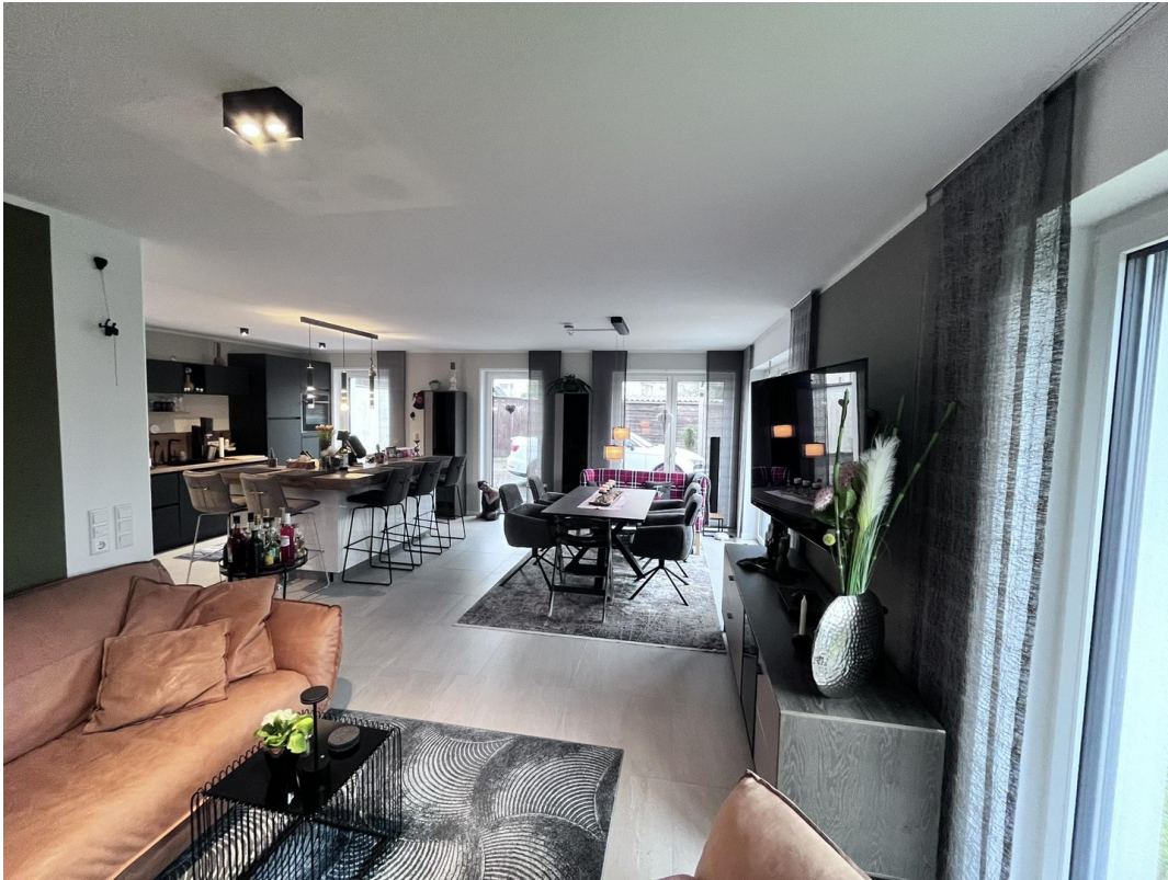
Blick vom Wohnzimmer