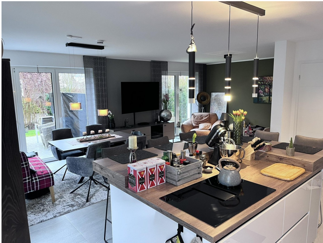
Küche und Esszimmer