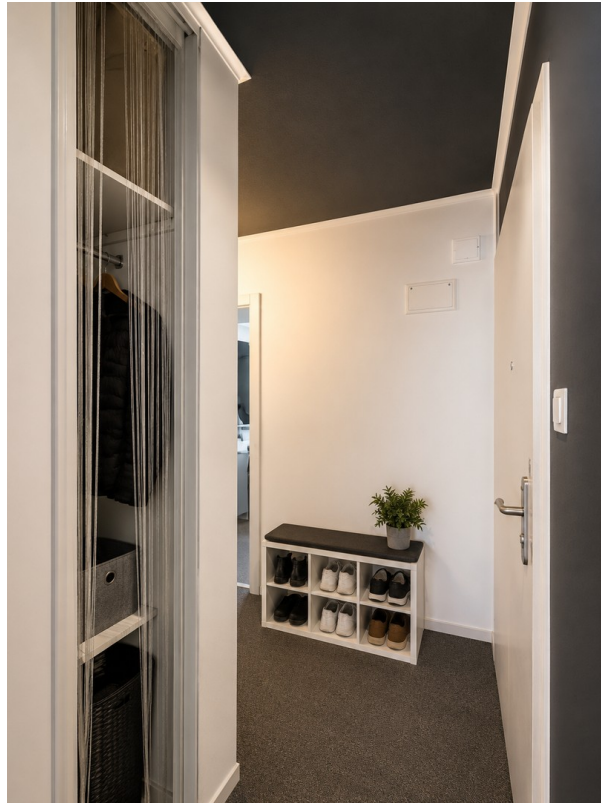
Flur Bild 1