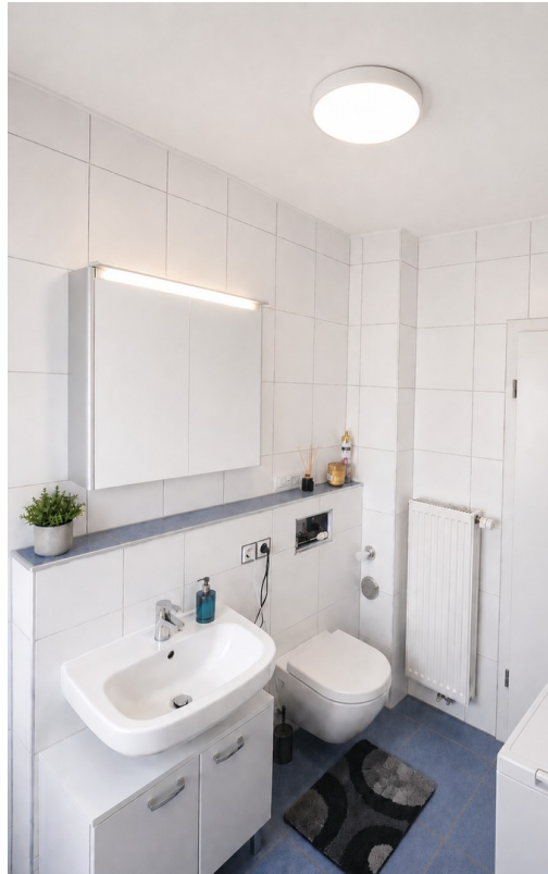
Bad/WC Bild 1