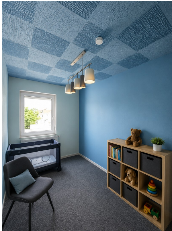
Kinderzimmer Bild 2