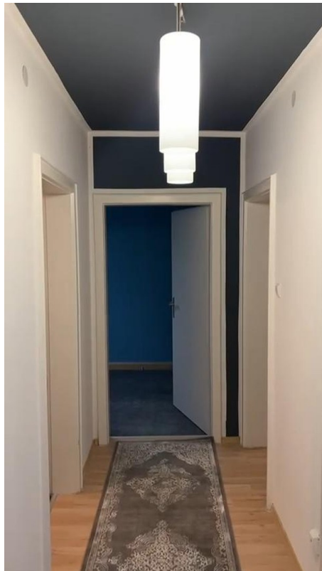
Flur Bild 2