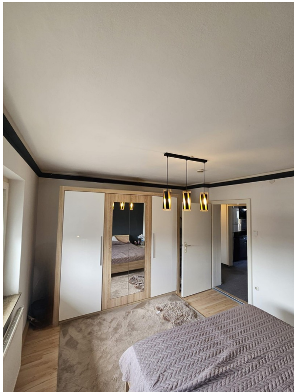
Schlafzimmer Bild 1