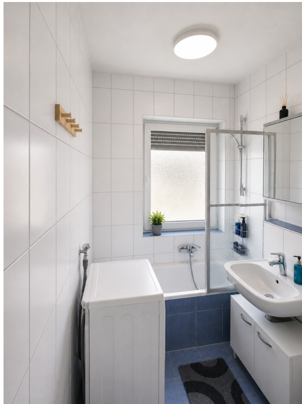
Bad/WC Bild 2