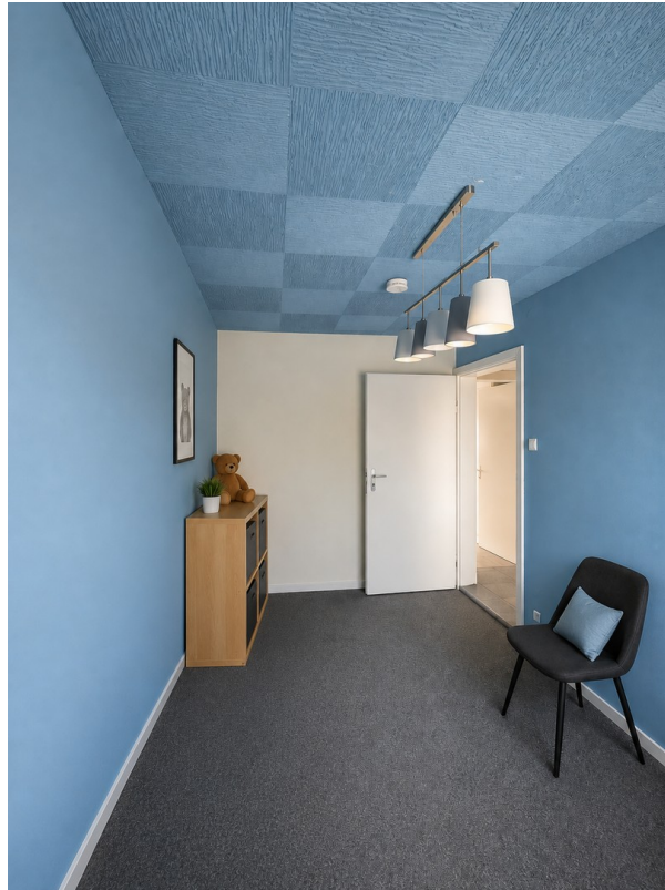
Kinderzimmer Bild 1