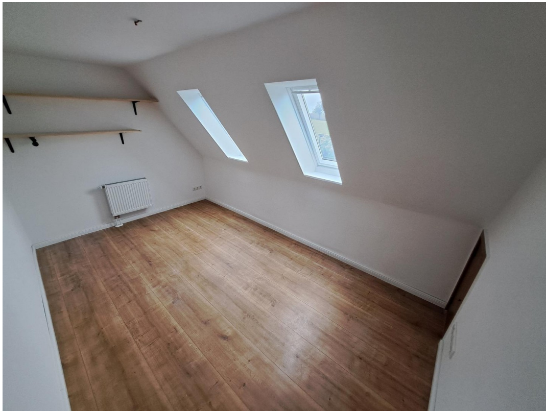
Kleines Zimmer OG