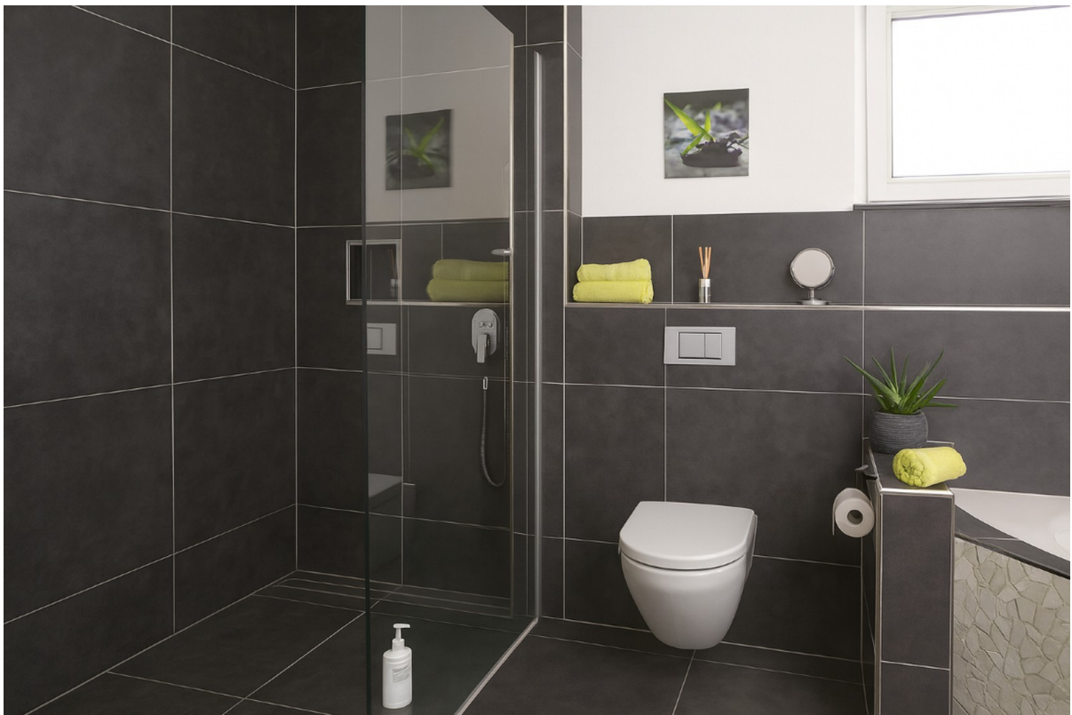
begehbare Dusche im Bad