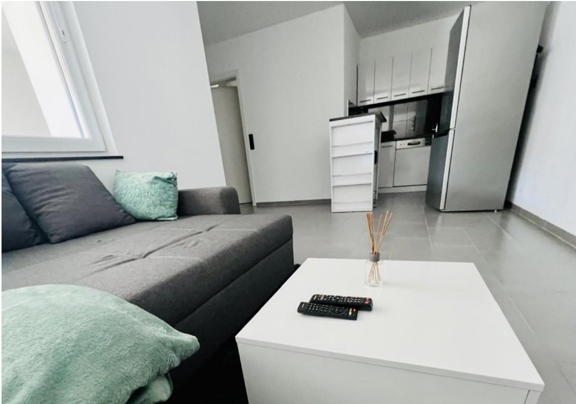
Wohnbereich EG Wohnung