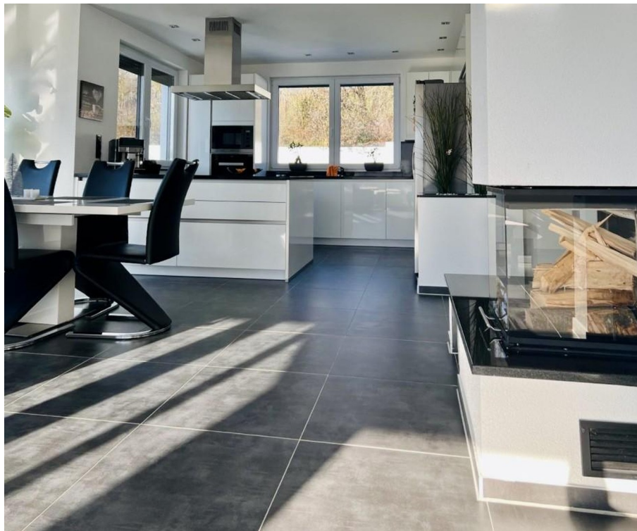
Panoramakamin im Wohnbereich