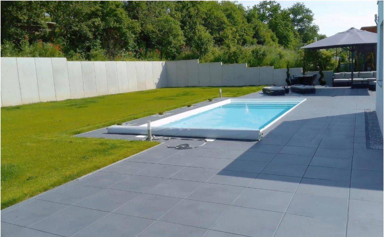
Garten mit beheiztem Pool