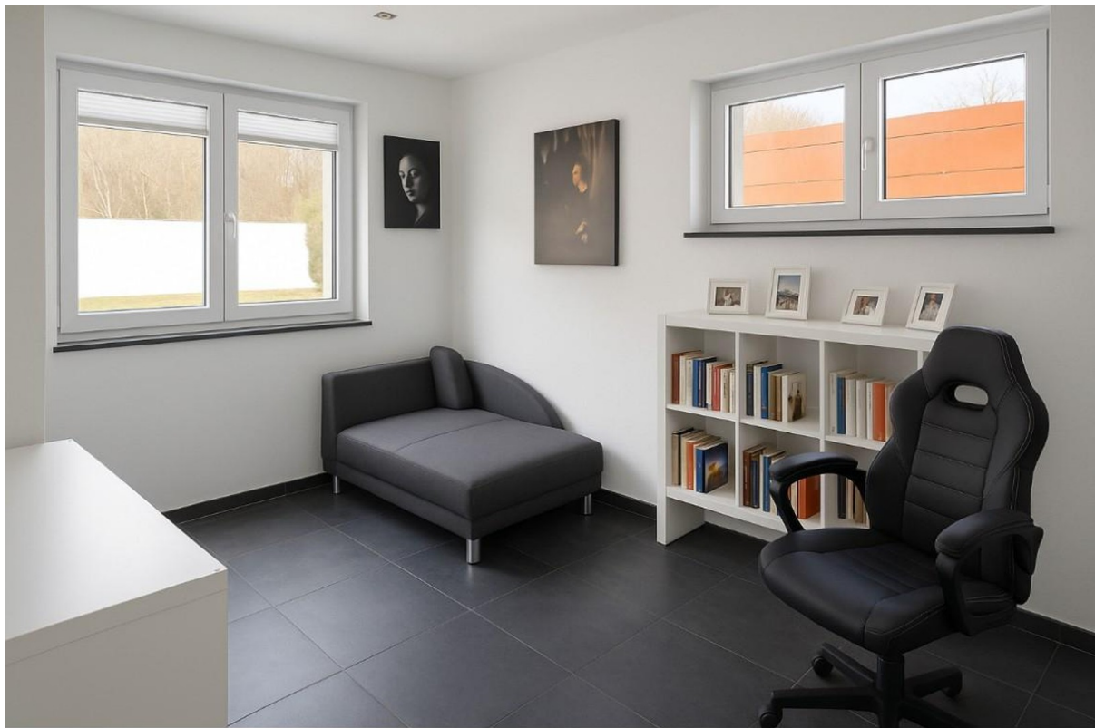
Arbeits- und Gästezimmer