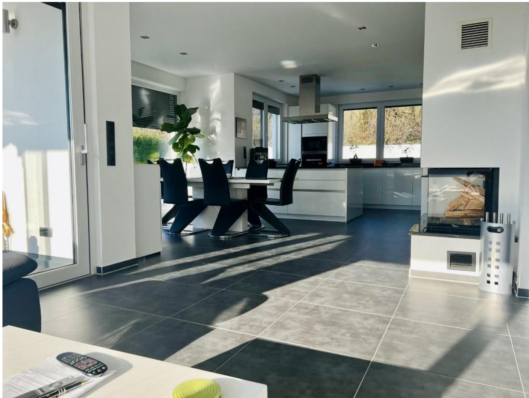
Essbereich / Küche