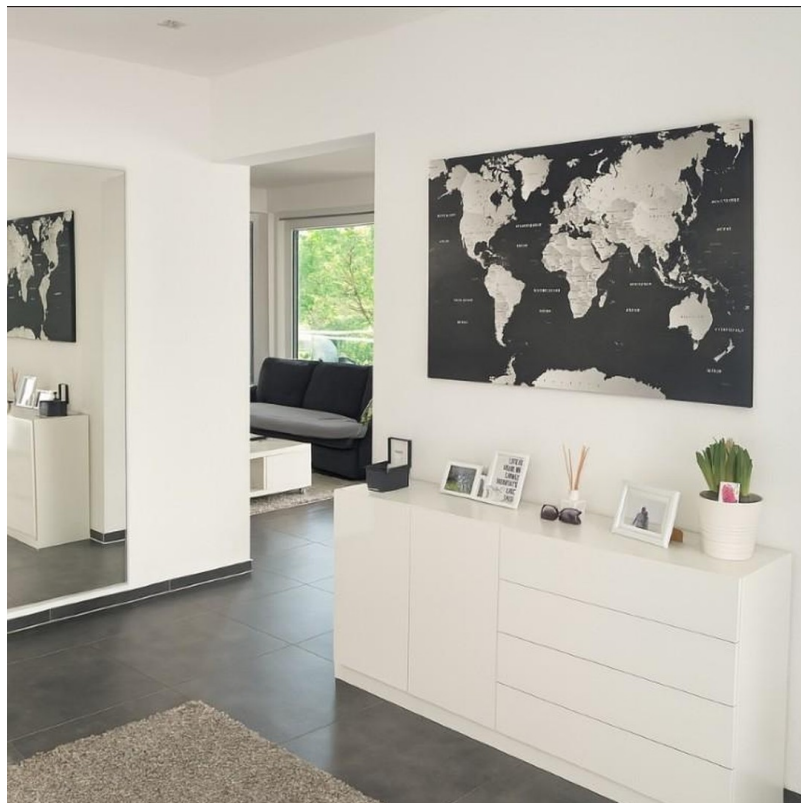
Flur / Garderobebereich