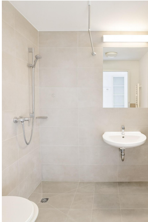
Modernes Badezimmer mit Dusche