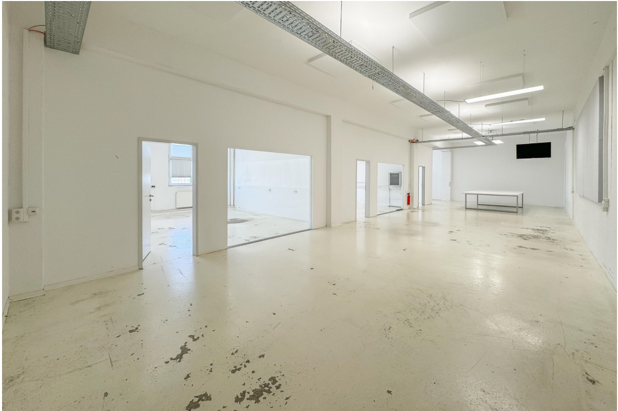
Büro (Industrial Look)