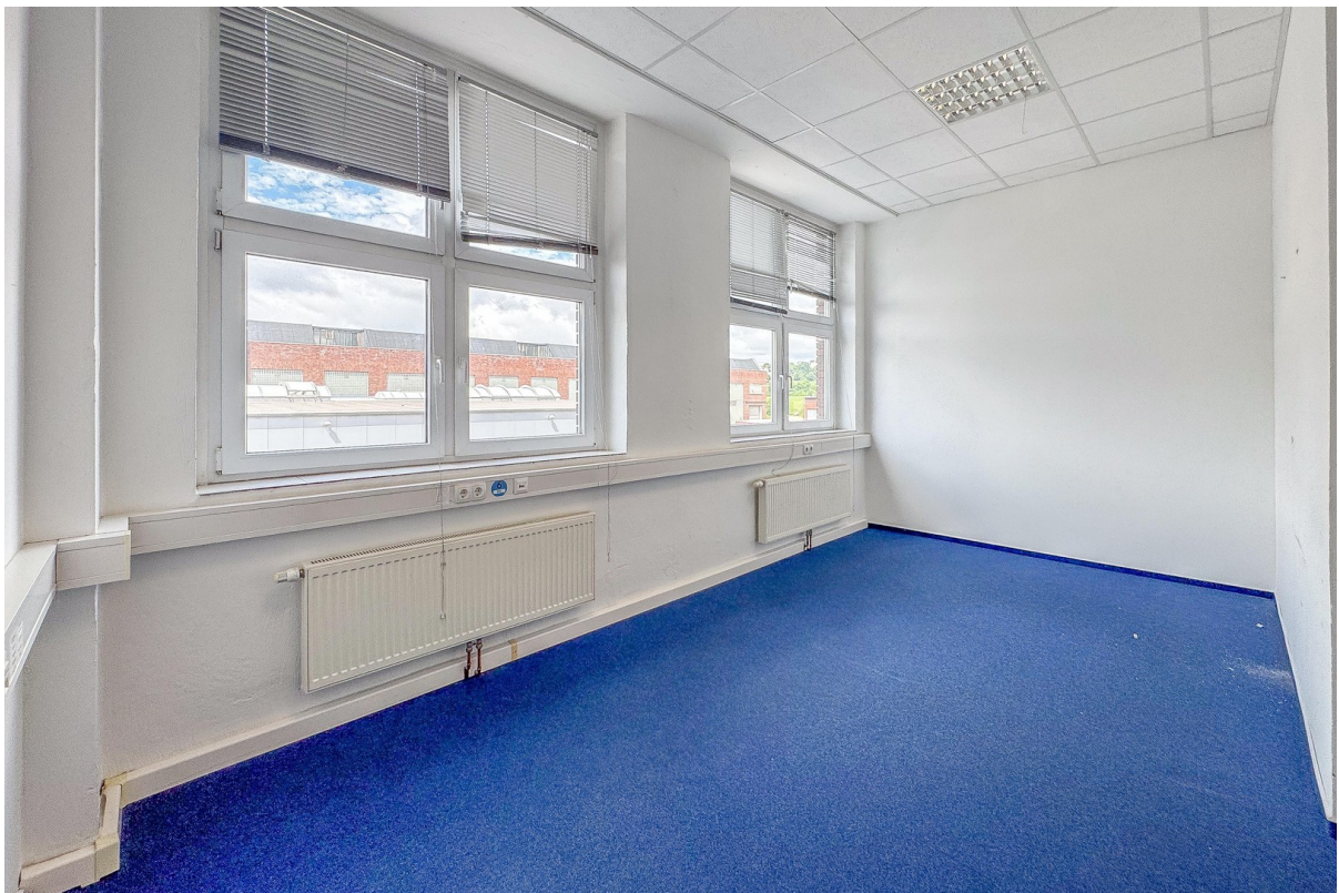
Büroraum 7 - andere Ans.