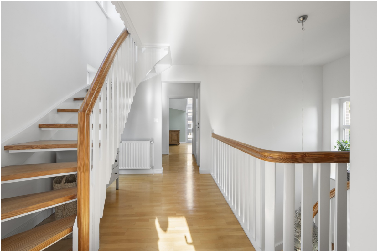
1. OG Flur