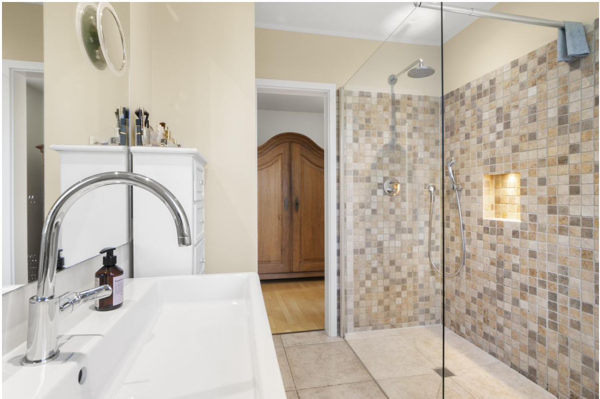
1. OG Bad