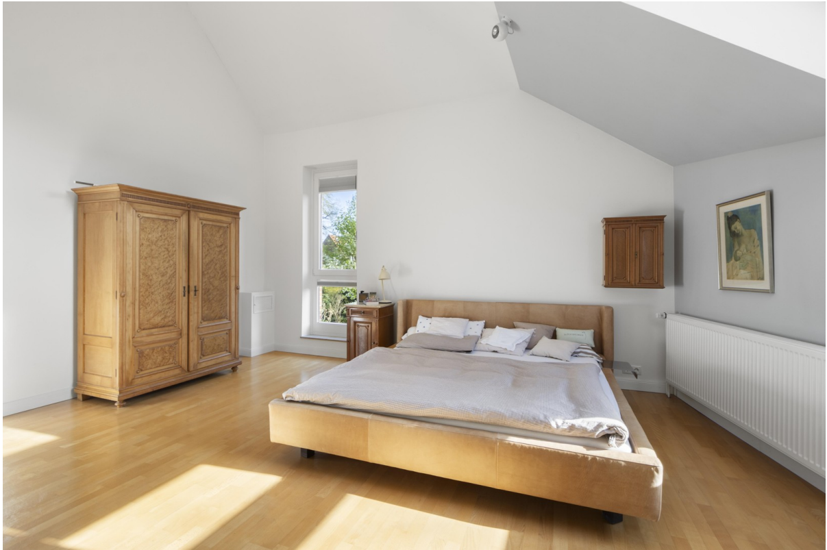
1. OG Schlafzimmer