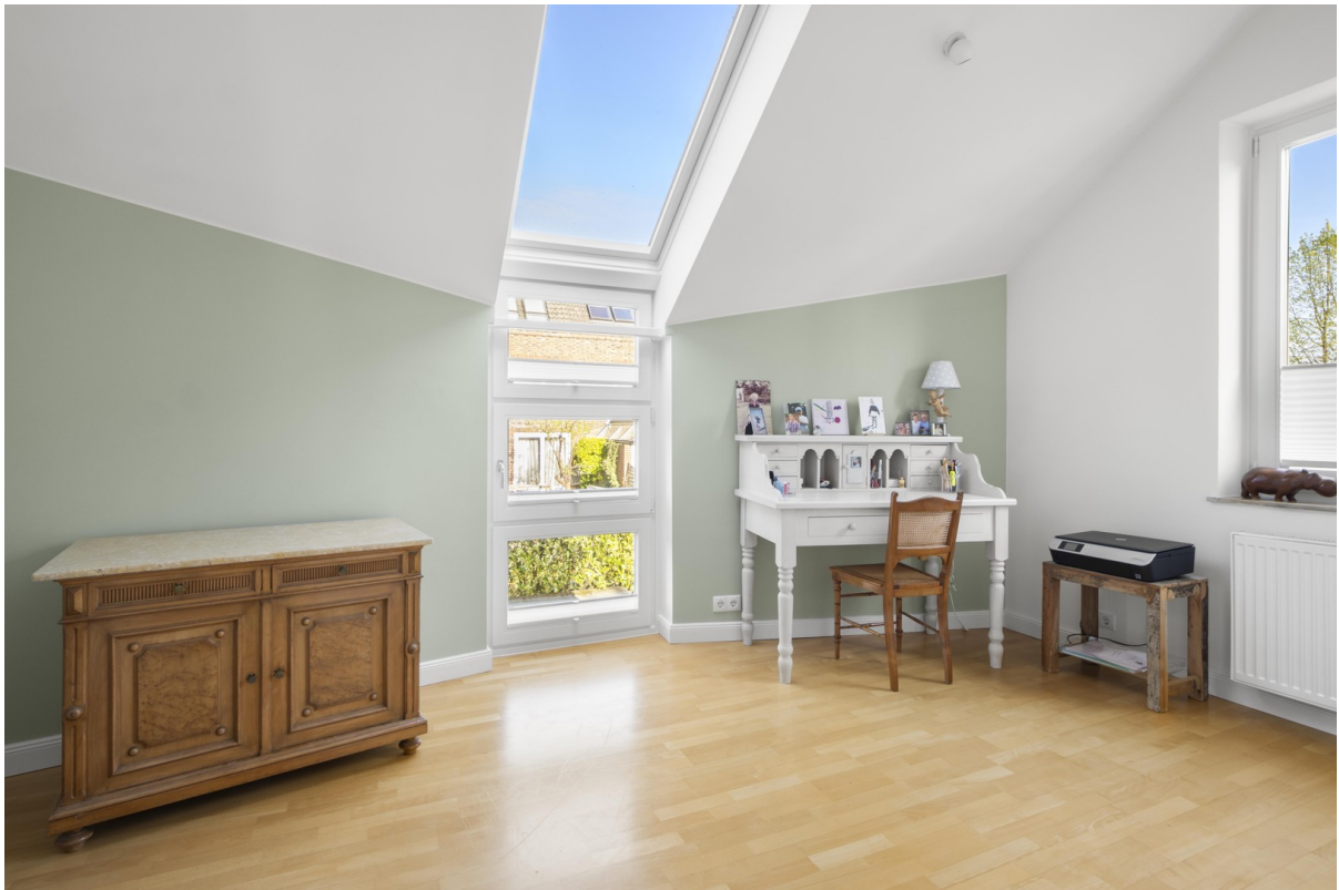
1. OG Schlafzimmer