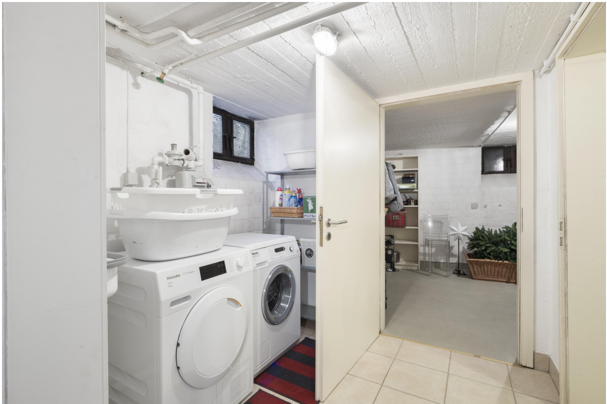
Keller und HWR