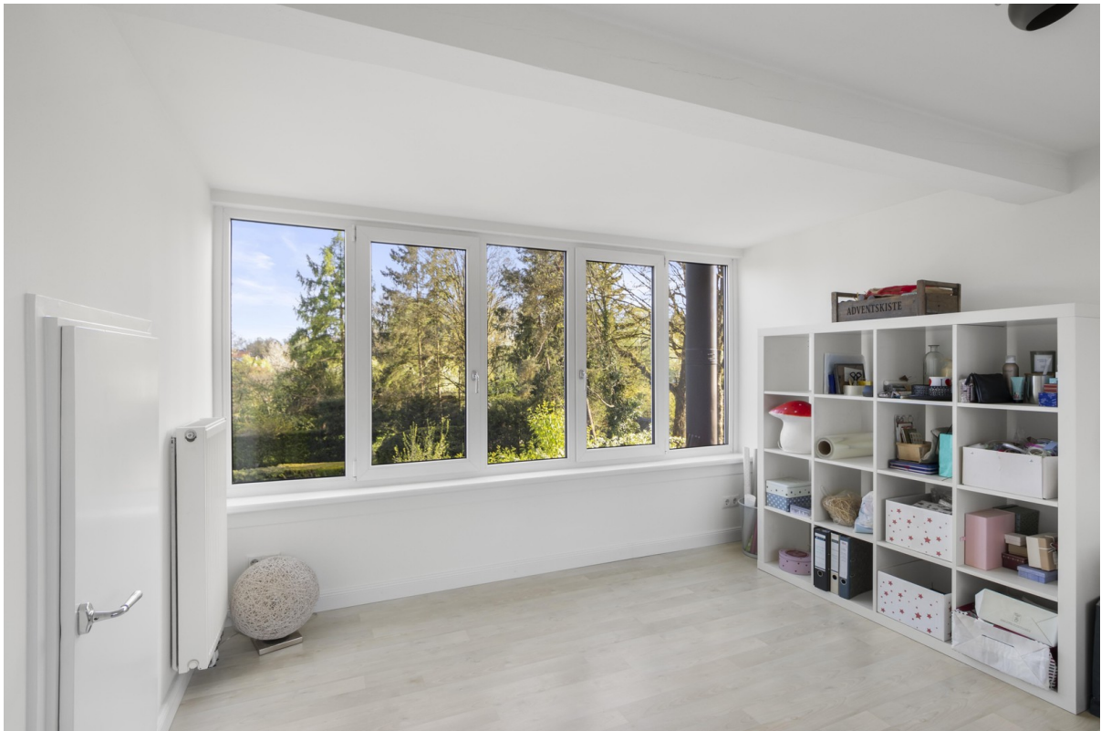
Gästezimmer 2. OG