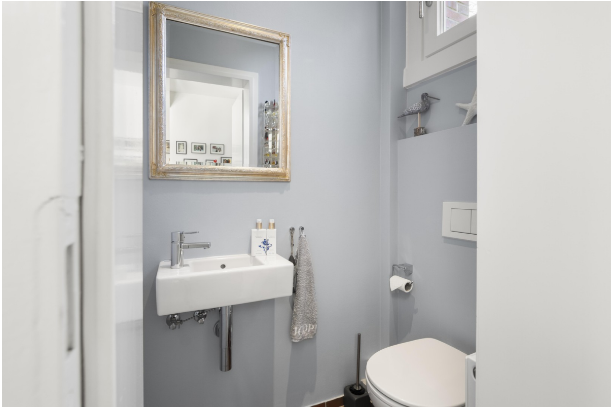
EG Gäste WC