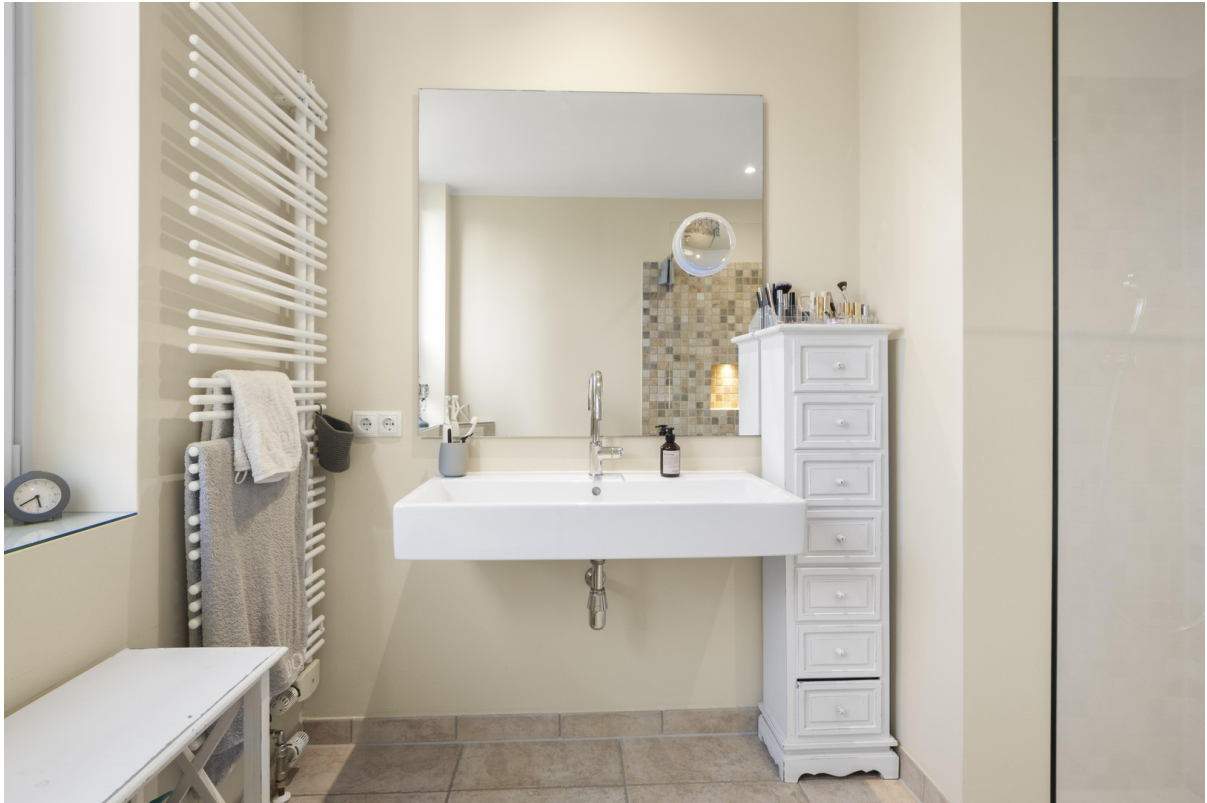
1. OG Bad