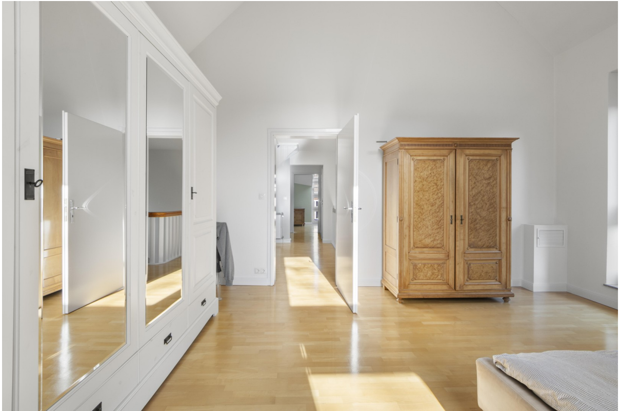
1. OG Schlafzimmer